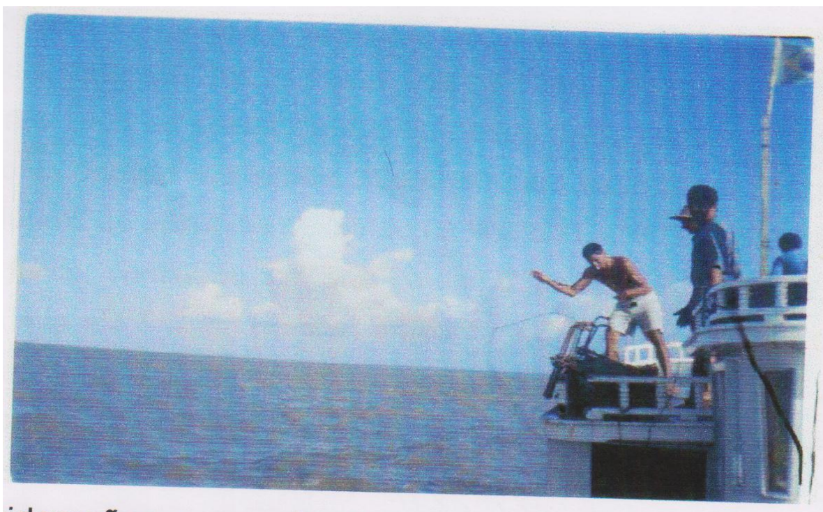
Figura 04. Pescadores em alto mar

Na Ilha do Capim, apenas três famílias possuem barcos que viajam para o oceano, realizando a pesca de geleira. É uma viagem longa, que dura em torno de quinze a trinta dias, chegando até a dois meses, dependendo das condições da pesca. Além da distância, os pescadores dizem que o sono, o sol e o vento forte são fatores que tornam a viagem ainda mais difícil. A figura a seguir mostra pescadores em alto mar, sob o sol forte, preparando-se para puxar as redes de pesca.