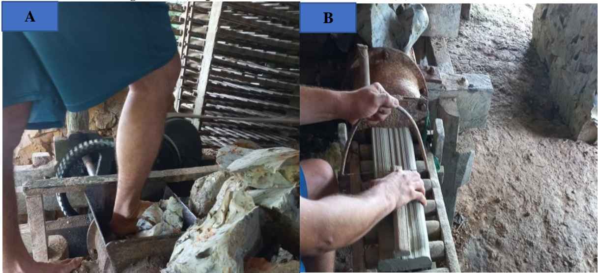
Imagem 2 - (A) argila sendo colocada na maromba e, (B) corte das bolas.