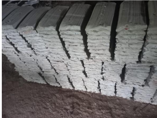
Imagem 3 – Armazenamento das bolas.