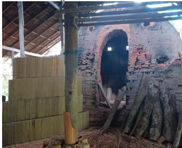
Imagem 6 – Forno da olaria.