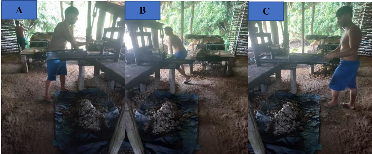
Imagem 4 – Processo de Modelagem “bateção de telha”.