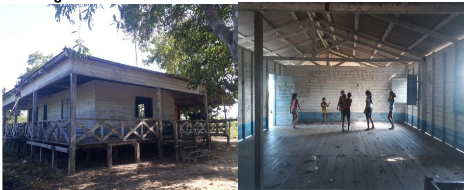
Figura 02 e 03: Estrutura da escola da comunidade Jararí