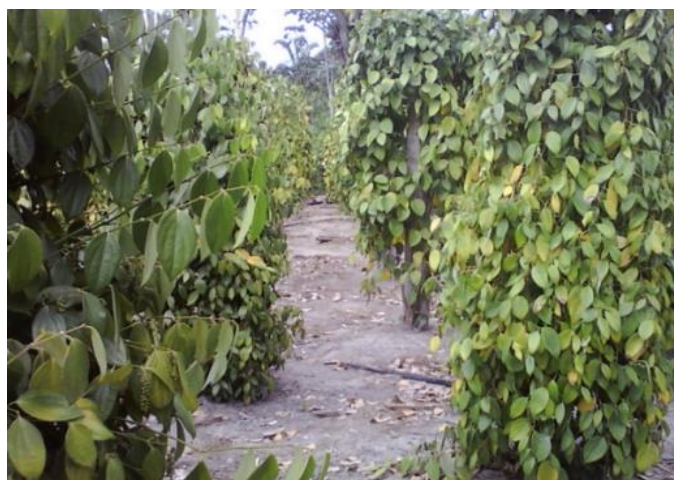
Figura III, Pimenta-do-Reino

Muitas famílias melhoraram suas condições de vida, que na década de 1960, não tinha como comprar bens de consumo duráveis e semiduráveis. Na figura III, tem-se um registro do pimental em tempo de colheita, onde a safra varia entre julho a setembro.