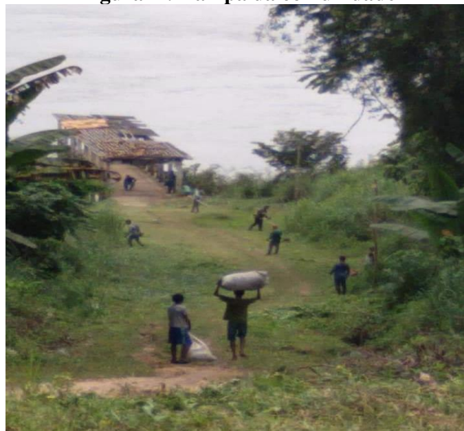
Figura II: Rampa da comunidade

No dia 18 de agosto de 1954, a Irmandade de Calados , reuniu-se e inaugurou a rampa da comunidade, esse mesmo grupo, juntamente com Colonos do Angelim , abriram o “ Ramal de Calados ” para transportar os gêneros agrícolas. A “ Rampa ” mudou radicalmente a vida das famílias remanescente de quilombo em Calados, trouxe benefícios que sem a Rampa provocava uma longa espera pelo Regatão. Viajar durante dias e dias para comercializar seus produtos na capital era comum, assim como, tudo ia e vinha de Belém-PA, único polo econômico da região. Na figura II, mostra a Rampa em período atual, onde está sendo muito usada, por conta das enchentes no período de inverno amazônico.