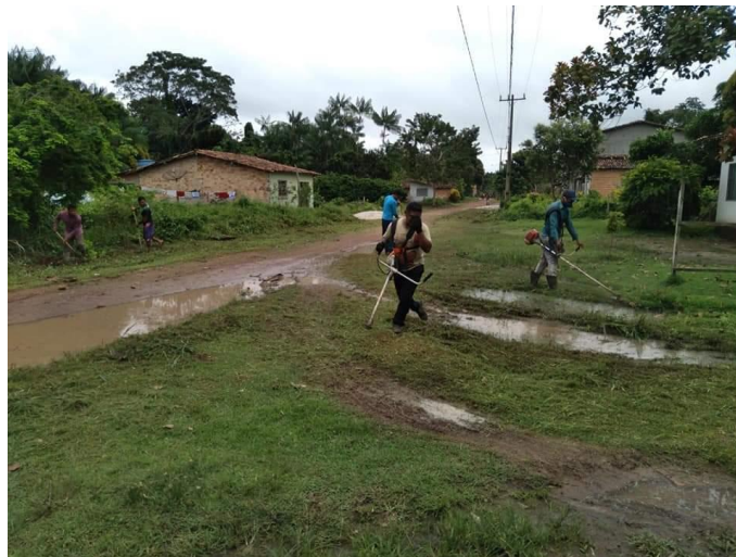
Figura VIII: limpeza nas ruas