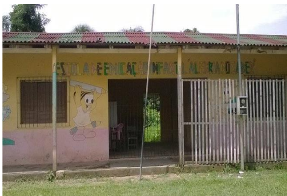
Figura IV: Fonte, Medeiros, 2021

do ensino Fundamental e Médio passaram a estudar na nova escola, os da Educação Infantil, continuaram na segunda escola.