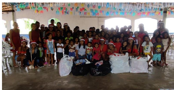
Figura IX: Registro do natal solidário

Diante disso, ressalta-se o papel das mulheres e dos jovens na comunidade remanescente quilombola de Calados quanto aos movimentos onde os mesmos fazem as ações voltadas para as crianças, como natal solidário, figura X, com os jovens, que é a permanência do cursinho popular com professores voluntários da própria comunidade, além da participação em assembleias, encontros regionais e encontros de formação que ocorrem de forma interna e externa.