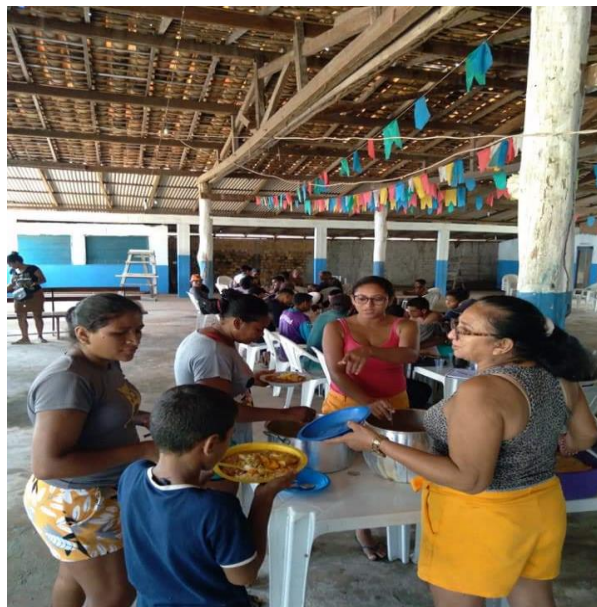
Figura VII: Ação coletiva, momento da refeição

Hoje a comunidade tem o posto de saúde com dois técnicos e um coordenador. Além disso, são realizados mutirões na comunidade, organizadas pelos próprios moradores e com o apoio das organizações que existem na comunidade, tanta a Igreja católica, evangélica, associação quilombola e os próprios moradores com trabalhos voluntários e doações de alimentos, figura VII.