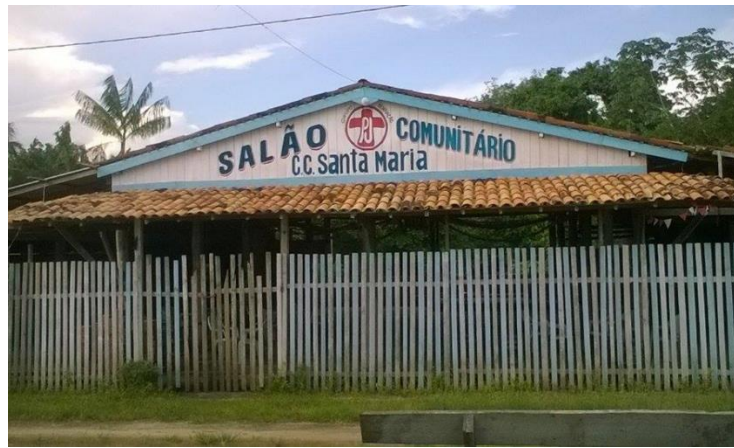
Figura I: Salão comunitário

Atualmente, ainda há a festa dançante, porém, sem bebidas alcoólicas 4 , fazem comidas, salgados e outros, para serem vendidos no local durante o festival de prêmios que também acontece durante a festa no salão comunitário, na Figura I, pode-se perceber o tamanho do mesmo e a importância para receber pessoas que vem de outras comunidades vizinhas.