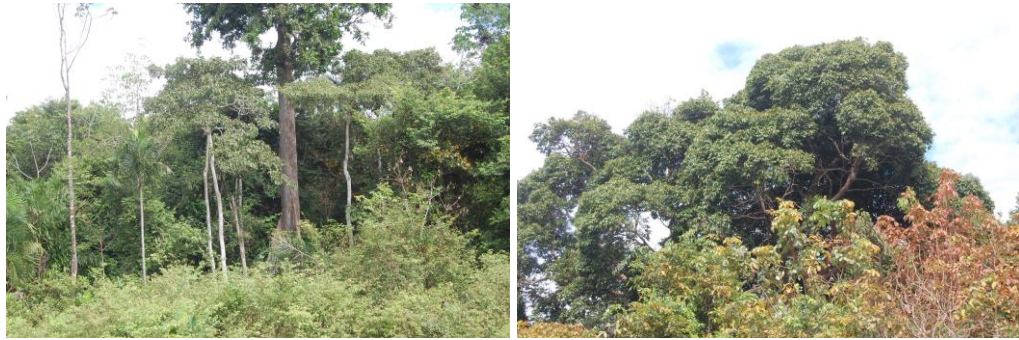
Figura 5. Imagens do PEAEX Majari sobre a vegetação.