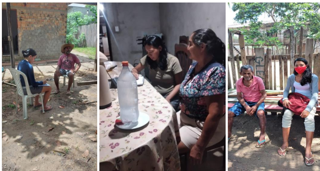
Figura 1. Realização das entrevistas no PEAEX MAJARI

As entrevistas foram realizadas nas residências dos assentados como mostra nas imagens (Figura 1).