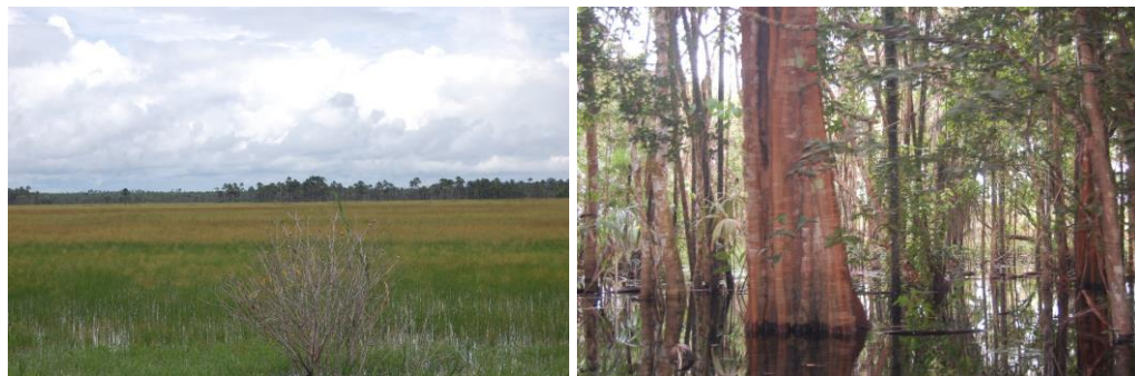
Figura 4. Imagens do PEAEX Majari sobre a vegetação.