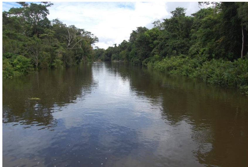
Figura 3. Rio Majari, principal via de acesso ao assentamento utilizado principalmente pelos comunitários assentados.

O “Projeto foi instituído em 2009 pelo Instituto de Terras do Pará (ITERPA), tendo a maioria de área coberta por floresta nativa Ombrófila densa, com áreas divididas em terra firme, áreas úmidas e campinaranas amazônicas (Figuras 4 e 5). Formado pelas comunidades Espírito Santo e São João, o tamanho médio das propriedades é de 129 hectares, demarcadas pelos próprios comunitários, que as denominam “limites de respeito” (BORGES, 2018).