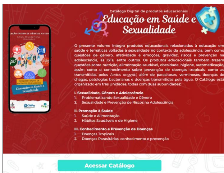
Figura 1: Catálogo Digital de Educação em Saúde e Sexualidade na página do repositório digital da Coleção.