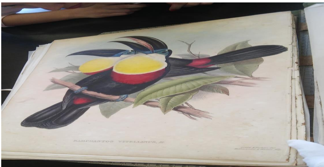
Fotografia 5- Prancha desenhada na obra de John Gould 7