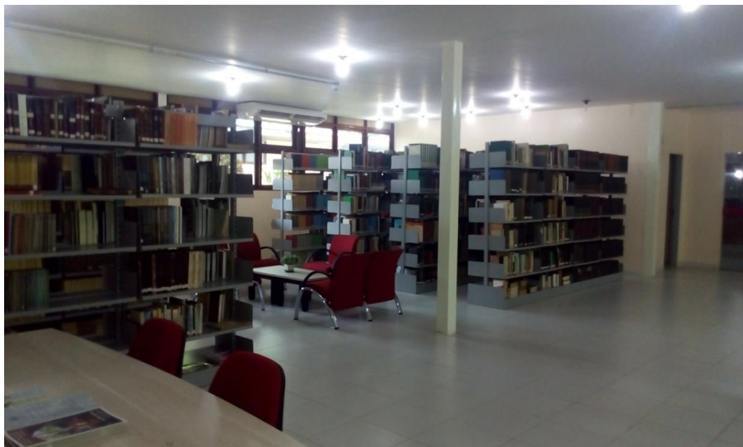
Fotografia 2 - Salão principal de leitura e obras de referência

Hoje o serviço de informação, atende os usuários de diversas Instituições, disponibilizando seu acervo (Fotografias 2 e 3) para pesquisas e divulgação dos materiais produzidos na própria instituição, por seus bolsistas e pesquisadores.