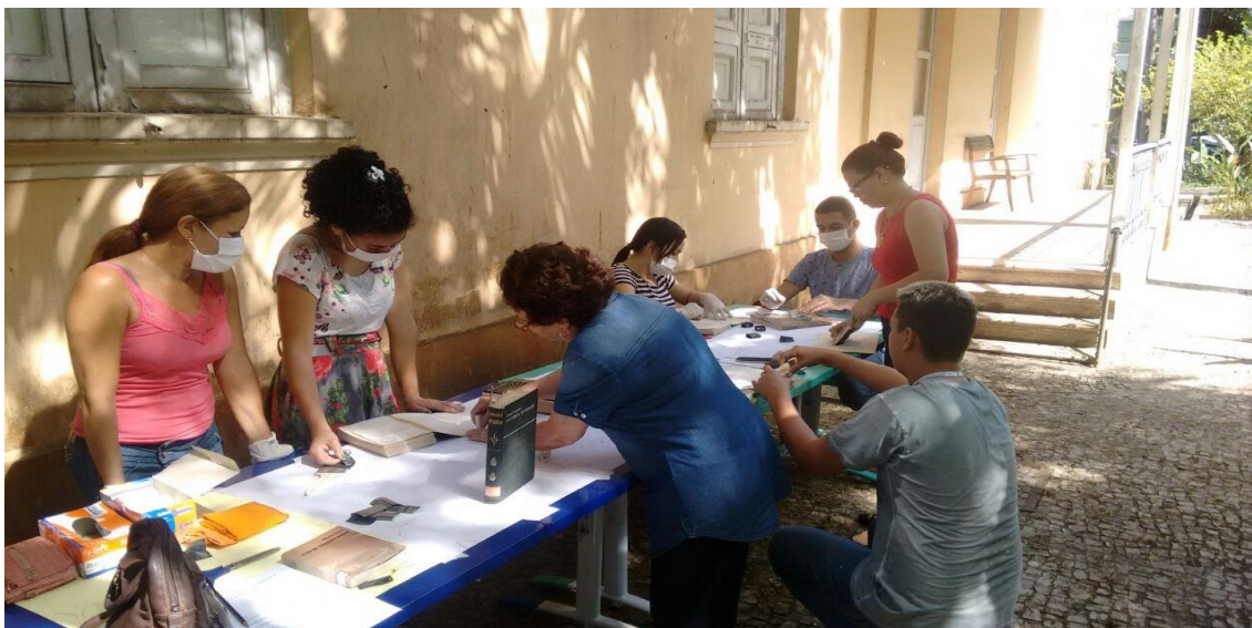
Fotografia 9- Oficina de Monitoramento de coleção

Fonte: Elaboração de Alexandre Ribeiro, 2017.