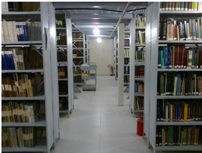
Fotografia 3 - Segundo salão onde se encontra maior parte do acervo de livros e periódicos da Biblioteca