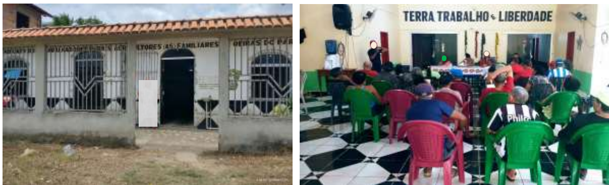
Figura 2. Aspecto do sindicato dos trabalhadores rurais de Oeiras do Pará.