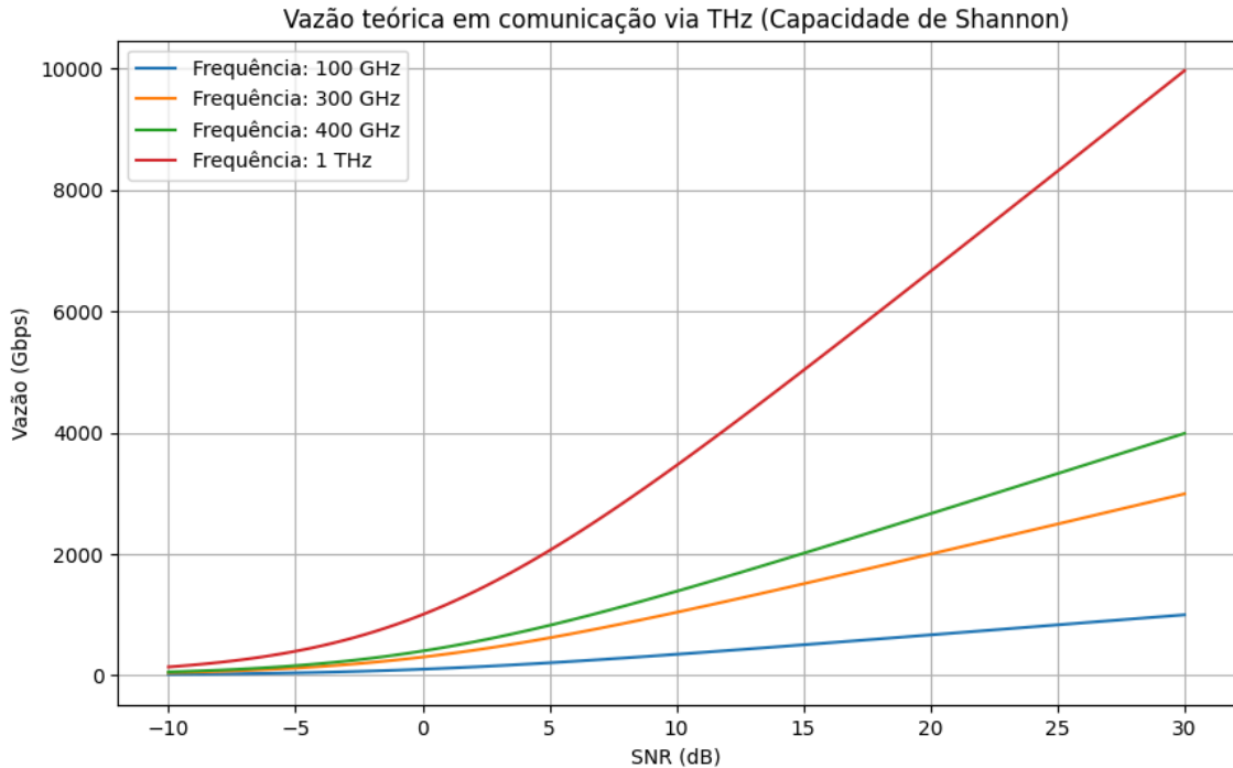
Gráfico 2 – gráfico com relação de perda de 4 frequências 100 GHz, 300 GHz, 400 GHz, 1 THz

O gráfico da Capacidade de Shannon mostra a vazão teórica (em Gbps) em função do SNR para diferentes frequências (100 GHz, 300 GHz, 400 GHz e 1 THz). Observa-se que: