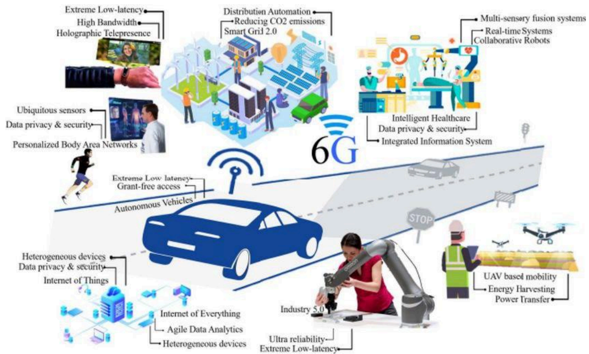
Figura 1 – Aplicações 6G emergentes.