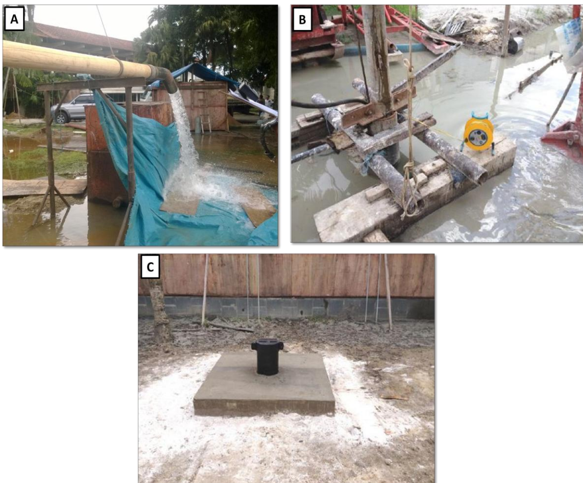
Figura 4: A) Foto que mostra o bombeamento da vazão máxima da bomba para teste de vazão contínua. B) Medidor de nível usado para medir o nível da água no poço. C) Imagem que mostra o produto final, com a construção da base de proteção superficial do poço.