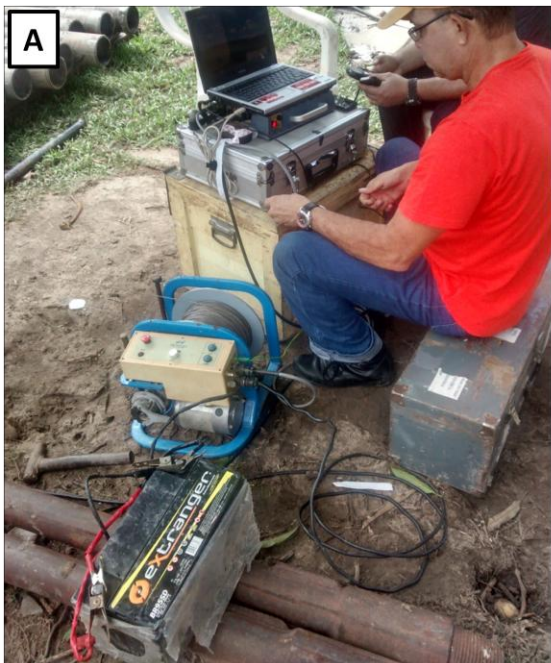
Figura 3: A) Fotografia que mostra a execução da perfilagem geofísica. B) Imagem que mostra no detalhe à esquerda os tubos de aço de carbono e à direita os filtros de aço inox. C) Fotografia que mostra a colocação do pré-filtro. D) Imagem em detalhe do tanque para medição de vazão.