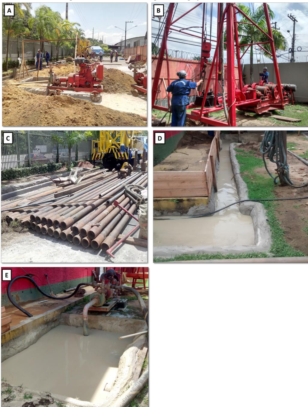
Figura 2: A) Vista geral da área de trabalho. Com a montagem da barraca ao fundo e preparação da área, com montagem dos equipamentos para o início dos trabalhos de perfuração. B) Equipamento chamado de perfuratriz, utilizado para perfurar o poço. C) Hastes de perfuração, que é colocada no poço através da haste de perfuração D) Canaleta por onde escorre o material que sai da perfuração. E) Tanque com a bomba do circuito de lama para onde vai o material que sai do poço.

perfil litológico do furo (Figura 2 –D). Após o término da perfuração de sondagem e a execução da perfilagem geofísica, é feito o alargamento do poço, permitindo assim a instalação da tubulação de encamisamento do poço.