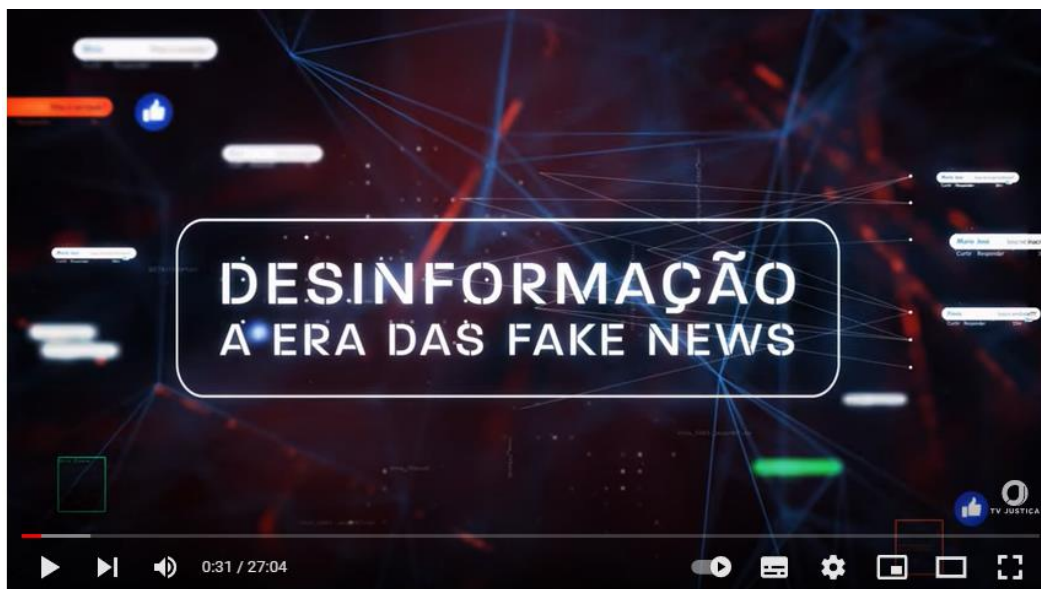
Figura 3 – Documentário

Em seguida reproduza o seguinte documentário: Documentário – iniciativas que buscam combater as Fake News: