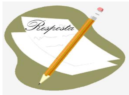
Figura 2 – Gênero resposta