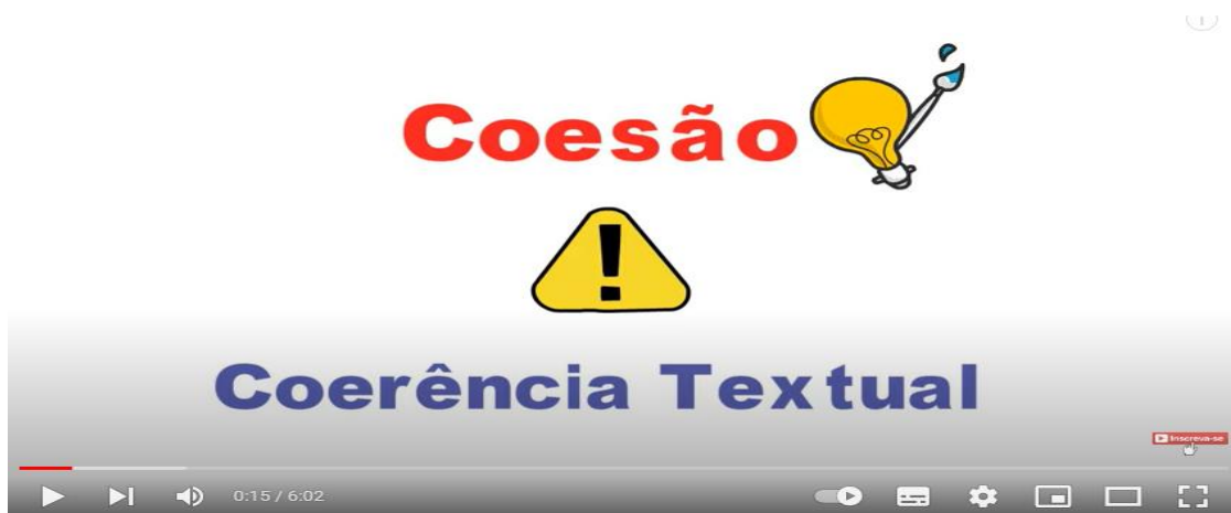
Figura 5 – Videoaula