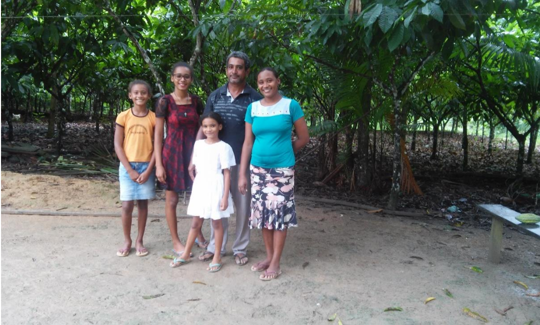
Figura 3 família. Fevereiro 2019

Esta família morava na vicinal 57 e também mudaram para vila há três anos para dar a oportunidade de estudo as filhas, mas mantêm o lote na vicinal em que retiram se próprio consumo além das pequenas criações. Na chácara dispõe de uma plantação de cacau que e a renda familiar, “[...] minhas filhas, meu marido e eu sempre estamos na colheita de cacau às meninas ajudam no período que não estão na escola [...] ”. Uma dificuldade encontrada pela família é o sol quente que dificulta seu trabalho, porém acreditam que a vida no campo, mesmo com dificuldade, tudo que se planta com carinho esforço e gratidão a terra o retribui com uma produção magnífica que é seu sustento. Segundo Caldart (2004) o processo de construção da identidade de fato, é: