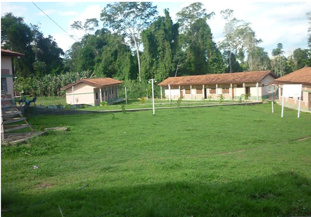
Figura 7, CFR (casa familiar rural). Fonte Caroliny de Andrade, Abril de 2011.