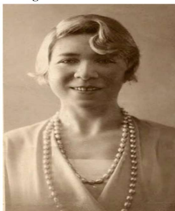
Figura 1 – Alfonsina storni