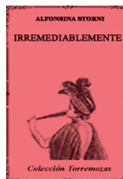
Figura 3: libro irremediamente