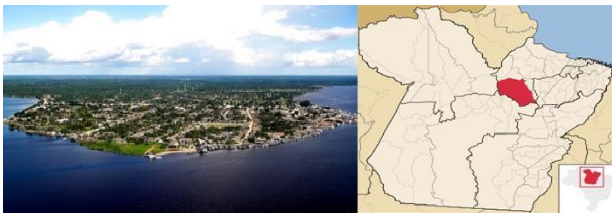
Figura 1: Vista aérea do município de Portel/Pará.