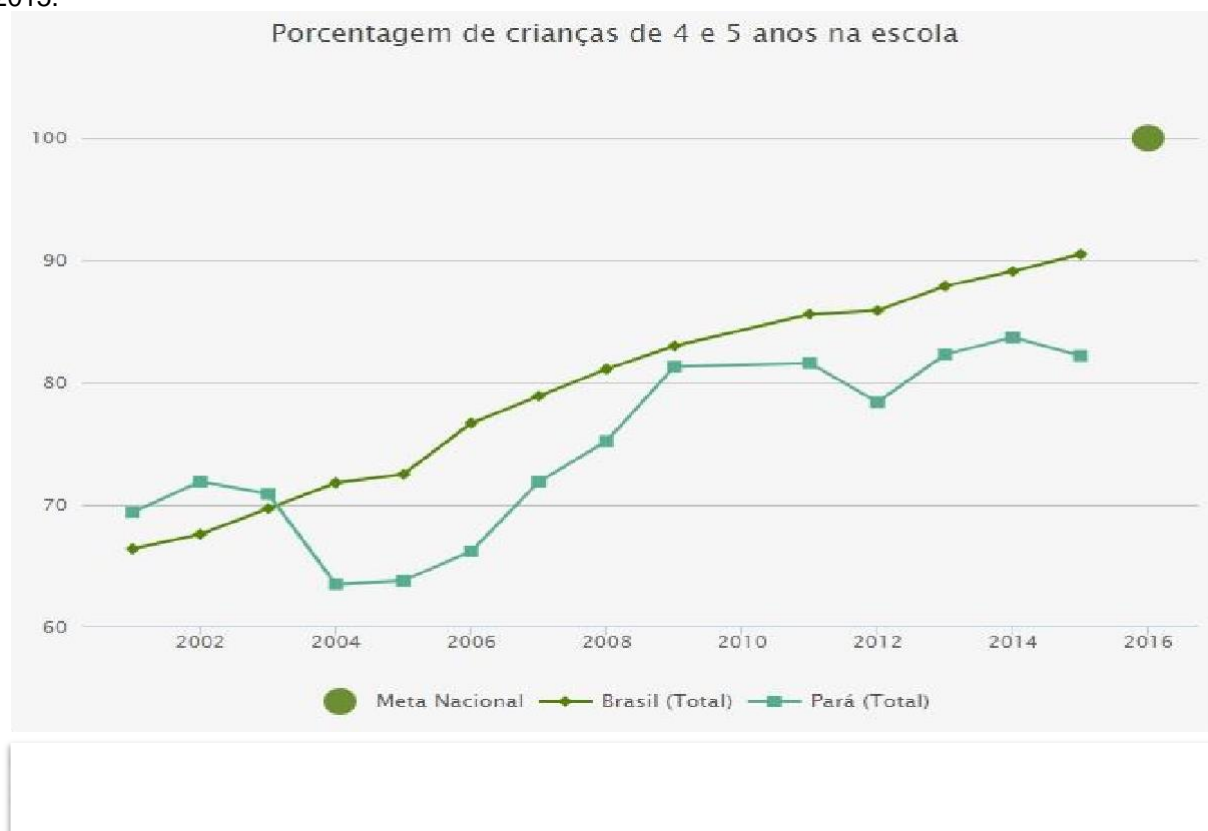
Gráfico 2: Comparativo nacional e estadual de Percentual de crianças de 4 e 5 anos na escola até 2015.