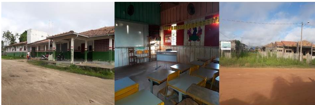
Figura 2: 1ª foto Escola de Educação Infantil Ana Margarida Portel/Pará. 2ª foto Sala de aula da educação infantil na escola Elmo Balbinot (zona rural). 3ª foto Obra de Escola de educação infantil paralisada