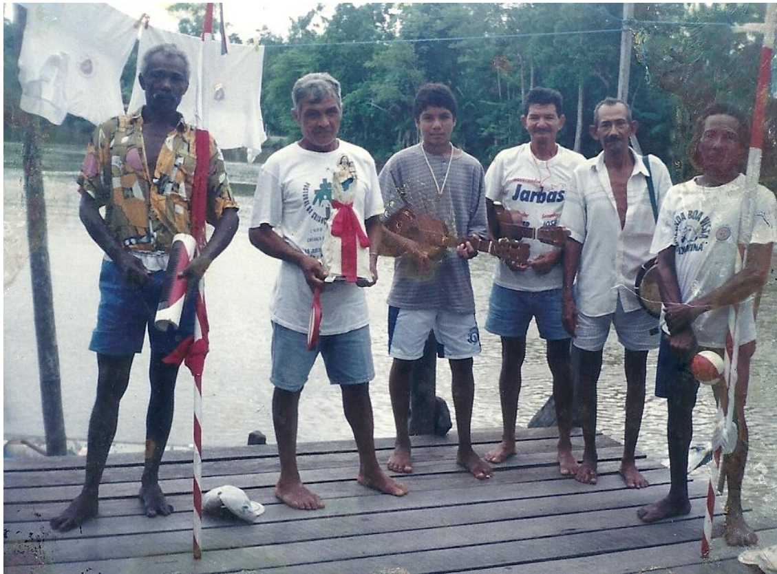
Figura 2- Imagem da folia de Nossa Senhora de Nazaré Rio Caripetuba.