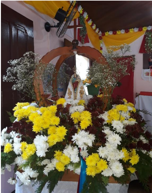
Figura 6- Imagem original de Nossa Senhora de Nazaré.