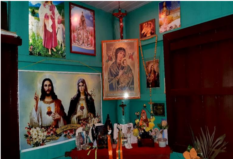
Figura 4- Oratório de Dona Maria Duparto

Fonte: Silvia Leticia, acervo pessoal (2020)