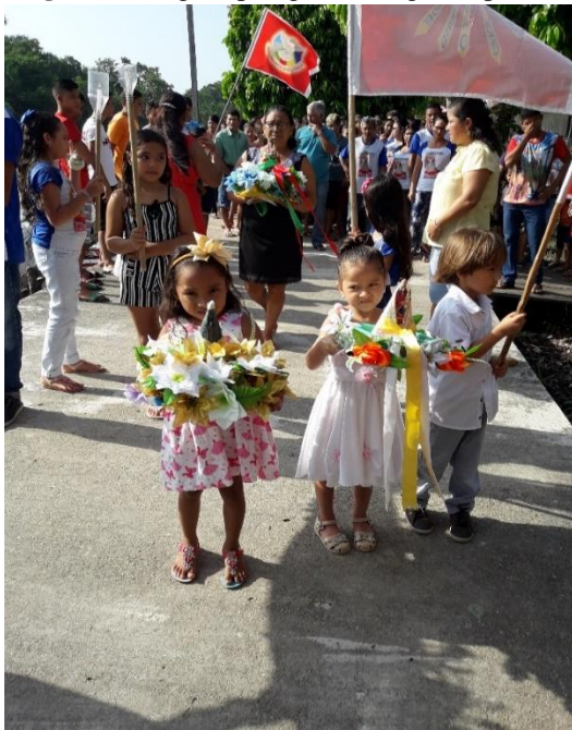
Figura 7- Imagens peregrinas chegando para a celebração que finaliza as novenas.