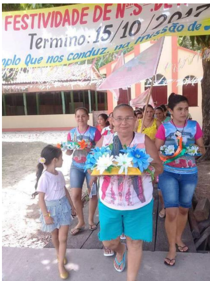
Figura 5- Grupos saindo em missão.