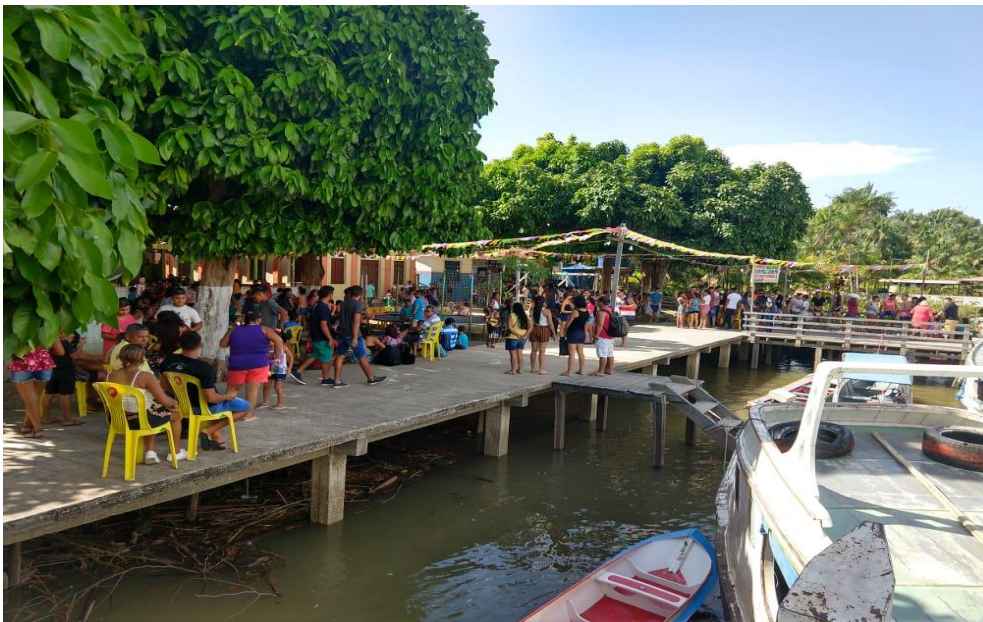
Figura 11: Domingo da Festa.

O domingo é o grande dia da festa, quando acontece a missa presidida pelo Padre da Paróquia das ilhas, com início às 09h00min horas da manhã. A missa é um momento muito importante e assume um sentido ainda de muito respeito pela comunidade e dos que dela participam nesse momento de fé. A igreja fica totalmente lotada, sem espaços para mais pessoas, muitos são os que ficam pelos arredores da igreja, no arraial, na barraca. Na imagem a seguir se tem o registro do domingo da festividade.