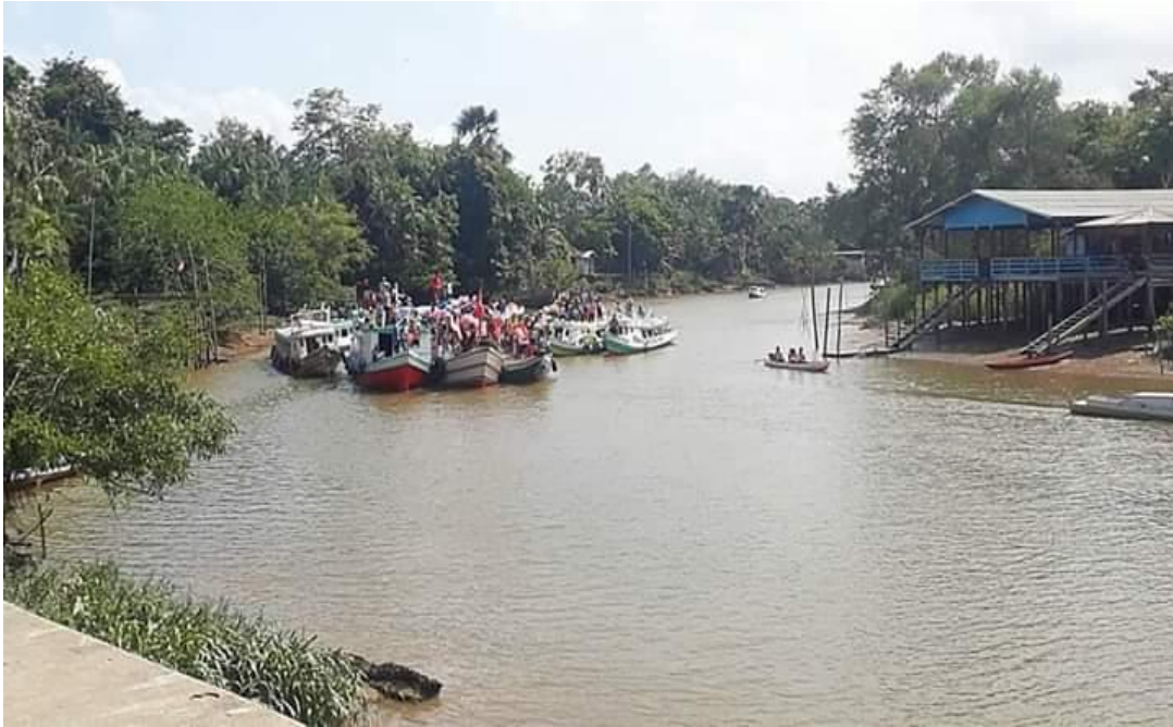
Figura 10: Passagem do círio.