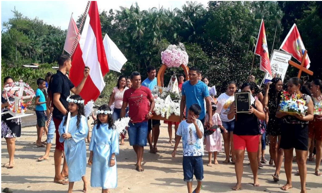
Figura 8- Imagem da saída do círio.

Neste sentido, há muitos objetivos que levam os fiéis a se unirem e reunirem no momento de um círio, porém a crença predomina sobre a coletividade, assim como a cultura, a religiosidade e a busca do conviver em sociedade.