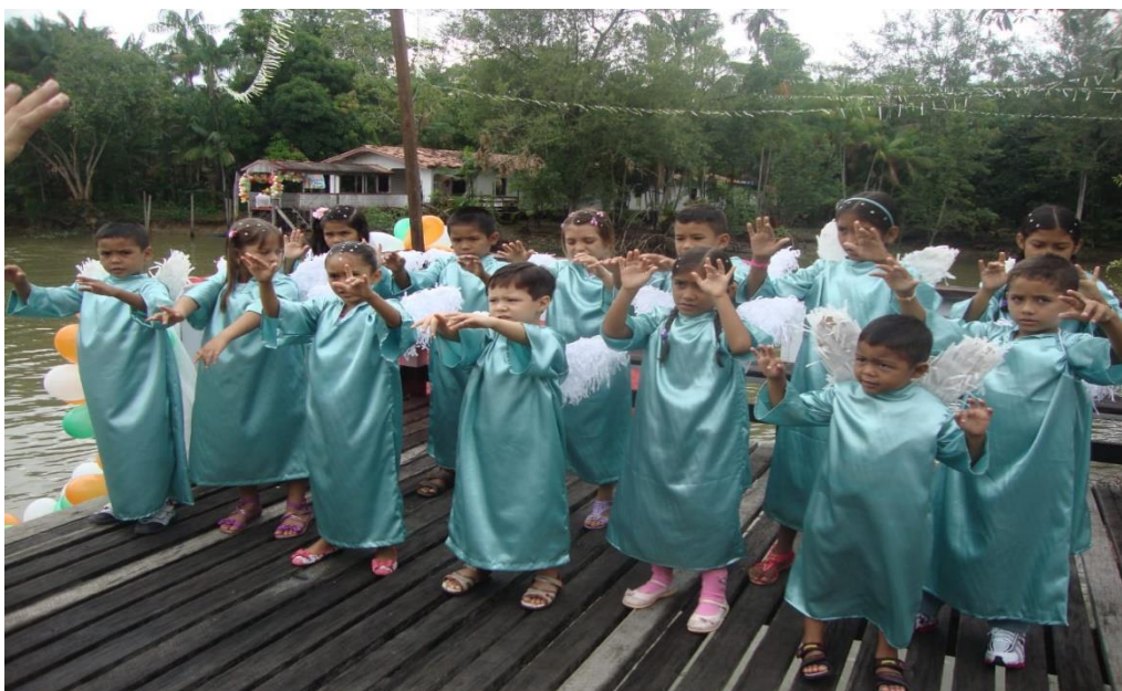
Figura 9- Crianças fazendo homenagens.

As homenagens são sempre organizadas sejam elas na frente das casas, sejam nas embarcações, os grupos de catequese e em alguns momentos a escola organizam as crianças para também homenagearem a padroeira na passagem do círio, o que ilustra a imagem 9, logo após, a imagem da passagem do círio.