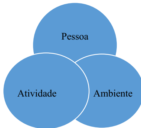
Imagem 3 – Esquema da relação entre pessoa, atividade e ambiente