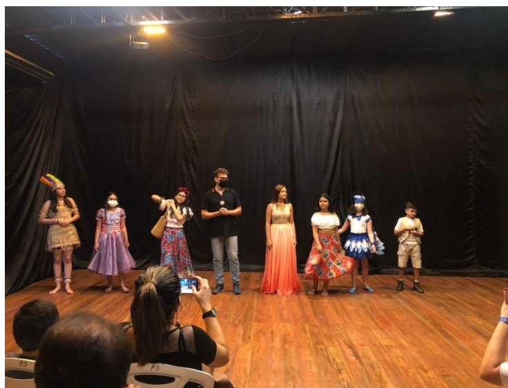
Imagem 28 – Incena Belém.

Esta dramaturgia ganhou espaço na cidade de Belém do Pará na escola de teatro Incena Belém, no projeto realizado pelo artista e professor de teatro Odin Gabriel Godino, fazendo uma leitura dramatizada com crianças da escola.