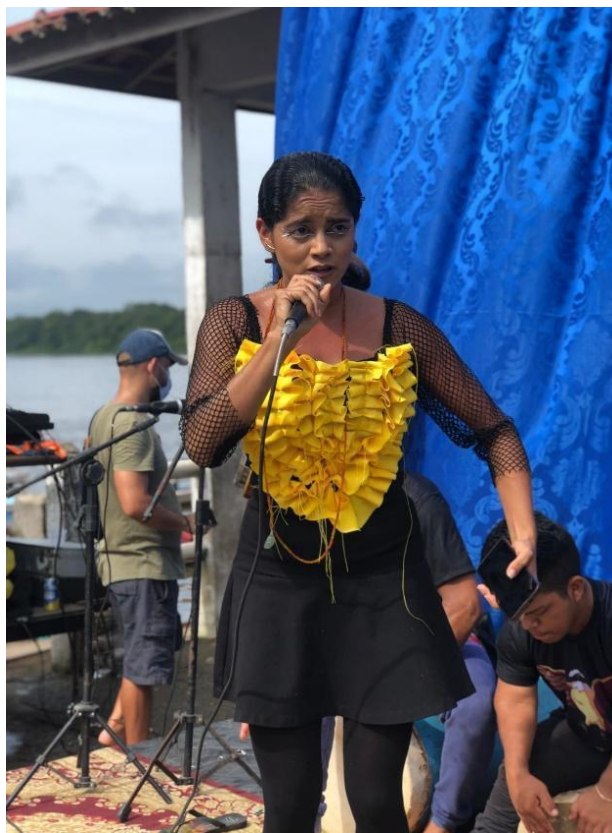
Imagem 22 – Figurino.

O figurino que usei no dia do evento foi confeccionado a partir de minhas habilidades com a costura, costura essa que vem marcando o cenário teatral mocajubense desde o ano de 2019, quando foi ministrada a oficina de teatro e costura com o tema “Teatro e costura: Costurando vidas de mulheres mocajubenses”. Este figurino foi pensando no bater das asas e no pulsar do pássaro bem-te-vi, se utilizou de tons que remetiam à visualidade do bem-te-vi, tons preto e amarelo. A cor amarela ficou em evidência por ser também a cor que destaca o pássaro bem-te-vi.