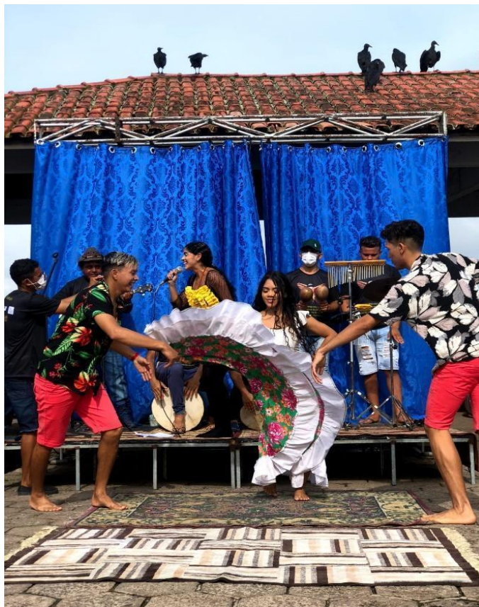
Imagem 21 – Bailarinos.