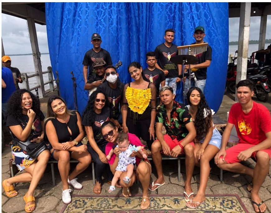
Imagem 24 – Parte da equipe.