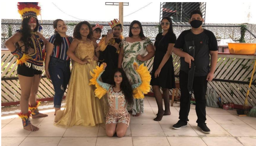
Imagem 27 – Turma do 9º ano (2021).