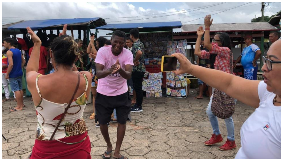
Imagem 26 – Povo Mocajubense.

Ao final do show, alguns feirantes e moradores me cumprimentaram agradecendo pelo momento vivido e pelo destaque à cultura popular.