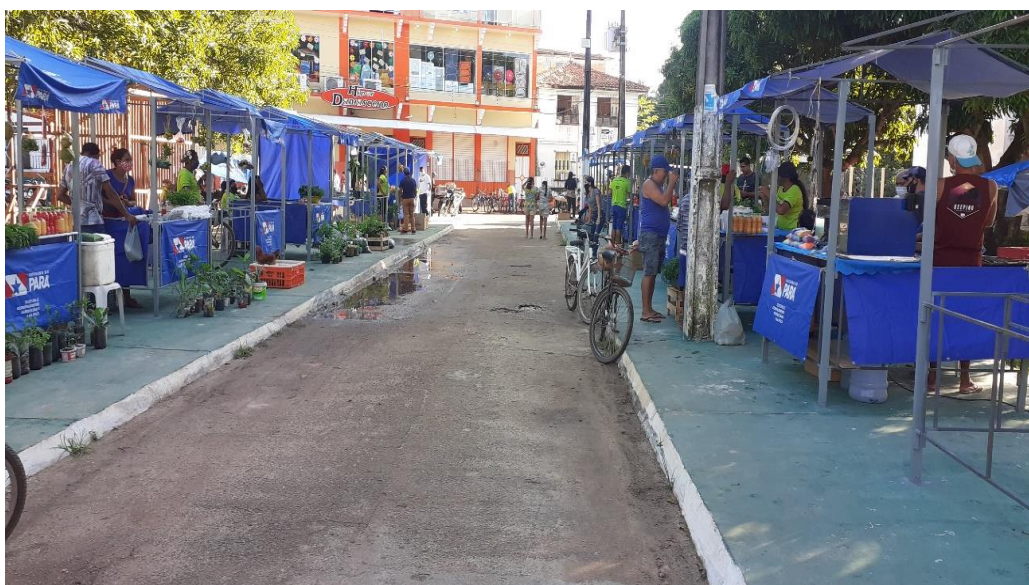
Figura3:- Feira do agricultor localizado no centro comercial da cidade.

Segundo dados do posto de saúde, a comunidade de Jagarajó possui hoje 126 famílias e 464 habitantes, segundo as pesquisas feitas em 23 de dezembro de 2021. A comunidade também tem como referência outras povoações próximas, como Antônio Vieira, Mangabeira e Rio Fabrica. Contudo, a sede do município de Ponta de Pedras se configura como o principal centro de serviços, sobretudo de comércio para a comunidade, conforme mostra a figura 3, da feira do agricultor, que é destinada para os agricultores das comunidades comercializarem seus produtos.