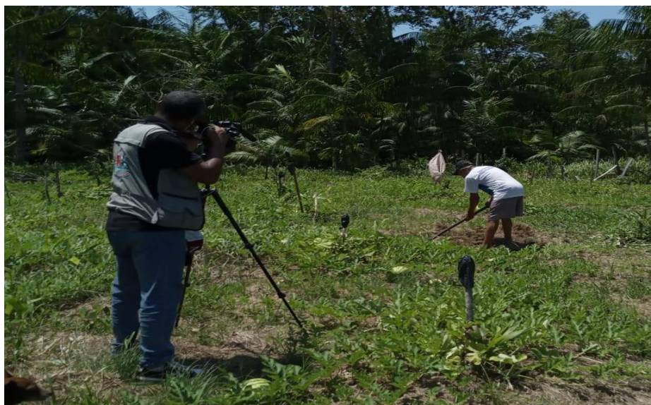
Figura 6- Melhor produção após acompanhamento técnico.

Secretaria Municipal de Agricultura (SEMAGRI) (2021).