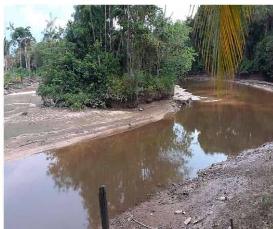
Figura 2-Rio Jaguarajó.