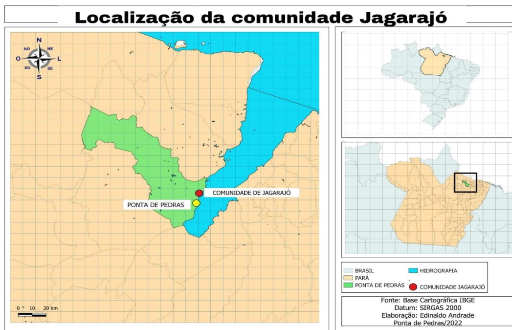
Mapa 1 - Localização da comunidade de Jagarajó em Ponta de Pedras-PA.