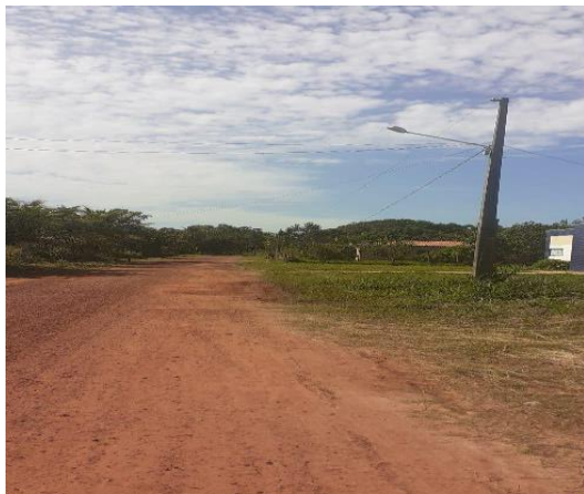
Figura 1-Rodovia PA 154.