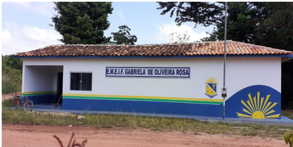
Figura 4 - E.M.E.I.F Gabriela de Oliveira Nobre.