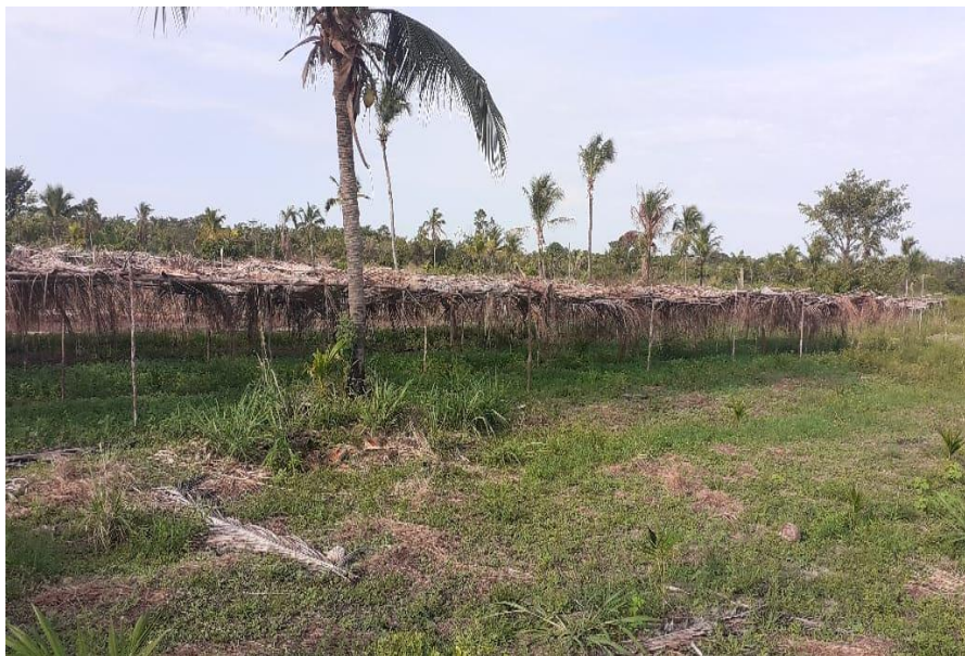
Figura 7 - Cobertura da leira feita com folhas secas de coqueiro.