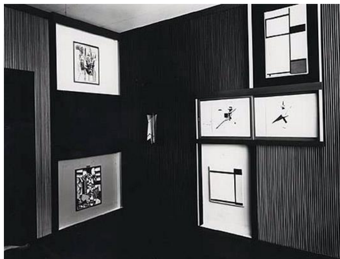
Figura 9 Abstrakte Kabinett de El Lissitzky 21

A integração do corpo e presença pelas obras propõe uma característica que convida, para além da arquitetura, a interatividade e a linguagem para a constituição das obras. Utilizo como exemplo a série de exposições de 1920 do artista construtivista El Lissitzky intitulada Abstrakte Kabinett . O artista criou uma dinâmica que se dirigia a disposição do espectador.