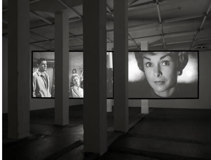
Figura 6 24 hours psycho , Douglas Gordon 16

Exposta pela primeira vez em 1993, essa instalação propunha o alargamento do filme mudando a taxa para dois quadros por segundos. O filme que inicialmente tinha cento e nove minutos de duração passa a ter vinte e quatro horas, exibindo e permitindo uma maior dedicação aos fotogramas.