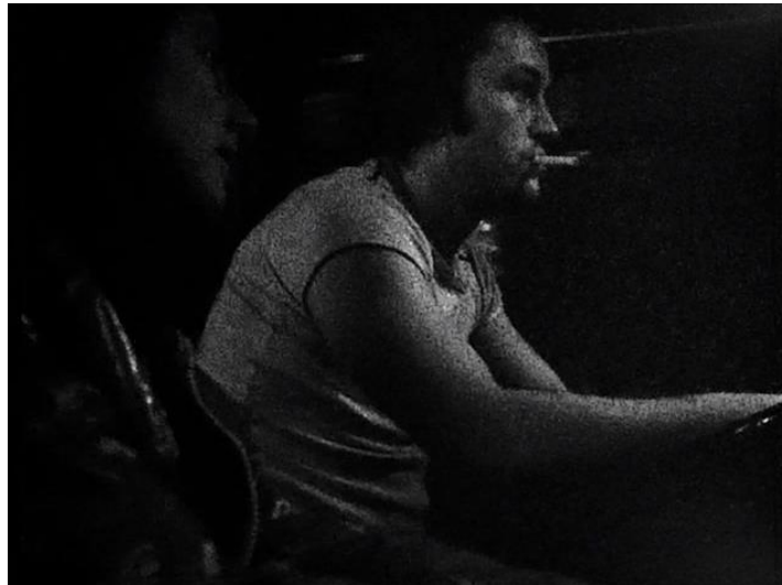
Figura 2 Monólogo do Caminhoneiro

Akerman subsume-se nesse segundo momento. O monólogo do caminhoneiro é um texto falocêntrico. A descrição do órgão masculino, a cena de masturbação que só entrega prazer ao homem, a concentração de todos os problemas dele nessa cena e até a forma como ele fala da sua filha de 11 anos que desperta prazer nele são peças que explicam essa presença subsumida da artista nesse segundo momento do filme. Mas também explicam como o corpo de Akerman ainda está oprimido. A imagem a seguir retrata essa construção da cena: