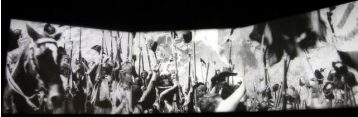
Figura 3 Napoleon projetado em três telas 11 .

colocadas lado a lado. Nessas três telas eram projetadas três imagens sincronizadas que, ora repetiam três vezes a mesma figura, ora formavam uma única figura extraordinariamente larga, e ora exibiam três figuras diferentes (MACHADO 2016 p, 68).