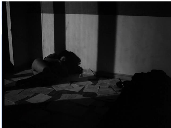
Figura 1 Chantal Akerman, Je tu il elle

Nesse primeiro momento, a disposição de Chantal/Julie merece uma análise fílmica. A fotografia do filme apresenta diversos pontos sub-expostos. Ela tem movimentos compulsórios e pesados, possui inibição com o corpo andando não apenas pelos espaços “escuros” da tela. Julie carrega um colchão como se fosse um peso. Seu corpo, na maioria das vezes, está curvado e no canto de algum espaço do quarto, como mostra a figura a seguir: