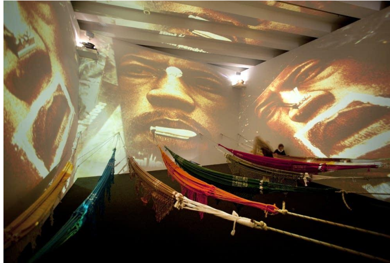
Figura 8 CC5 19 hendrix-war 20

enquanto os espectadores apreciam a imagem e música em redes suspensas. Segundo Oiticia, o rock é um estilo musical que tira o homem da terra. Talvez seja por isso que Maciel (2017) aponta o embalo da rede como uma ferramenta de amplificação do movimento entre as imagens.