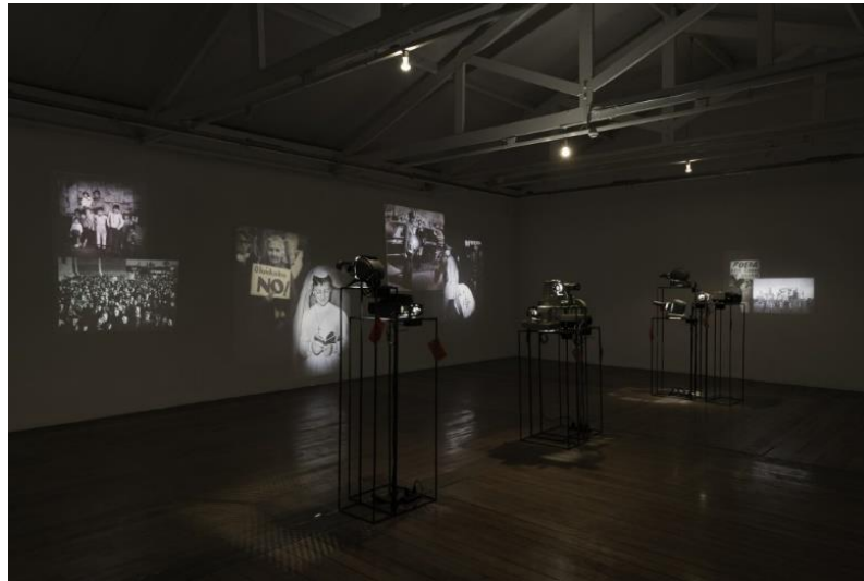
Figura 5 instalação Río-Montevideo , Rosângela Rennó 13

projeções de vídeos sobrepondo-se às fotos-telas. A instalação Río-Montevideo , por exemplo, é concebida dessa forma. As fotografias expostas por vinte projetores de slides de diferentes formatos, modelos e épocas recuperam imagens do Uruguai entre os anos 1960 e 1970. A proposta da artista era fazer pelos projetores uma alusão analógica à materialidade dos negativos encontrados, já que as fotografias tratavam-se de negativos escondidos no antigo prédio do jornal El popular .