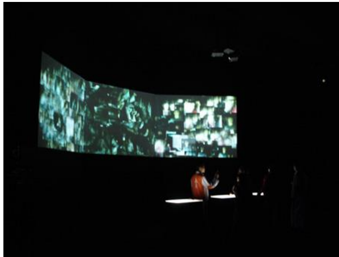
Figura 7 De vez em sempre, Giselle Beiguelman 17

A segunda característica é a interatividade que abre alas para a experiência pelo corpo. A obra-instalação da artista Giselle Beiguelman De vez em sempre conta com o auxílio de sistemas generativos que possibilitavam ao espectador somar com as imagens projetadas. A figura a seguir ilustra a dinâmica da exposição.