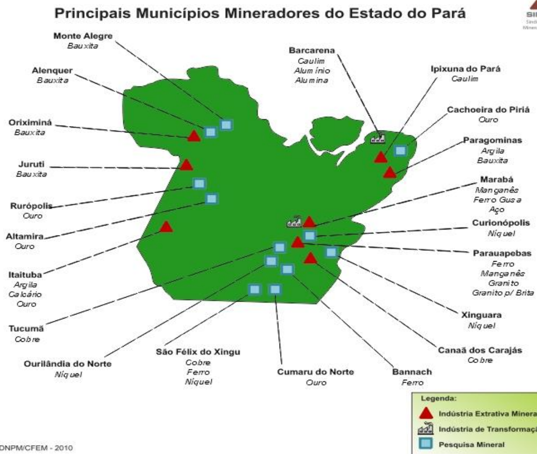
Imagem IV – DNMP (2010)

Conforme demonstrado nos mapas anteriores, no Brasil todo o panorama é de muitos projetos de mineração, e em especial no estado do Pará, que é o caso analisado, a exploração de minérios é diversa e presente no Estado inteiro.