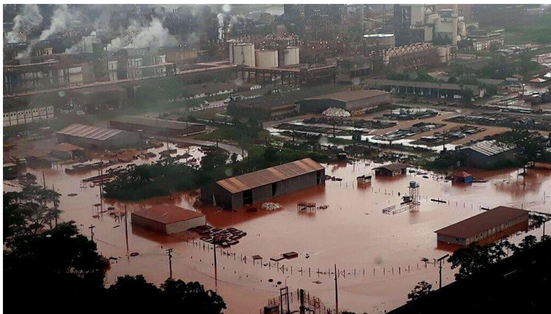
Imagem II – DOL (2019)

Além das violações de direitos causados pelo impacto ambiental gerado pela empresa mineradora, ainda é passível de crítica o modelo de desenvolvimento imposto à região, neste caso, cidade de Barcarena. A seguir imagem de parte da cidade em fevereiro de 2018: