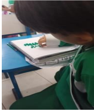
Figura 1 - criança realizando a atividade de colagem das bolinhas