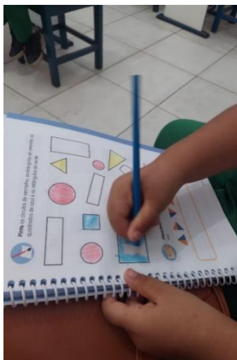
Figura 4: Atividade das formas geométricas