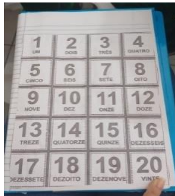
Figura 2 - sequência de números

os alunos deveriam pintar. Essa atividade não demorou como a anterior, mas como a professora estava ditando encontrou dificuldades, pois a turma não fazia o silêncio necessário para o momento do ditado dos números e assim a professora precisava ditar bem alto, e mesmo assim alguns alunos marcaram números errados. De acordo com a docente as duas atividades tinham o objetivo de trabalhar a quantidade e o nome dos numerais, pois ainda é uma dificuldade encontrada na turma.