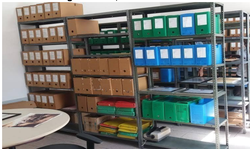
Imagem 1 – Arquivo Pessoal do IEC

Esse arquivo pessoal encontra-se na unidade da Avenida Almirante Barroso e, por falta de condições adequadas de conservação, teve seu acondicionamento improvisado, mas nada que danifique o estado físico do documento, pois há uma preocupação quanto a isso.