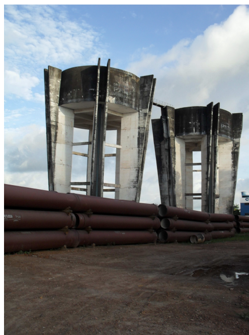
Fig 02 - Caixa d'água de Distribuição da Folha 29