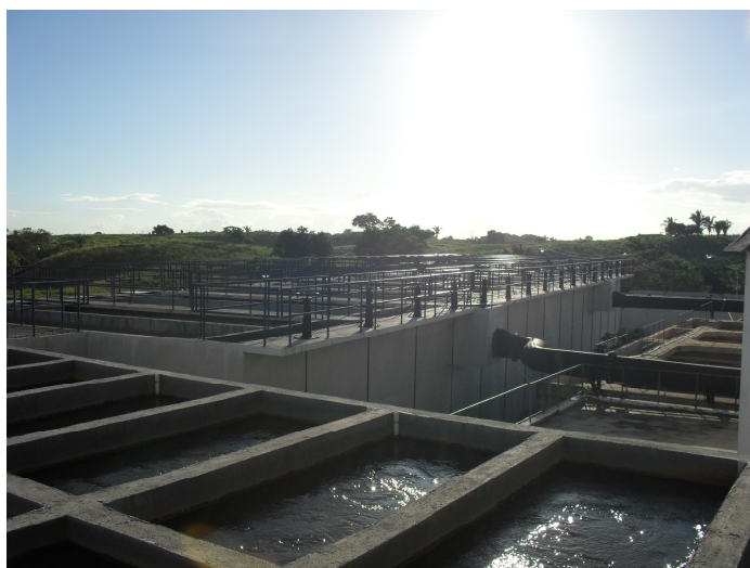
Fig 01 - Unidade de Decantação do Sistema de Abastecimento da COSANPA

A visitação a estação de captação da COSANPA nas margens d'ório Tocantins foi mais uma etapa do trabalho. Constatou-se visitas na antiga estação e na área que está sendo ampliada, com a construção de um novo decantador, filtro e a nova estação de tratamento. Além disso, visitou-se a estação de distribuição da folha 29. As áreas foram todas fotografadas.