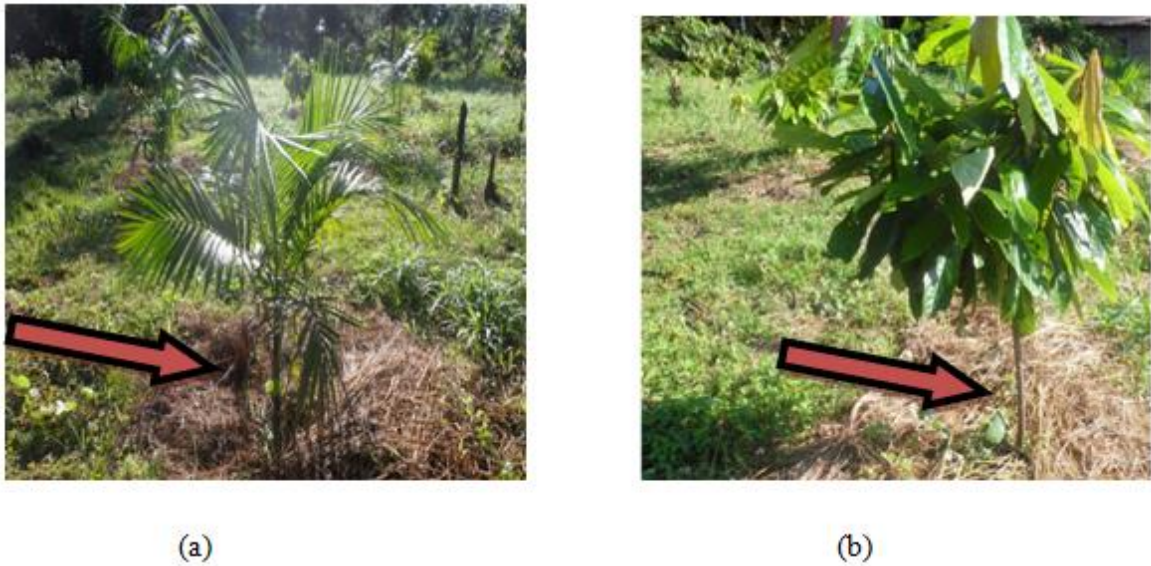
Figura 8: A técnica do coroamento. (a) Coroamento orgânico sob o “pé” do açazeiro, cujos microrganismos atuam no processo de decomposição para facilitar o crescimento da planta; (b) Coroamento orgânico sob o “pé” do cupuaçuzeiro.