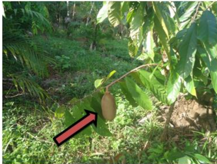
Figura 11: Árvore de cupuaçuzeiro, oriundas de sementes selecionadas com 2 anos de idade.