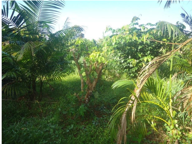
Figura 10: Conservação da área situada no Km 3 onde existem várias plantas nativas.