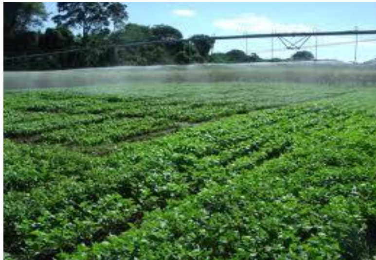
Figura 2: Plantio de transgênicos. Imagem mostrando uma lavoura de transgênicos.

Em 5 de janeiro de 1995, formou-se a constituição de técnicas de biossegurança (CTNBio), que tinha como objetivo prestar apoio técnico e de assessoramento ao Governo Federal no que diz respeito aos OGM, dentre outras atribuições. A partir desse momento passou a ser conhecido como o órgão que controlava a produção dos organismos transgênicos. Outros acontecimentos também marcaram a era da biotecnologia como o nascimento de duas ovelhas geneticamente modificadas com genes humanas. Em 1998, a União Européia concretizou a lei para a etiquetagem dos produtos geneticamente modificados, objetivando informar e garantir para os consumidores a origem do produto adquirido. O primeiro protocolo a valer foi o de Cartagena, em 1999, que tinha como objetivo a liberação dos transportes de produtos geneticamente modificados. No mesmo ano, no Brasil, foi constituída (ANBio) Associação nacional de Biossegurança, que dava ao país condições de comercializar os produtos transgênicos com segurança.