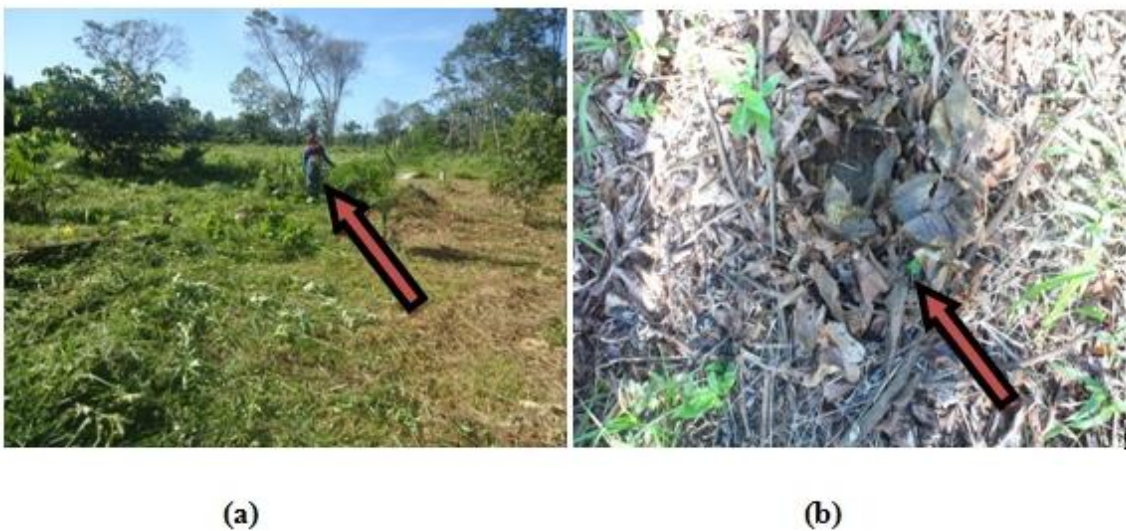
Figura 9: A área de plantação. (a) Roçamento da área onde há plantio das árvores do açazeiro e cupuaçuzeiro; (b) Após o roçamento, espalha-se os resíduos cortados para servir de adubos orgânicos para os novos plantios.