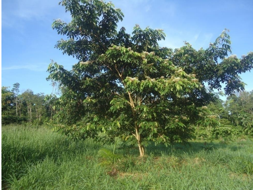
Figura 7:Ingazeiro. As leguminosas cujas raízes estão presentes as bactérias fixadoras de nitrogênio, que favorece o enriquecimento do solo. A decomposição de suas folhas transforma-se em adubos para o açaizeiro e cupuaçuzeiro.

Nesse plantio são utilizados somente adubos orgânicos que são encontrados no próprio local como: galhos, troncos e folhas de árvores que estão em processo de decomposição, pois os microrganismos, como as bactérias e fungos, transformam esses resíduos em nutriente favorecendo o desenvolvimento das espécies vegetais. Os resíduos são colocados no pé da planta formando um coroamento: técnica usada para que a raiz fique protegida das intempéries, ou seja, quaisquer condições climáticas adversas como vento forte, chuva torrencial etc. Na plantação de açaizeiro e cupuaçuzeiro, o solo apresenta-se bastante úmido devido à existência de camadas de compostos orgânicos que permanecem no local quando é feita a roçagem, ou seja, a limpeza da área.