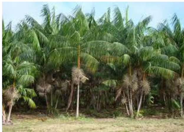
Figura 4: O açazeiro, uma árvore cujo fruto é muito consumida pelo povo paraense. Fonte: www.vivaterra.com.br

ocorrer em outros meses, porém em menor quantidade. A retirada dos cachos é realizada quando se observa que o fruto está maduro, ou seja, sua cor está bastante escura. Para isso, o extrativista faz a peconha, um tipo de argola fabricada com a própria folha do açazeiro, utilizando uma técnica indígena/cabocla, o extrativista coloca a peconha nos pés e sobe no caule até alcançar a copa da árvore, onde se encontram os cachos, que são retirados e armazenados em recipientes também de origem indígenas conhecidos como paneiro. A polpa do açá é utilizada de várias maneiras na culinária, sucos, sorvetes, cremes e outros. Também é bastante utilizada na fabricação de cosméticos.