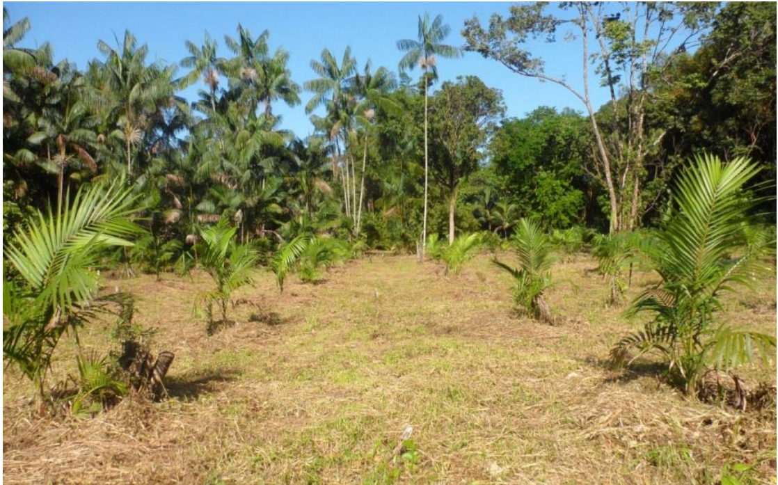
Figura 6: Plantio de açazeiro na região do Km 3 no município de Abaetetuba. Notar o distanciamento entre os espécimes.

espécimes, que obedece a uma ordem de plantação (1 linha de cupuaçuzeiro e 2 de açazeiro), distância de 5 metros entre as mudas.