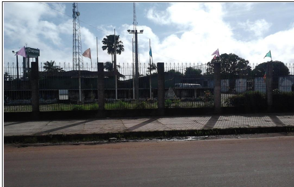
Imagem 1- Frente da APAE

Na imagem 1 é possível visualizarmos o prédio em sua construção recente, estrutura em alvenaria e bastante ampla.