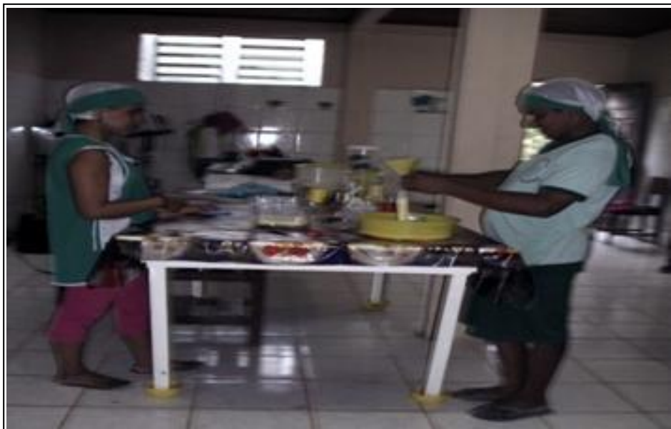
Imagem 2– Alunos nas atividades profissionalizantes

Na cozinha os alimentos produzidos para a lanchonete têm ajuda de alguns alunos como forma de profissionalização dos mesmos, assim como as aulas de artesanato, entre outros serviços realizados por eles, como maneira de prepará-los para o mundo profissional. As imagens 2 e 3 mostram as aulas profissionalizantes.