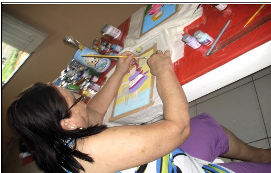
Imagem 3 – Alunos nas atividades profissionalizantes.