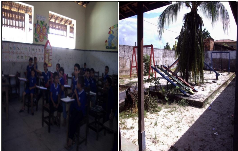
Imagens 10 e11 – A turma regular e a área de recreação.

P3 trabalhou os conteúdos em sala de aula utilizando algumas atividades lúdicas como: recorte e colagem, confecção de cartazes, cartelas silábicas e numéricas. As atividades extraclases foram feitas no parque que a escola possui. As imagens 10 e 11 representam a turma regular do aluno Síndrome de Down e a área de recreação.