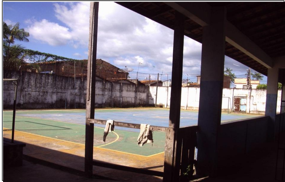
Imagem 5- Quadra da Escola Dr. Vicente Maués.

Mas, infelizmente não dispõe de recursos materiais suficientes como uma brinquedoteca. Assim como materiais didáticos que o professor precisa construir ou comprar.