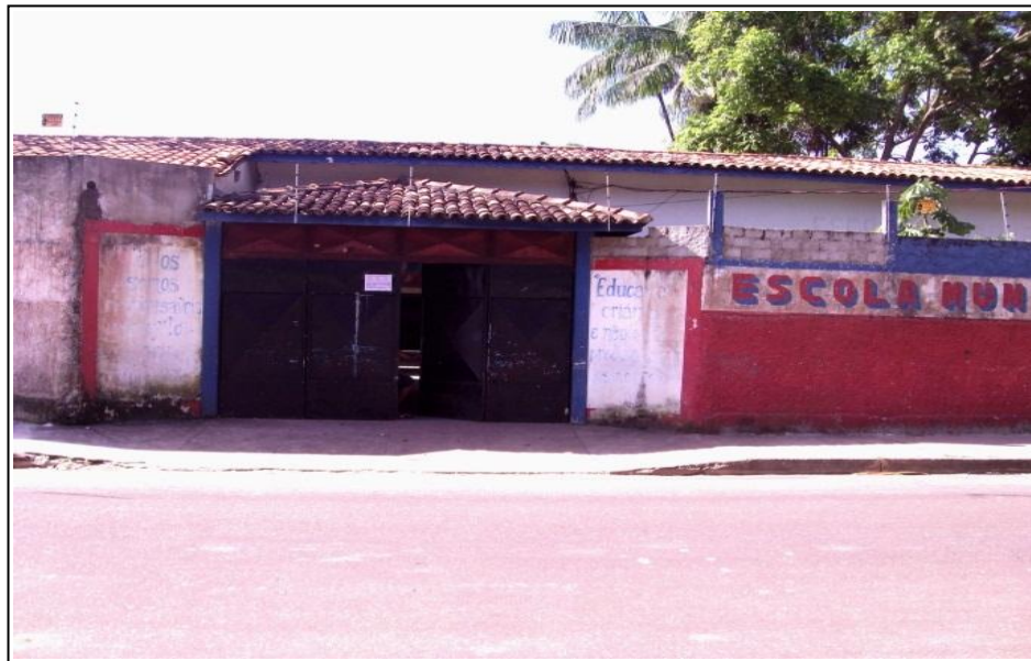
A imagem 4- mostra a frente da Escola Dr. Vicente Maués.

A instituição foi fundada no dia 22 de abril de 1969. Construída com fins educacionais, sendo seu nome uma homenagem ao primeiro engenheiro filho de Abaetetuba. A figura 4 mostra a frente da Escola Dr. Vicente Maués.