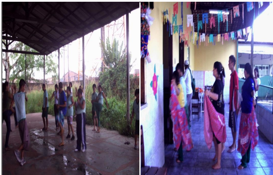
Imagens 9 e 10- Atividades extraclasse.

P2 trabalhava com alunos incluídos, sua principal atividade em sala de aula era dar reforço dos conteúdos trazidos da escola regular. A ludicidade era trabalhada somente em atividades extraclasse, como as atividades de dança e momentos de aeróbicas. As imagens 8 e 9 mostram as atividades de danças, folclóricas e aeróbicas.