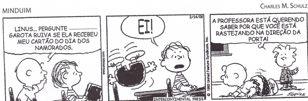
Figura 15- exemplo de crase no pronome demonstrativo: (3ª edição. P 175)