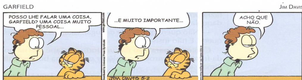
Figura 8- exemplo de colocação pronominal. ( 1ª edição. P 118; 3ª edição. P 95) Leia a tira:

Vale lembrar que estas atividades são encontradas somente no livro didático da terceira edição, porém na primeira edição o mesmo assunto aparece, mas com atividades relacionadas a textos que não contêm tiras, somente frases.