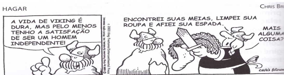
Figura 4- Exemplo de Orações Coordenadas.(1ª edição. P 74; 3ª edição. P 50)

essa oração completa o período da forma verbal sabia da oração principal, pois está substituindo um substantivo, essas orações que dependem entre si, é chamado oração subordinada e por está substituindo um substantivo nesse caso exerceria a função de objeto direto, também o aluno pode perceber que o que constitui o humor da tira está no fato de o camelo está pedindo uma informação fora de seu habitat, junto do pinguim e do urso em uma região gelada. Na tira encontra-se a relação das orações.