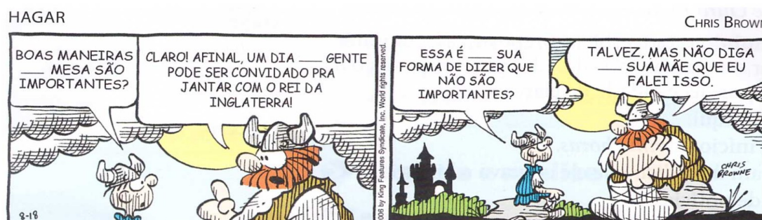
Figura 17- exemplo de crase (II):