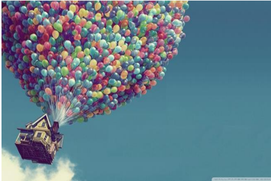
Imagem 3. Filme Up! Altas aventuras (2009).

do belo, do corpo/rosto que é bonito, atraente e daquele corpo/rosto que é feio, e que não é aceito no ciclo social, nesse caso, o gordo, o baixo ou exageradamente magro. E hoje, com bilhões de possibilidades, os filmes aguçam o imaginário infantil como podemos notar na imagem abaixo: