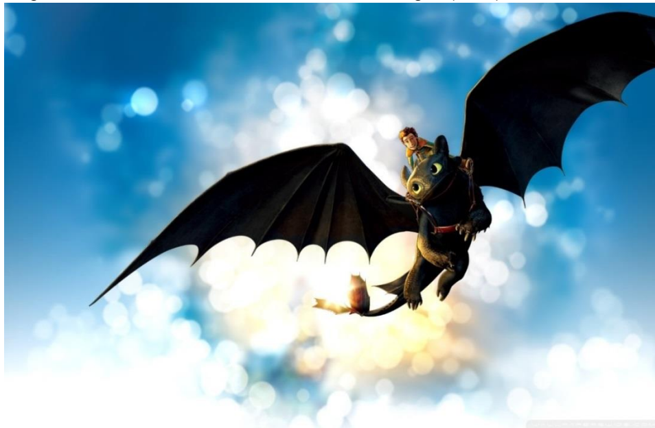
Imagem 4. Cenas do filme Como Treinar o seu Dragão (2010)

Nessa situação a criança passa a reescrever a história com outros olhos, que fazem seus saberes tomar posições de lado. Um mundo interiorizado de normas e condutas adultas trazendo novos aprendizados. Observar essas articulações impostas por centenas de narrativas sobre a estrutura de imagens, a criança torna-se influenciada por essas imagens no mundo secular. Já que em contato com os artefatos culturais a criança descobre culturas de outros tempos. Um bom exemplo disso é o filme a seguir que relata as experiências de povos antigos e práticas vividas em outra época com outras culturas.