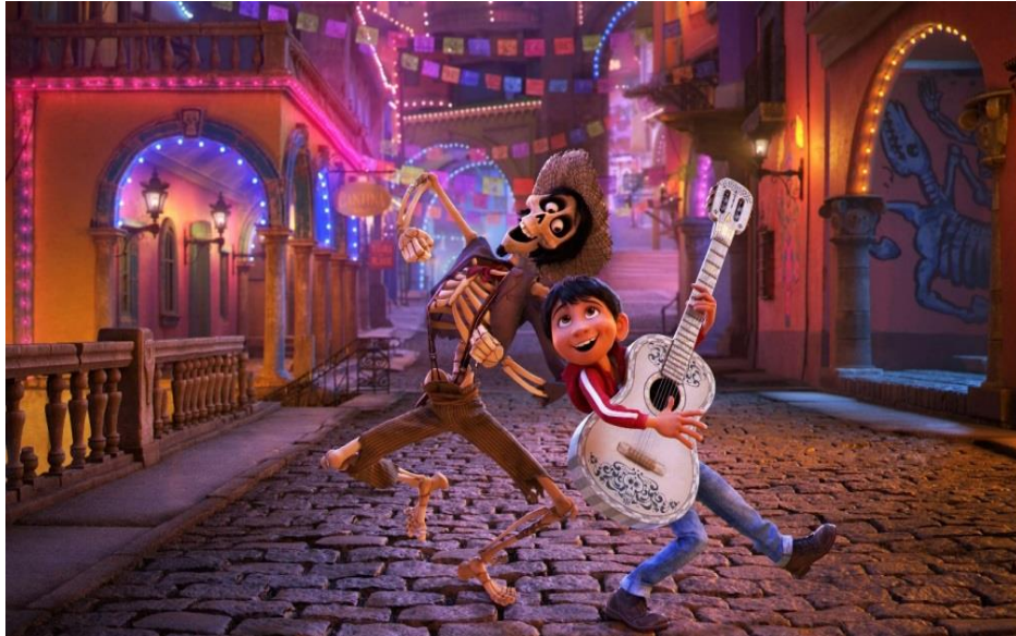
Imagem2: Cena do filme Viva - A Vida é Uma Festa (2018)

desejos sobre a forma de imagens. A imagem a seguir, mostra como estão hoje as superproduções de filmes criados e elaborados especificamente para as crianças: