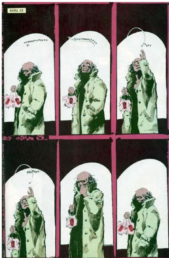
GAIMAN, Neil. "Esperando o fim do mundo". Reprodução DC Comics, p. 25, 1991