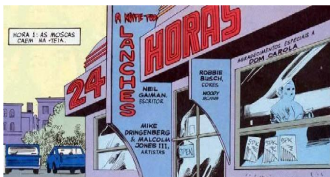
FIGURA 5 – AZUL, A COR DE CALMARIA

GAIMAN, Neil. "Esperando o fim do mundo". Reprodução DC Comics, p. 1, 1991.