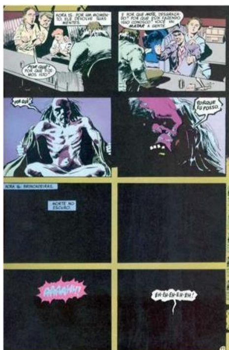
GAIMAN, Neil. "Esperando o fim do mundo". Reprodução DC Comics, p. 18, 1991.