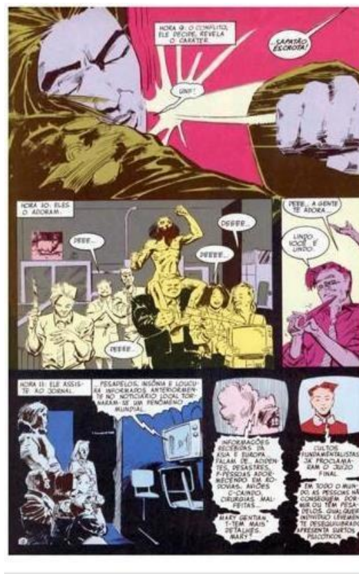
FIGURA 15 – ELES O ADORAM

GAIMAN, Neil. "Esperando o fim do mundo". Reprodução DC Comics, p. 14, 1991.