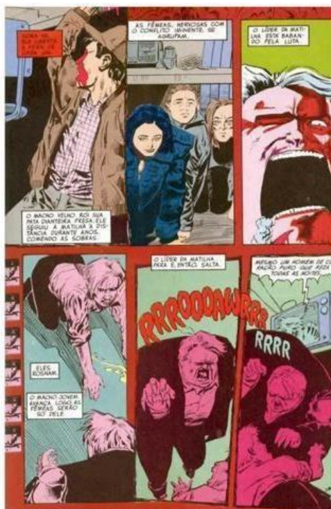
FIGURA 20– AS FERAS NASCEM

GAIMAN, Neil. "Esperando o fim do mundo". Reprodução DC Comics, p. 21, 1991