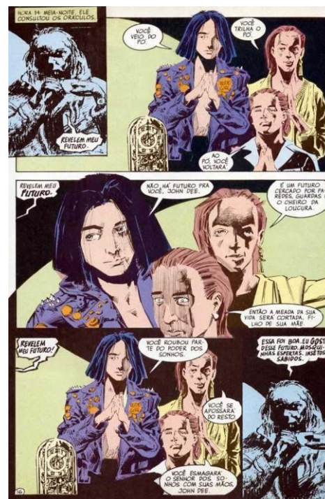
GAIMAN, Neil. "Esperando o fim do mundo". p. 19, 1991.

O sadismo é um elemento presente em diversos movimentos de terror, tanto antigos quanto modernos. A criatura sempre busca sua própria satisfação, baseando-se na crença de que qualquer trauma é causado por fatores externos que interferem na dissociação social. No contexto isolado dos quadrinhos, não buscamos compreender o ponto de vista da criatura, mas sim analisar sua relação com os conceitos surrealistas e de terror. No entanto, a figura 18 apresenta de forma clara sua motivação, revelando seu poder de fazer tudo no mundo onírico e peculiar que ele habita. Isso é uma evidência clara de que "John De" personifica o surrealismo pregado por Breton (1924). Na figura 10, ele busca respostas sobre o futuro e essas respostas revelam que ele é o próprio sonho, em que o aspecto humano assume o controle com todo o seu ego e mortalidade. É comum para os vilões, como pontua Noel Carroll: "Se o monstro for considerado apenas potencialmente ameaçador, a emoção seria o medo; se apenas potencialmente impuro, a emoção seria a repugnância. O horror artístico exige uma avaliação tanto do aspecto ameaçador quanto do aspecto repugnante" (CARROLL, 1999, p.45).