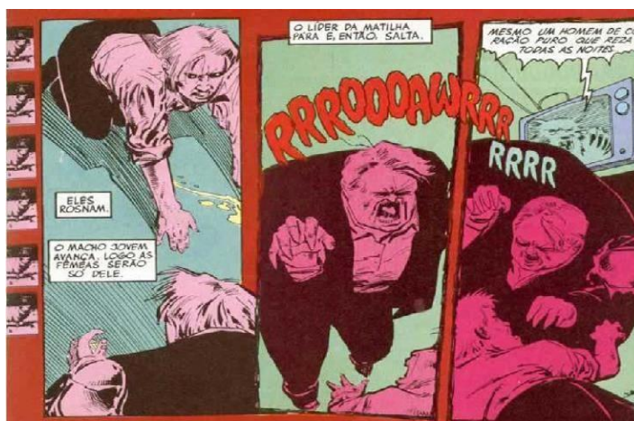
FIGURA 6 – VERMELHO, A COR DA RAIVA

GAIMAN, Neil. "Esperando o fim do mundo". Reprodução DC Comics, p. 21, 1991.