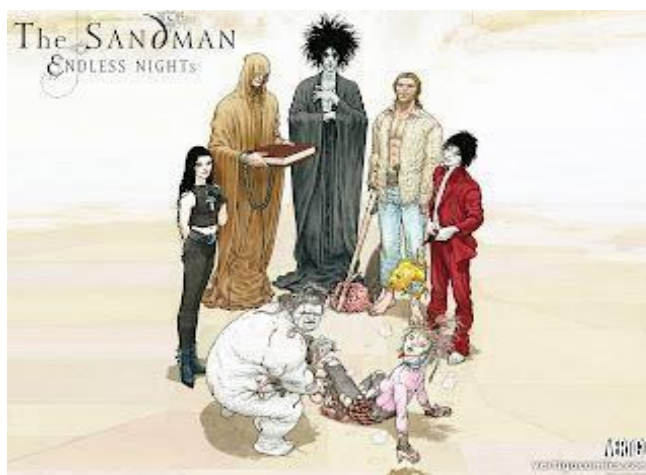
FIGURA 4- OS PERPÉTUOS