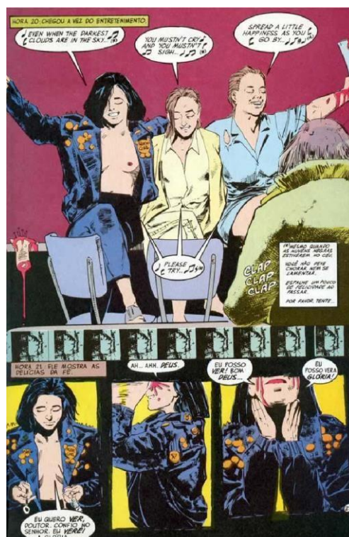
FIGURA 22 – O PROFANO

GAIMAN, Neil. "Esperando o fim do mundo". Reprodução DC Comics, p. 23, 1991.