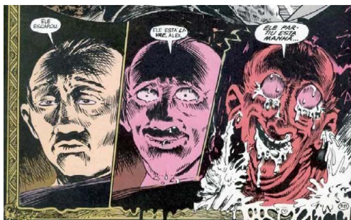
FIGURA 7 – DISTORCENDO A REALIDADE

GAIMAN, Neil. "Prelúdios e noturnos". Reprodução DC Comics, p. 39, 1991.