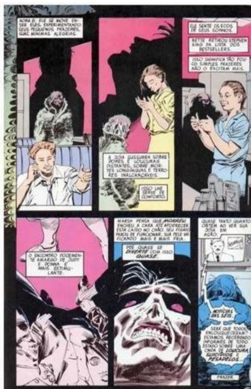
GAIMAN, Neil. "Esperando o fim do mundo". Reprodução DC Comics, p. 13, 1991.

Após explorar e compreender os desejos reprimidos, surge um aspecto pouco abordado no horror clássico: o prazer que a criatura encontra em causar sofrimento. Diferente do conceito dualístico cristão, em que o bem é sempre bom e o mal é irremediável, em Sandman há nuances de "cinza", personagens que se adaptam às circunstâncias apresentadas. Em "Esperando o Fim do Mundo", o fator externo intensifica o desejo futuro de "John De" ao justificar seus atos. Essa ambiguidade leva o personagem a se colocar como "Deus do Sonhar", buscando prazer nessa posição. Tendo vista que: