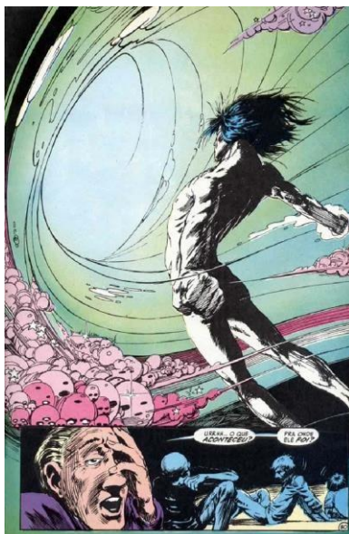
FIGURA 3 – A SAÍDA DE MORPHEUS DO EXÍLIO

GAIMAN, Neil. "Sono dos justos". Reprodução DC Comics, p. 31, 1991.