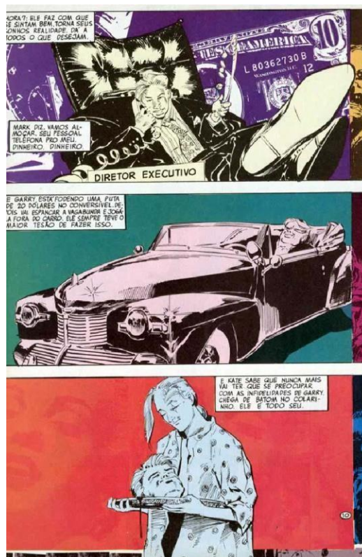
FIGURA 13 – DESEJOS

GAIMAN, Neil. "Esperando o fim do mundo". Reprodução DC Comics, p. 12, 1991.