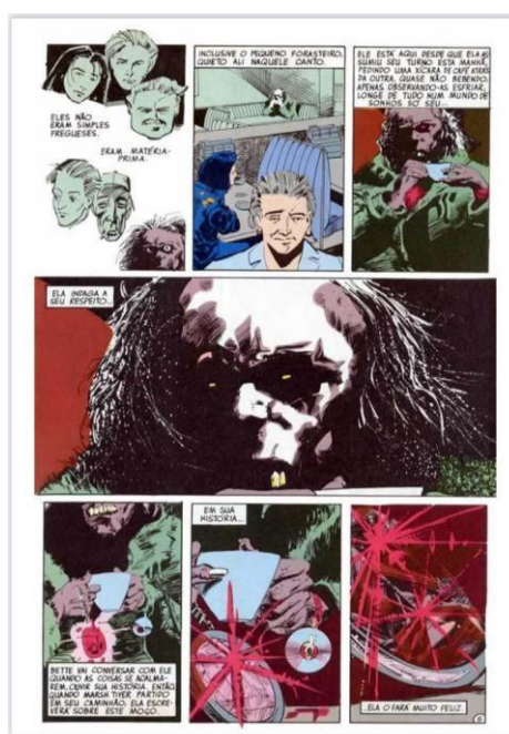
GAIMAN, Neil. "Esperando o fim do mundo". Reprodução DC Comics, p. 7, 1991.

A partir desse momento o traço oitentista muda drasticamente, com a adição de sombra em todos os quadros e com uma perspectiva muito pessoal do vilão como retratada na figura 2 no quadro 3, o cartoon é deixado de lado, abrindo caminho para o “terror surrealista”, que seria cores arrojadas que tomam a tela combinadas com as ações dos personagens, causando um peso para todas as atitudes que serão tomadas pelos personagens. Já McCloud (1995) divaga sobre colocar emoções em símbolos, e como qualquer simbologia pode ser tomada como um sentimento, pois bem, a segunda metade traz simbologias agressivas de um terror psicológico, comumente observadas em horrores clássicos como “psicose” onde as cenas são filmadas de perto dando claustrofobia no espectador ou em “O iluminado” que pode ser encaixado em “terror surrealista” escalando cada vez mais dentro da psique do ser humano no caso os personagens os levando a uma