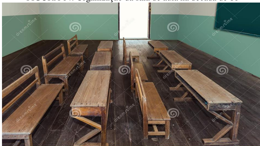
FIGURA 04: Organização da sala de aula na década de 80