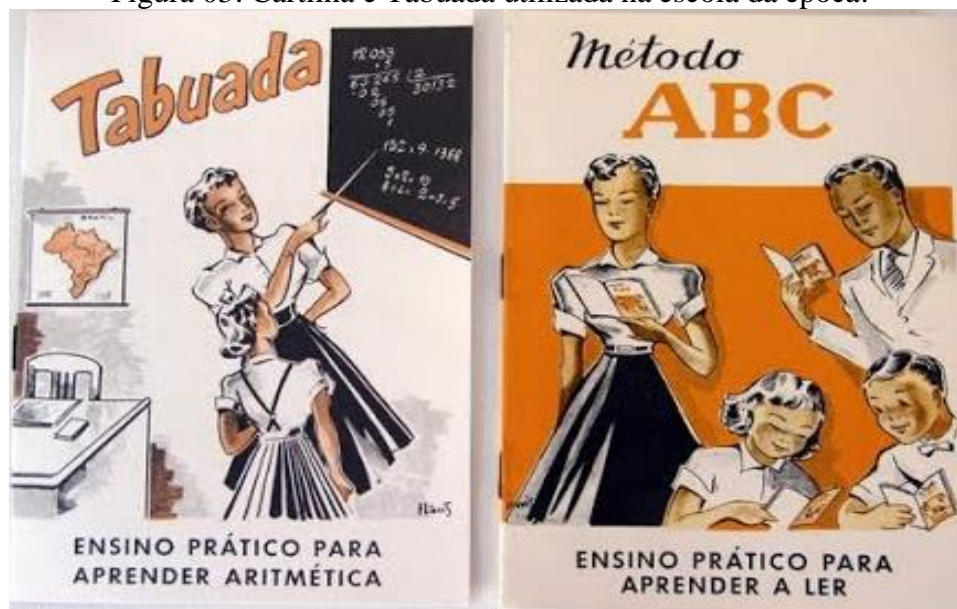
Figura 03: Cartilha e Tabuada utilizada na escola da época.