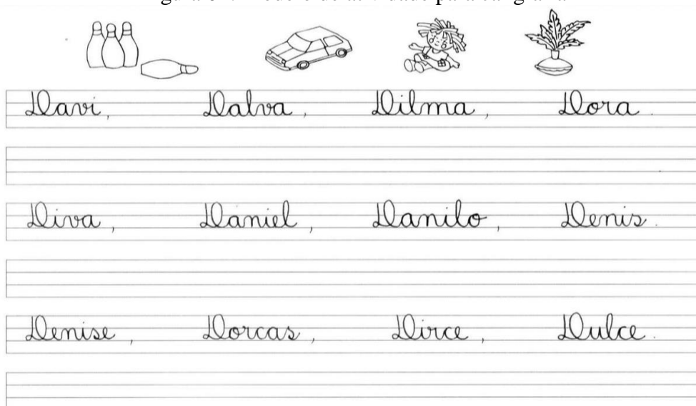
Figura 02: Modelo de atividade para caligrafia