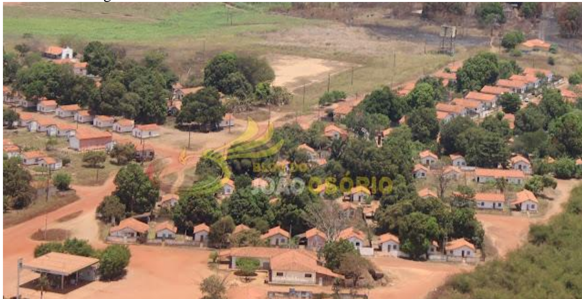
Figura 01: Visão aérea de Vila Pimenteiras / Coelho Neto – MA.

Passei toda a minha infância numa modesta e agradável casa de seis cômodos (sala, cozinha, banheiro e 3 quartos), na localidade chamada Pimenteiras, uma pequena vila operária onde moramos até o ano de 1986. (ver figura 01)