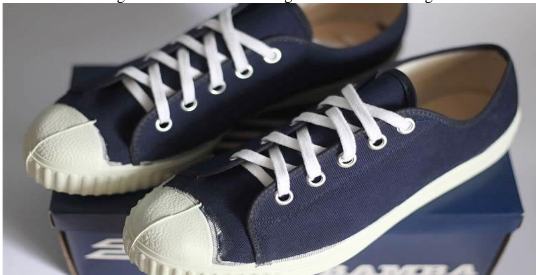
Figura 07: Tênis escolar exigido aos alunos - Conga