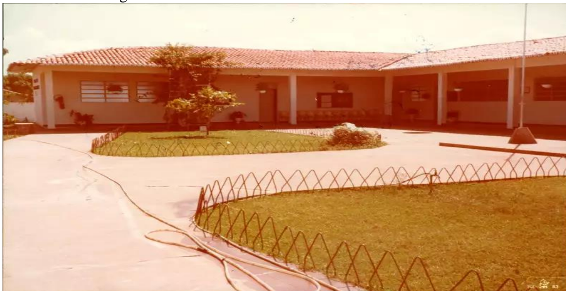
Figura 05: Vista frontal da E. M. R. S. em Coelho Neto - MA.