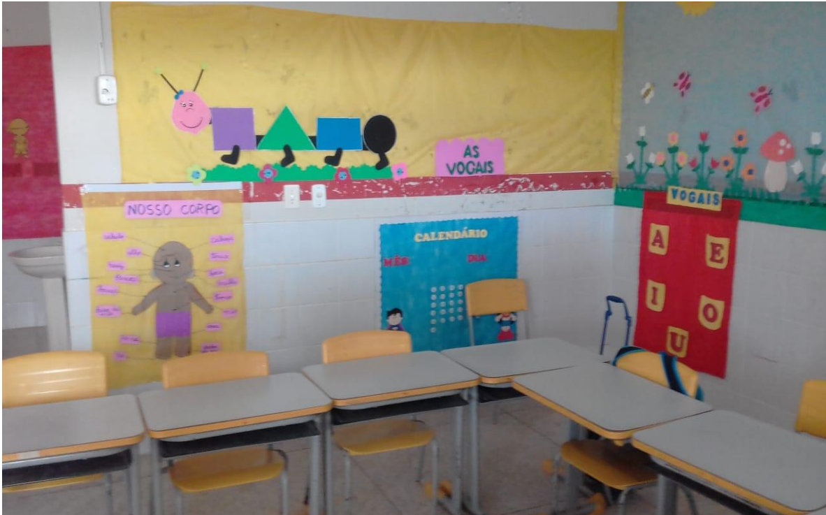
FIGURA 15: Organização do espaço do pré II.