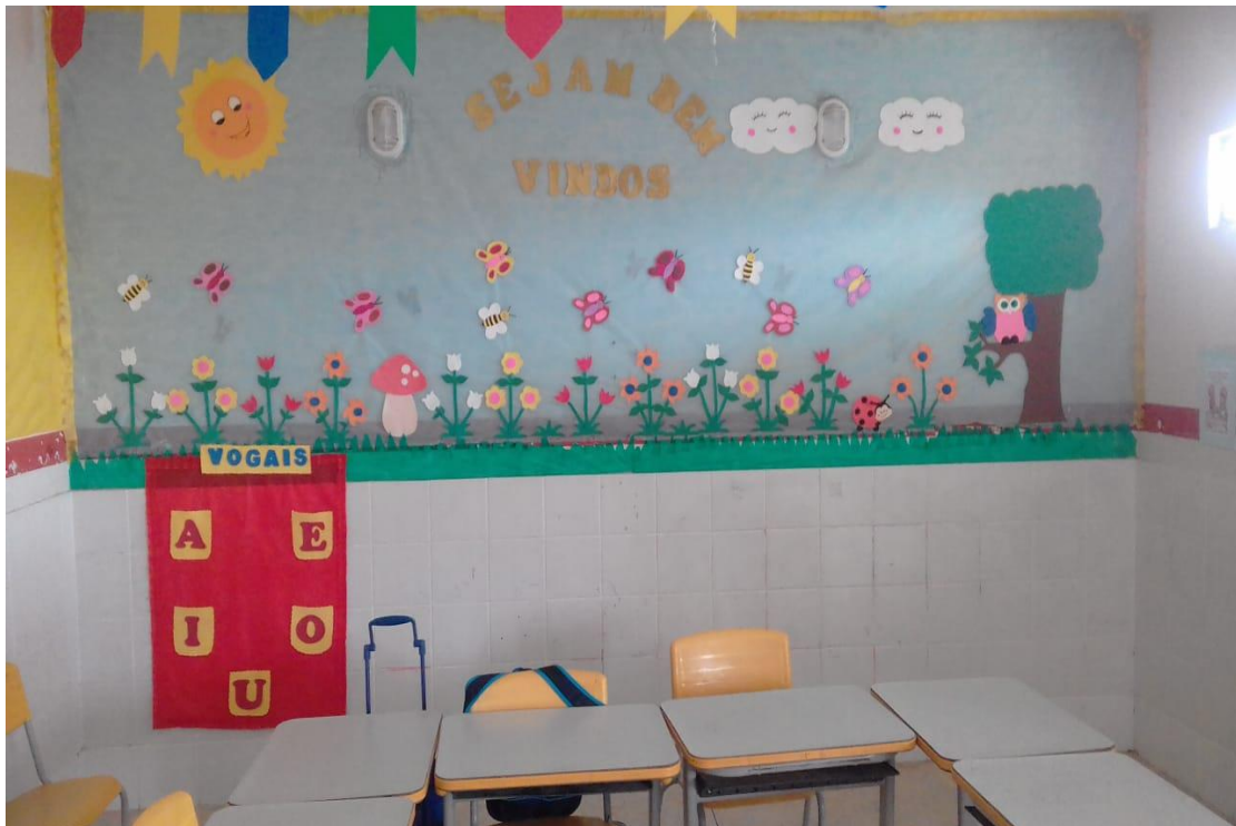
FIGURA 17: Organização das cadeiras do pré II.