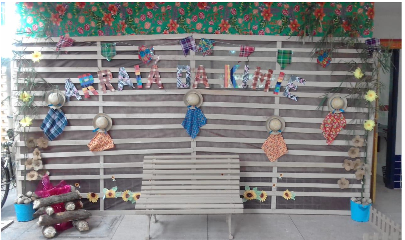
FIGURA 20: Ornamentação do pátio da escola.