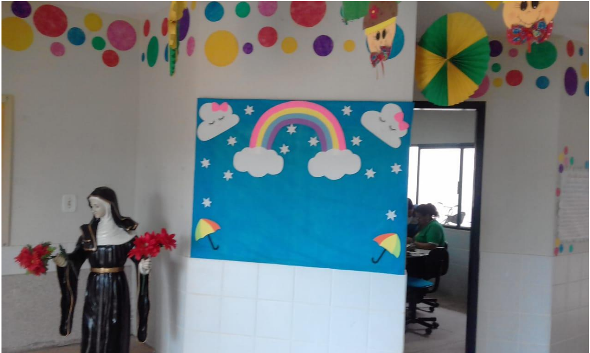
FIGURA 19: Ornamentação da entrada da sala dos professores.