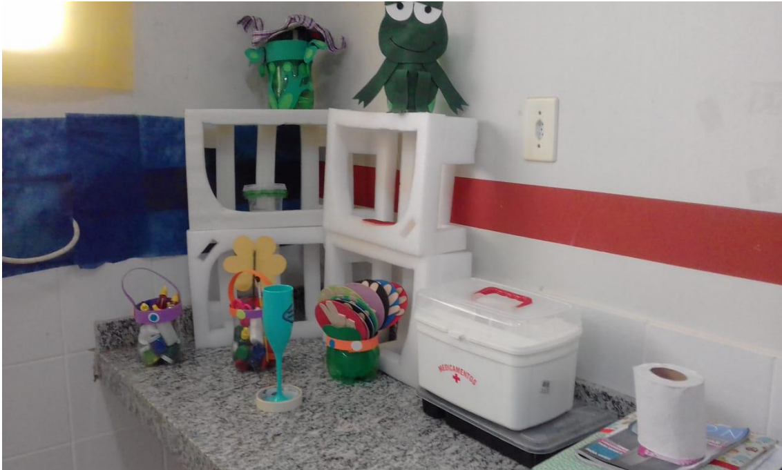
FIGURA 13: Espaço da experiência. Créditos: Edilena Santos.