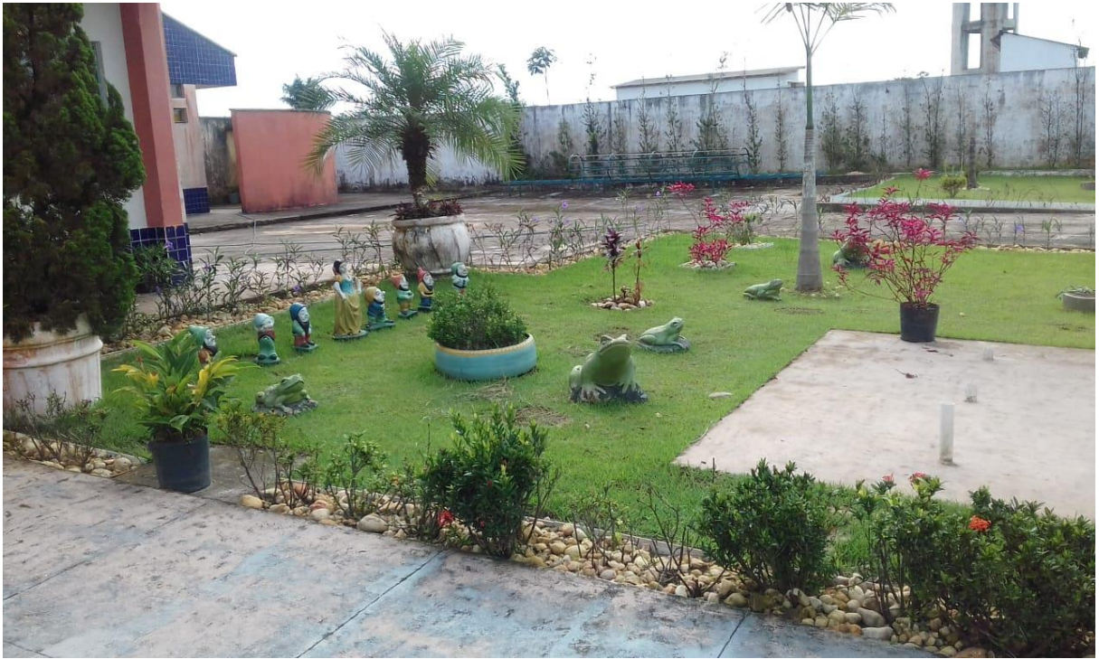
FIGURA 03: Pátio interno da Unidade Municipal de Educação Infantil Kimie Ohaze.