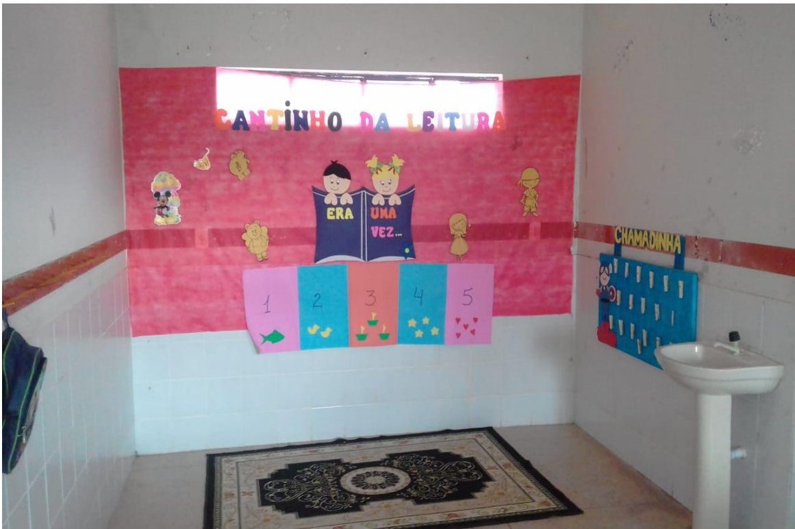
FIGURA 07: Espaço da leitura.