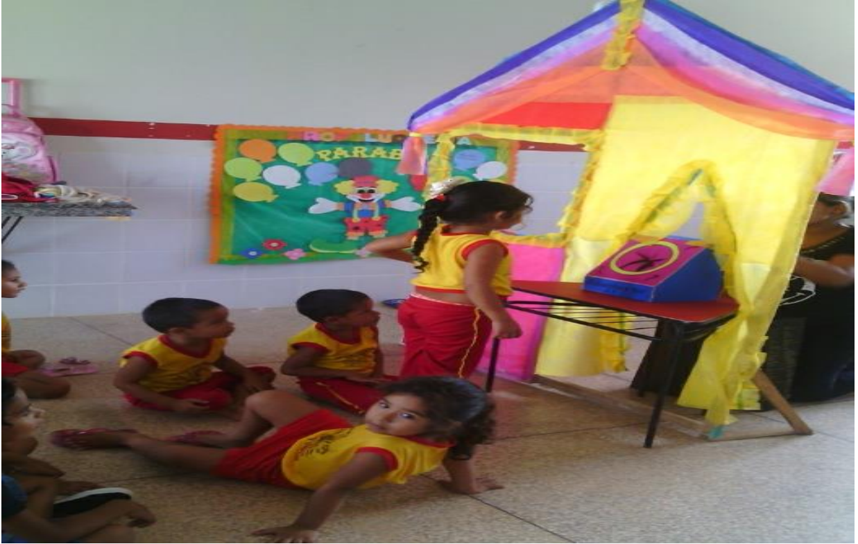
FIGURA 21: Casa da curiosidade do pré I. Créditos: Edilena Santos.