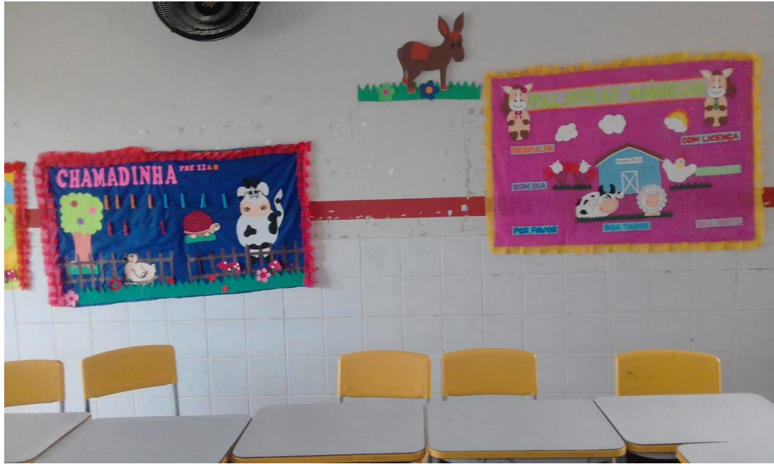
FIGURA 09: Espaço da chamada.