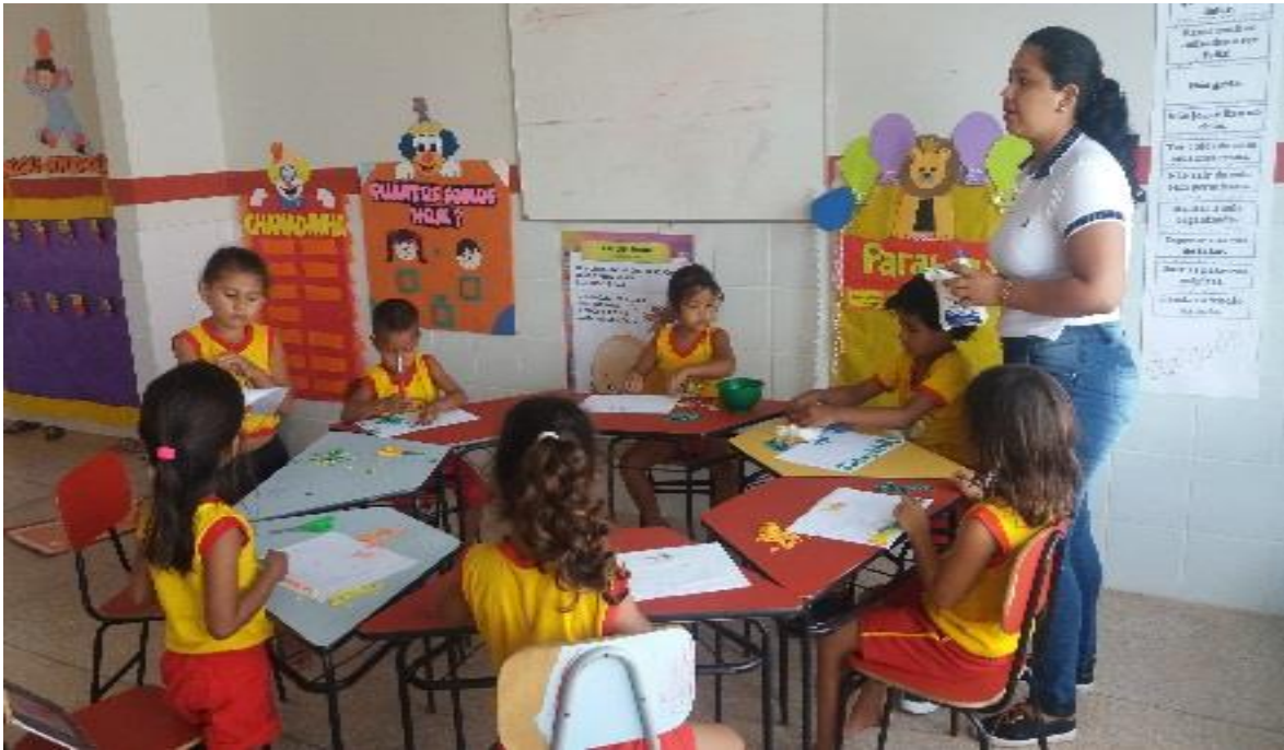
FIGURA 23: Organização das mesas e cadeiras em círculo.