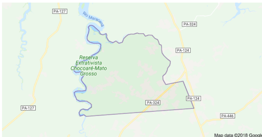
FIGURA 01: Mapa de localização do Município de Santarém Novo – PA.

A cidade de Santarém Novo- PA, do interior da capital paraense, está localizada a aproximadamente 166 km da capital de Belém. O município possuía no último levantamento do Instituto Brasileiro de Geografia Estatística (IBGE), realizado em 2010, 6.141 habitantes e com estimativa para 6.482 em 2016 segundo o levantamento de 2012, conforme pode ser observado na figura 01 abaixo.