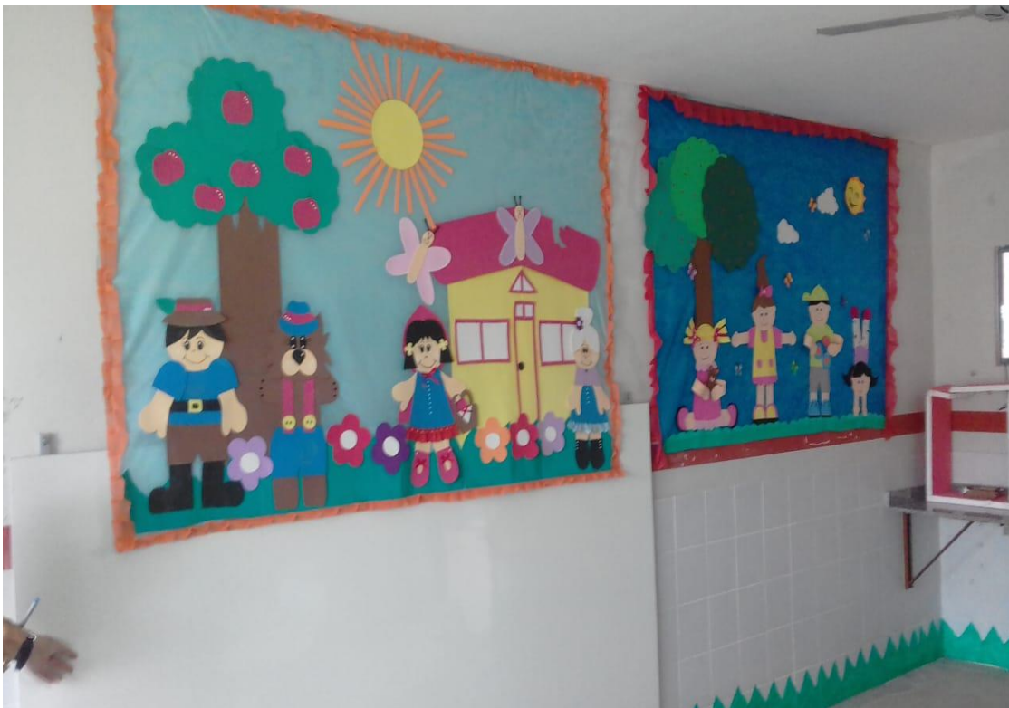
FIGURA 12: Espaço do conto.