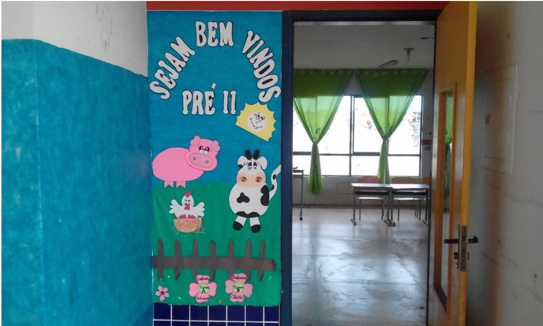
FIGURA 11: Entrada da sala do pré II.