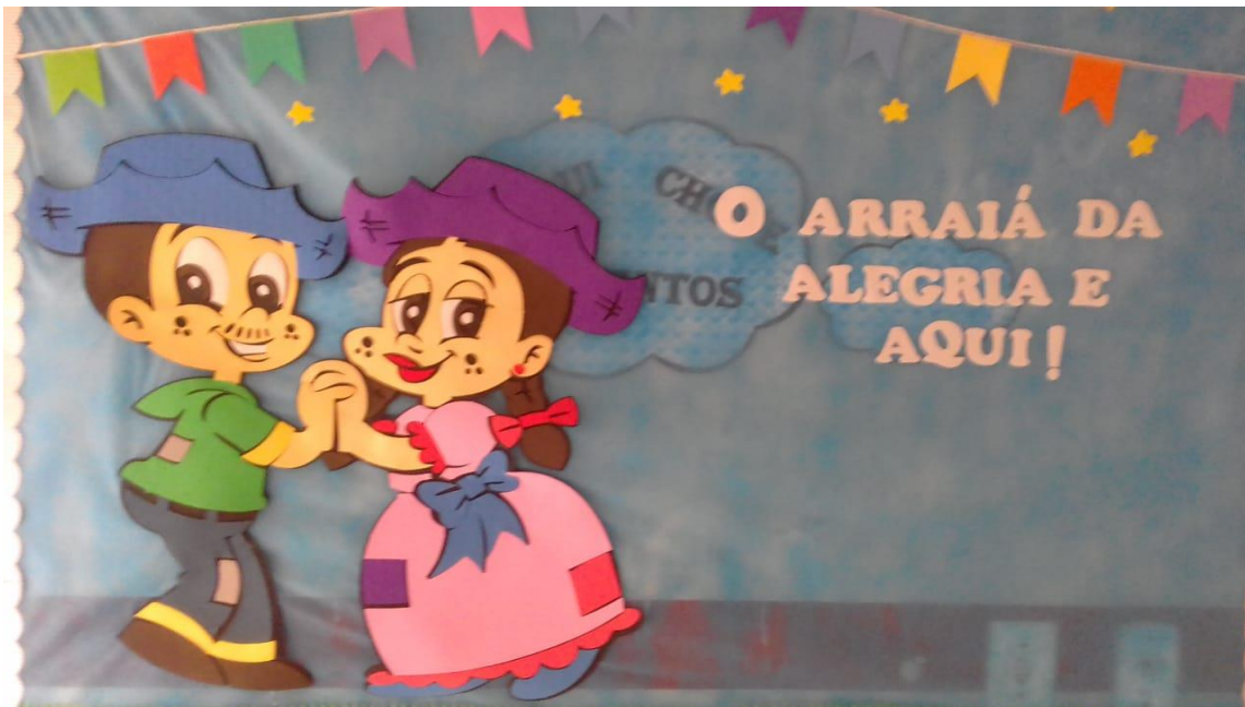
FIGURA 14: Painel do projeto da semana.