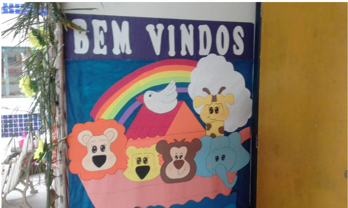
FIGURA 10: Entrada da sala de aula do pré I com tema do projeto da semana.