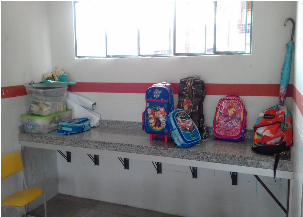
FIGURA 05: Espaço para os materiais didáticos dos alunos e professora do pré I. Créditos: Edilena Santos.