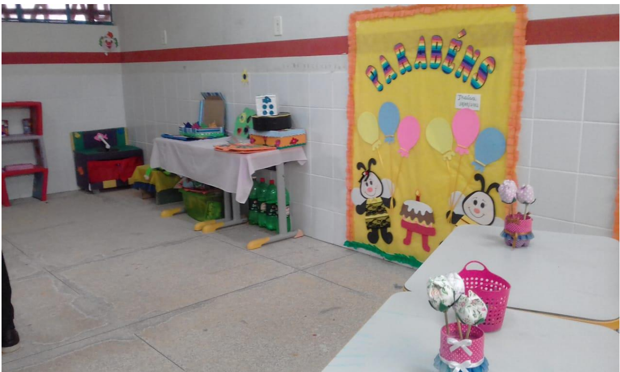
FIGURA 16: Espaços do faz de conta e da matemática. Créditos: Edilena Santos.