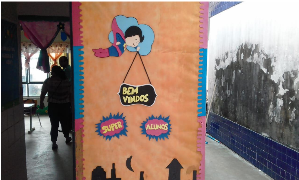
FIGURA 08: Entrada da sala de aula do pré II.