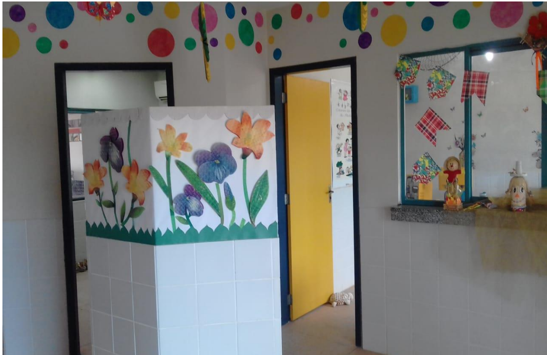
FIGURA 18: Hall de entrada da creche Kimie Ohaze.