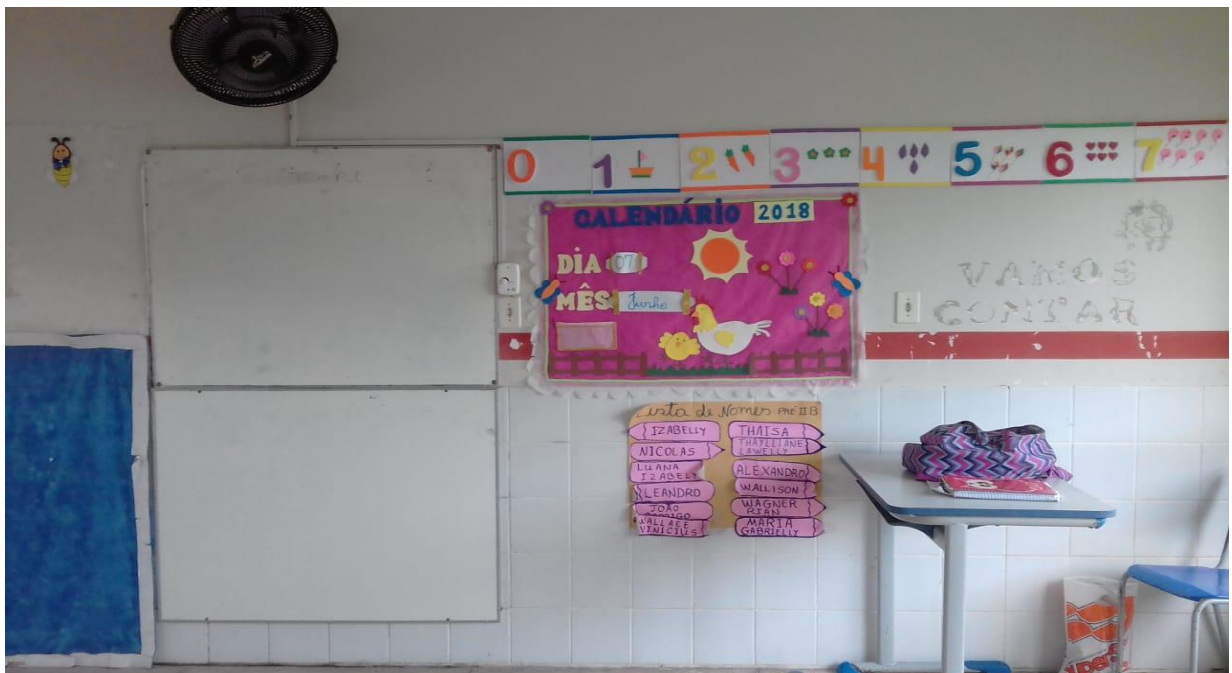
FIGURA 04: Sala de aula do pré I.