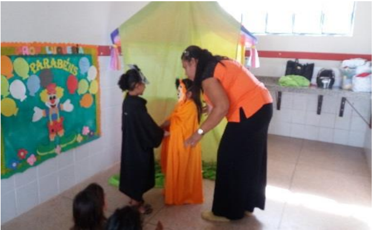
FIGURA 22: Espaço do faz de conta.