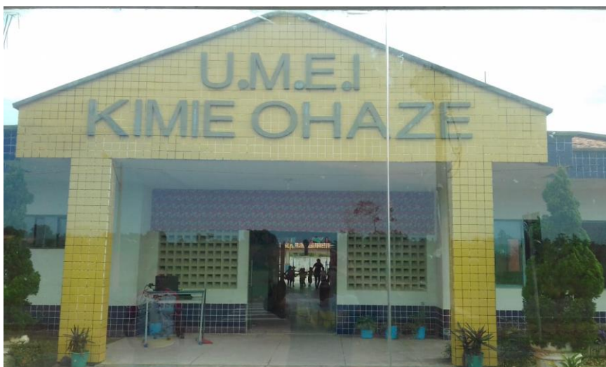
FIGURA 02: Frente da Unidade Municipal de Educação Infantil KimieOhaze.

A Unidade Municipal de Educação Infantil Kimie Ohaze foi fundada em 2014 com o intuito de atender crianças do berçário ao pré II. Inicialmente a creche atendia somente o pré I e II, sendo que nos anos seguintes acolheu o público previsto, hoje seu público alvo é de alunos da creche III, crianças de 2 anos até as crianças do pré II, com a idade de 4 anos, conforme pode ser observado na figura 02.