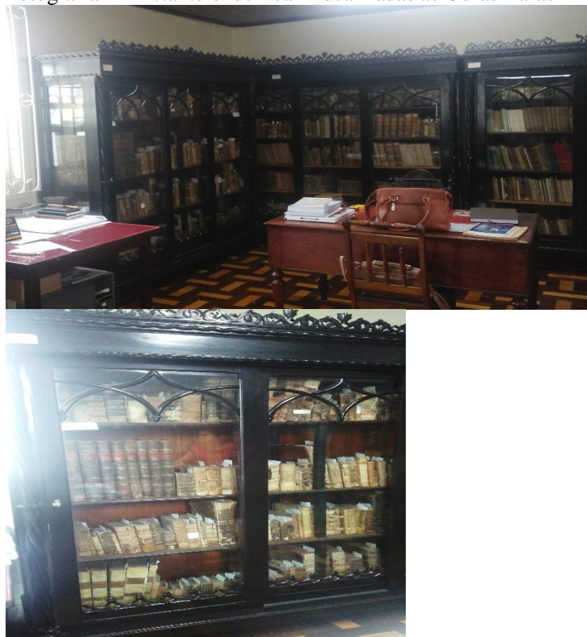
Fotografia 4 – Estante onde ficam localizadas as Obras Raras

A Fran Paxeco conta com um acervo de livros antigos (Fotografia 4) em sua maioria literatura porém não todos raros estes ficam nas estantes para serem consultadas sem restrições, os livros raros ficam em estantes de vidro separadas na sala da bibliotecária devido a refrigeração, “Pesquisas e experiências indicam que quando mais baixa for a temperatura maior será a permanência e durabilidade do papel” (LUCCAS; SERIPIERRI, 1995, p. 20).