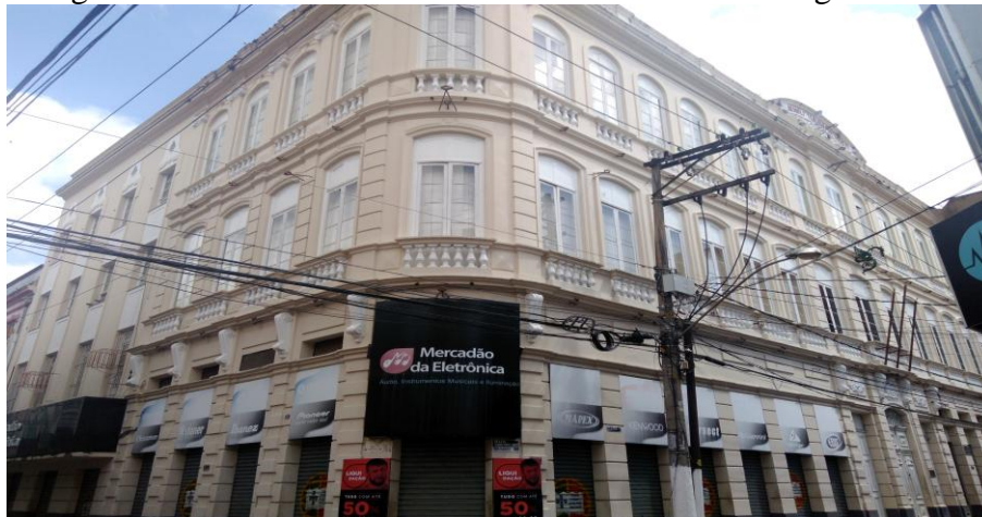
Fotografia 1 – Fachada da sede do Grêmio Literário Português