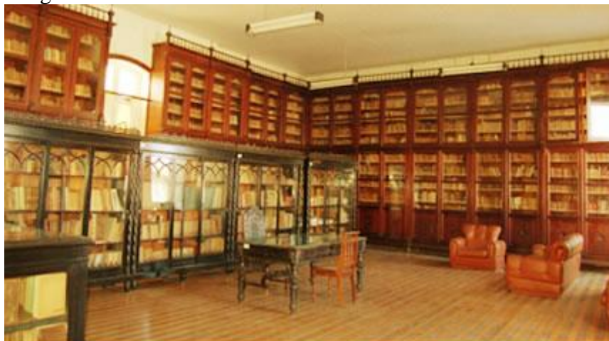
Imagem 2 -Biblioteca Fran Paxeco

O Conteúdo do acervo (Imagem 2) é diversificado “São aproximadamente 35 mil itens entre periódicos, livros e manuscritos. É possível encontrar várias edições da Bíblia, um livro de Maquiavel e a coleção mais completa do mundo das obras de Camilo Castelo Branco, que inclui a primeira edição do clássico Amor de Perdição”, “Os manuscritos também são incríveis, são correspondências entre a população daqui e o governo português, no tempo do Brasil Colônia, que falam já do medo da nossa famosa Revolução Cabana” (AZEVEDO, 2015).