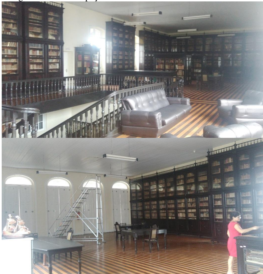
Fotografia 3 – Atual espaço da Biblioteca

Em 1974 teve uma primeira reforma no prédio e os livros foram limpos e organizados por professores do curso de biblioteconomia da UFPA. Contudo, a biblioteca permaneceu fechada, e num segundo período de reorganização da biblioteca, que durou de 1989 a 1992, professores e alunos do curso de Biblioteconomia fizeram a higienização e organização dos livros na estante para a biblioteca funcionar ao público, e este arranjo permanece até os dias de hoje (Fotografia 3).