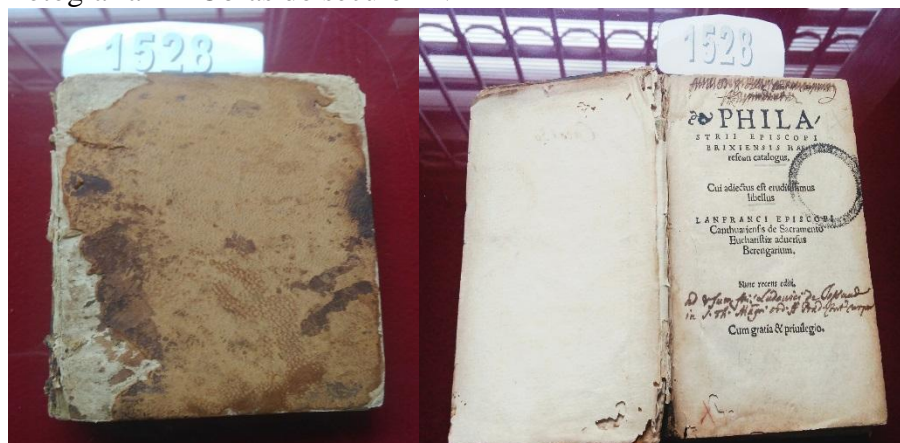
Fotografia 2 – Obras do século XVI