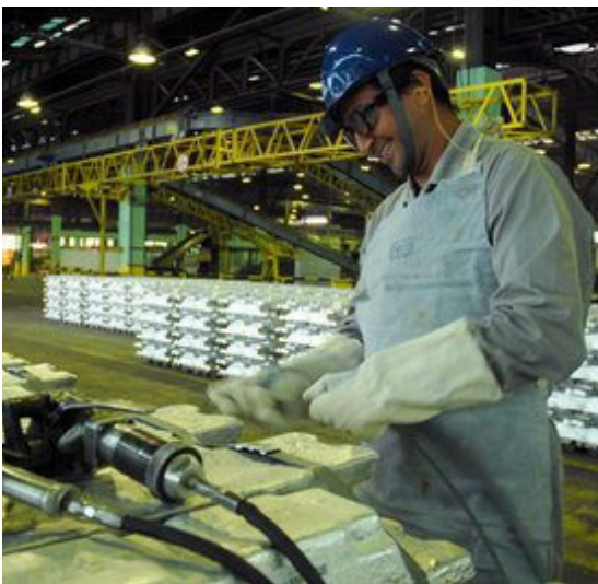
Produção do Alumínio