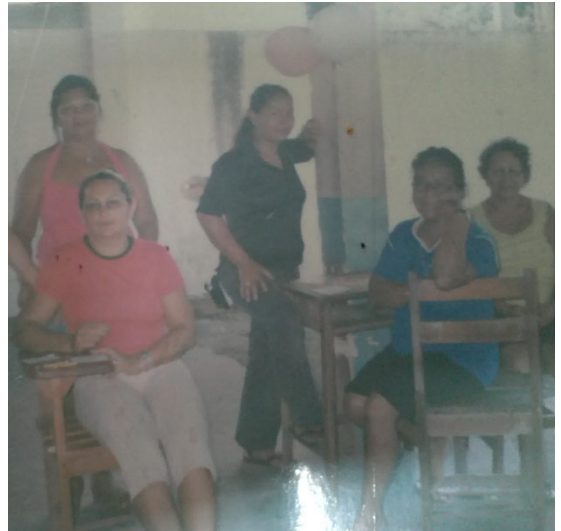
Sala de aula: década de 90