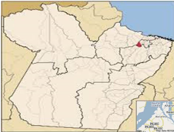
Figura 1: Localização do Município de Barcarena no Estado do Pará.