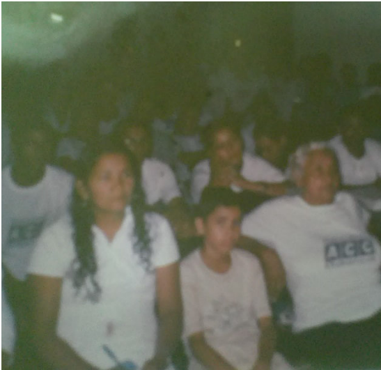
Sala de aula: década de 90