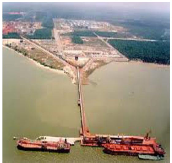
Porto de Vila do Conde