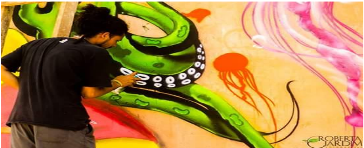
Figura 11 - Graf grafitando.

O grafite acontece no estado do Pará, mais frequentemente na região metropolitana por alguns grupos organizados como por exemplo o “ Cosp Tinta Crew ” que atua a 10 anos no cenário paraense do graffit e é deste grupo que busquei relatos como forma de contribuição para essa percepção atual do cenário hip hop em Belém do Pará. O entrevistado foi o grafiteiro conhecido como “Graf” (Fábio Luís Modesto Cardoso).