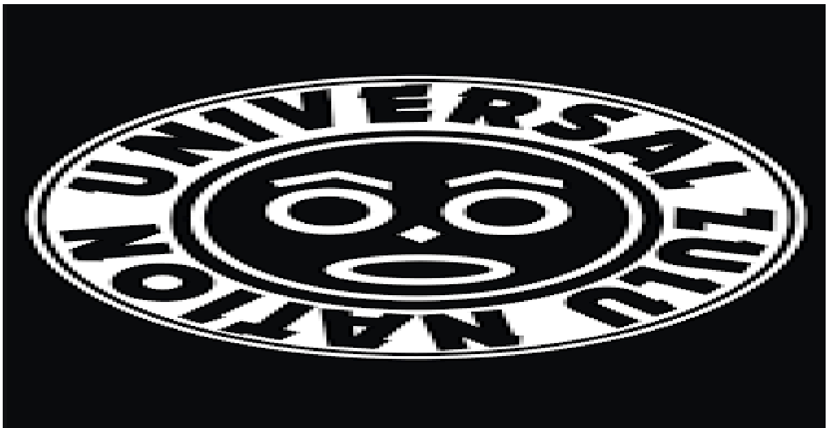
Figura 6 - Símbolo da Universal Zulu Nation . Fonte: Disponível em http://wearezulunation.tumblr.com/

Os trabalhos da UZN no Pará acontecem por meios de projetos como a produção de eventos nacionais e internacionais, seletivas, shows, encontros de dança, entre outros que citarei a baixo.