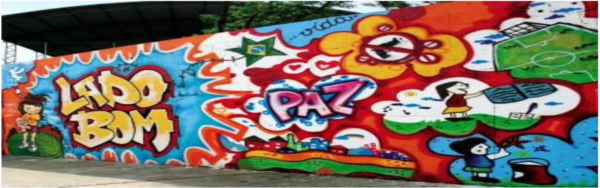
Figura 9 - Graffiti no Muro.