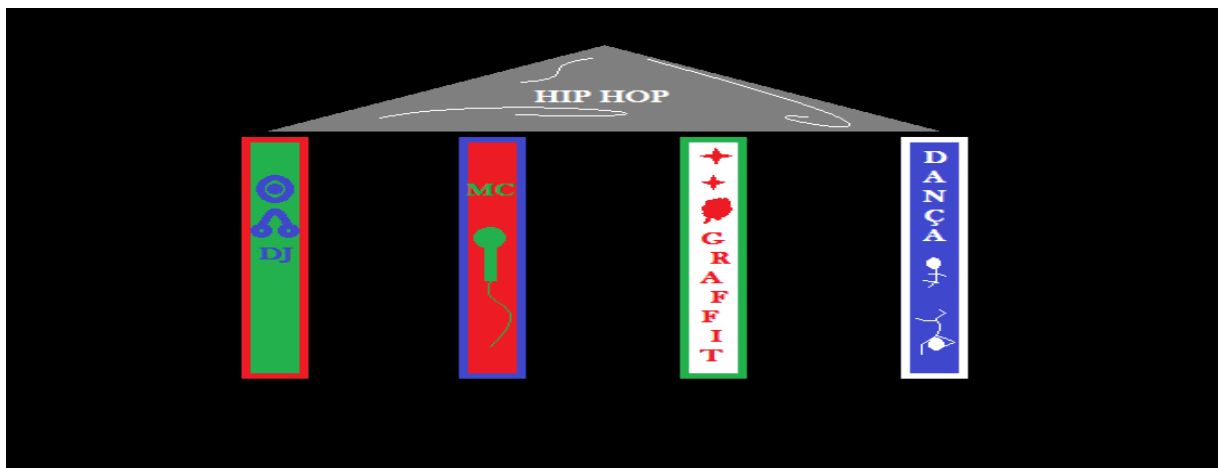
Figura 4 - A casa hip hop .

Na construção de uma casa é preciso erguer pilares para que ela possa ser sustentada e estes pilares são construídos a partir da teoria, que é a matemática, e da prática que é a mão de obra. Assim também foi pensada a construção do hip hop , com pilares que foram construídos com a teoria de seus idealizadores e com a prática de quem já tinha a experiência com os pilares antes mesmo da categorização dos mesmos, que são: DJ , MC , graffit e a dança .