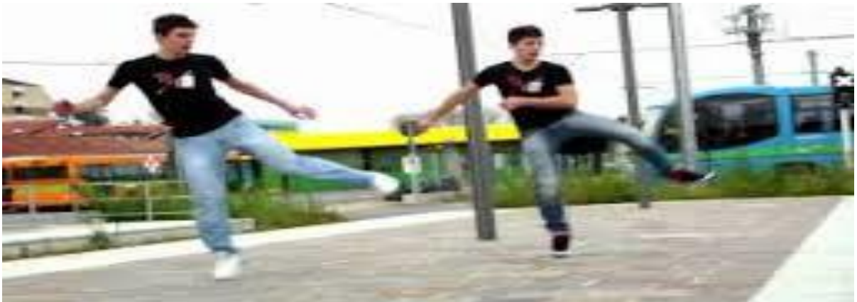
Figura 2 - Jump Style .

Com o passar do tempo, tive contato com outra dança que seria mais uma modinha, pelo menos na minha vida. Essa dança é intitulada de jump style , cujo nome traduzido para o português significa “estilo de salto”. Como o próprio nome já denuncia, a dança era concentrada cem por cento em saltos. Dançávamos sempre ao som de músicas eletrônicas e não era tão forte a ideia de grupos, às vezes acontecia de montarmos algumas coreografias em dupla ou em trio, mas nada que nos identificassem como grupo de dança. O auge desta dança passou mais uma vez e veio outra experiência para a minha bagagem de vivências.