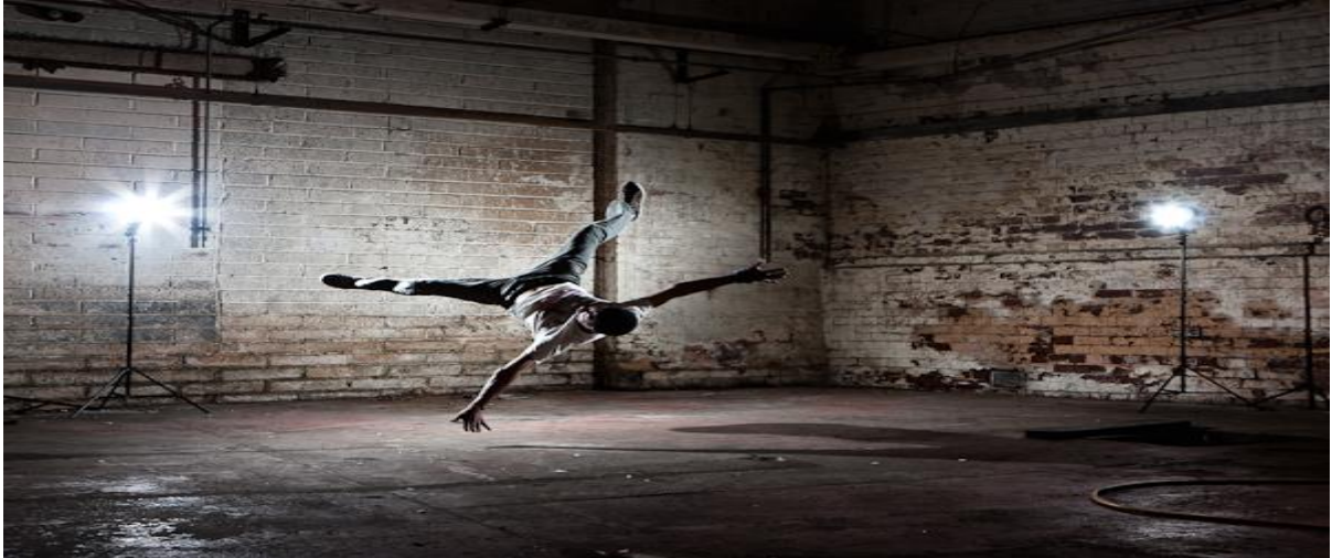
Figura 17 - B. Boy fazendo um air flare .

O Power move é a dança aérea que por sua vez, teve suas influências nos movimentos da ginástica olímpica e com o passar do tempo ganharam adaptações elaboradas pelos próprios B. Boys . A maioria dos movimentos são sobre um ou dois apoios podendo serem alternados.