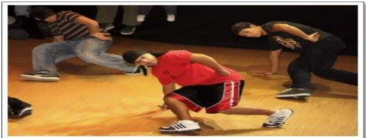
Figura 15 - B. Boy fazendo footworks .

E foram nessas festas especificamente as de Kool Herc , que apareceram Dois B. Boys , Keith e Kevin (Gêmeos) chamados de Nigga Twins (tradução livre: gêmeos negros) que se destacaram por serem os primeiros a levarem a dança em cima ( top rocking ) até o chão, de forma em que trabalhavam os membros superiores como forma de apoio e equilíbrio e os membros inferiores em movimentos circulares.