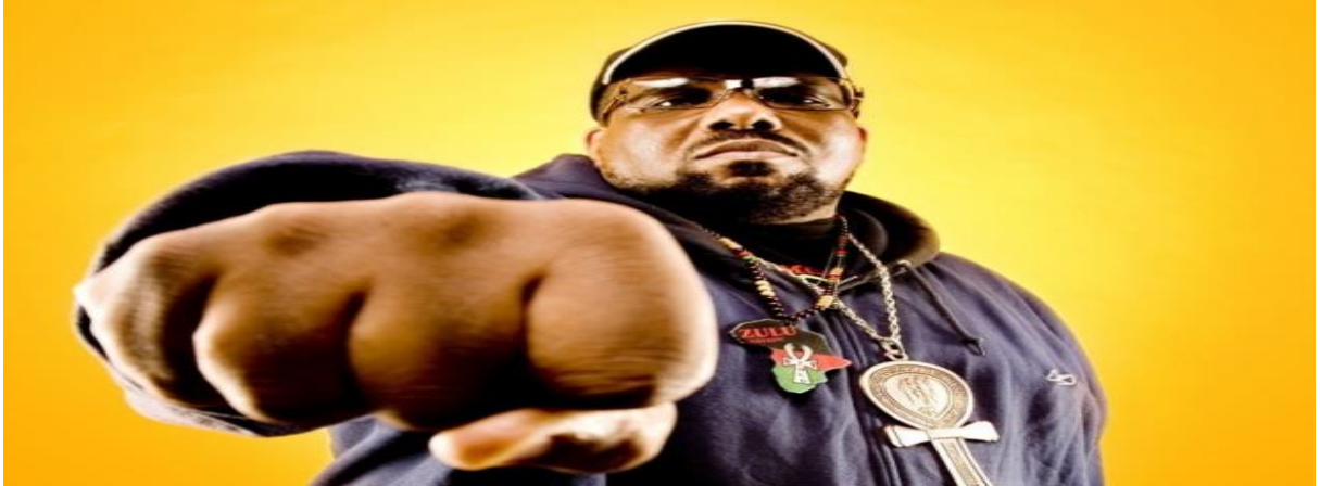
Figura 5 - Afrika Bambaataa . Fonte: Disponível em https://catracalivre.com.br/sp/educacao-3/gratis/metodista-recebe-afrika-bambaataa-para-palestra-gratuita-sobre-hip-hop-e-inclusao-social/

Bambaataa era membro de uma das maiores e mais perigosas gangues do Bronx , em New York , conhecida como “ Black Spades ” (panteras negras). Ele, que depois veio a ser conhecido como o criador do Electro Funk 10 e que hoje é um DJ reconhecido no mundo inteiro e que influenciou várias gerações, tanto na dança quanto na música.