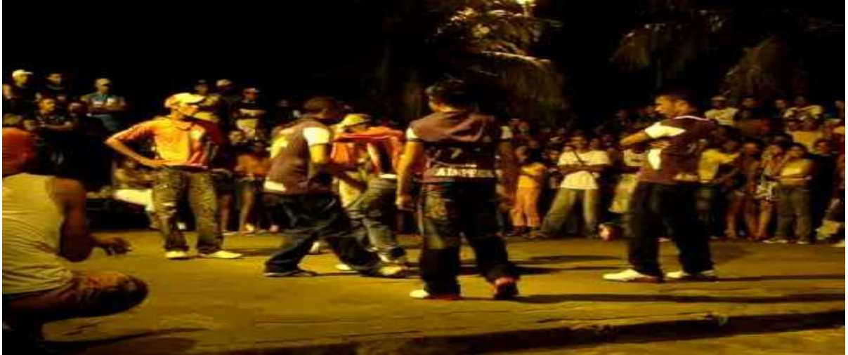
Figura 1 - Grupos de Elettro Dance .

Com o passar do tempo, tive contato com outra dança que seria mais uma modinha, pelo menos na minha vida. Essa dança é intitulada de jump style , cujo nome traduzido para o português significa “estilo de salto”. Como o próprio nome já denuncia, a dança era concentrada cem por cento em saltos. Dançávamos sempre ao som de músicas eletrônicas e não era tão forte a ideia de grupos, às vezes acontecia de montarmos algumas coreografias em dupla ou em trio, mas nada que nos identificassem como grupo de dança. O auge desta dança passou mais uma vez e veio outra experiência para a minha bagagem de vivências.