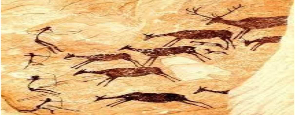
Figura 8 - Arte Rupestre.

Fascinante e envolta em mistério, a Arte Rupestre é a mais importante fonte de informação sobre as origens intelectuais e artísticas da humanidade. Um dos únicos vestígios deixados voluntariamente pelos homens pré-históricos, essa manifestação cultural é muito anterior à linguagem escrita. Modelar, gravar ou pintar sobre um suporte rochoso é uma atividade realizada em todos os continentes, da Europa à Ásia ou a Austrália, do Alasca à América do Sul; do Orinoco ao Rio da Prata ou à Patagônia. O registro rupestre mais antigo, uma linha desenhada em ziguezague gravada em uma caverna na Índia, foi datada entre 200 mil e 300 mil anos (OLIVEIRA, 2009, p. 296. apud BEDNARIK, 1998, p. 5).