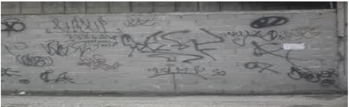
Figura 10 - Pichação no Muro.

Essa forma de protesto, expressão e de comunicação, assim como o graffit que se utiliza das mesmas condições compartilham do mesmo objetivo (digo isso com relação à arte e não com relação ao que é certo ou errado). A diferença entre ambos é somente o que a lei permite, ou seja, a autorização para o uso dos desenhos em áreas públicas ou particulares, uma vez que esses desenhos na maioria das vezes são feitos em muros para maior visibilidade das pessoas.