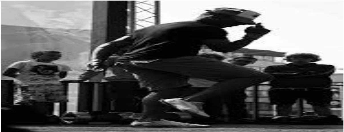
Figura 3 - Shuffle Dance .

Logo após, migrei para uma dança que ficou muito conhecida e ainda é até hoje. É intitulada em inglês de “ shuffle ”, que traduzida para o português significa “embaralhar”. Essa dança dava a impressão de que os pés se embaralhavam ocasionando giros e chutes, sendo o principal foco desta dança, deslizar pelo o espaço em todas as direções.