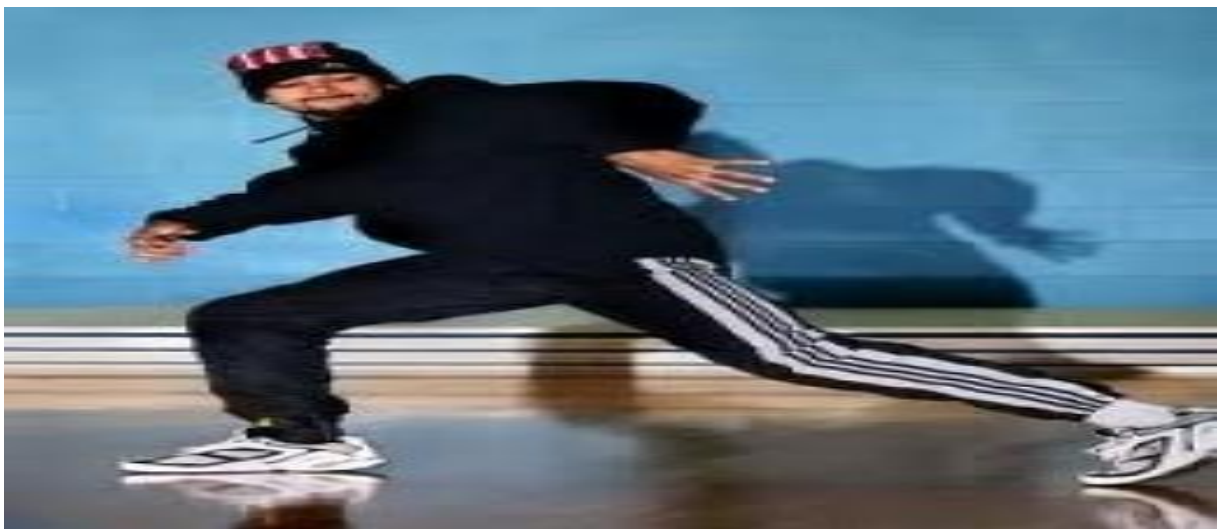
Figura 14 - Top rocking b-boy expressing himself.

Com o break beat rolando nas festas de Kool Herc e se espalhando por New York City , começaram a surgir os B. Boys (break boys) e B. Girls (break girls) e os