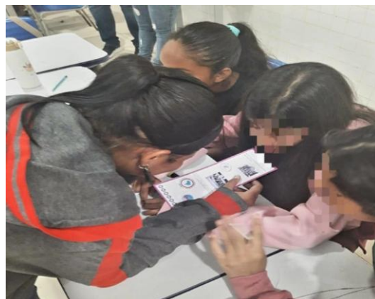
Figura 6 - Alunos analisando as resposta