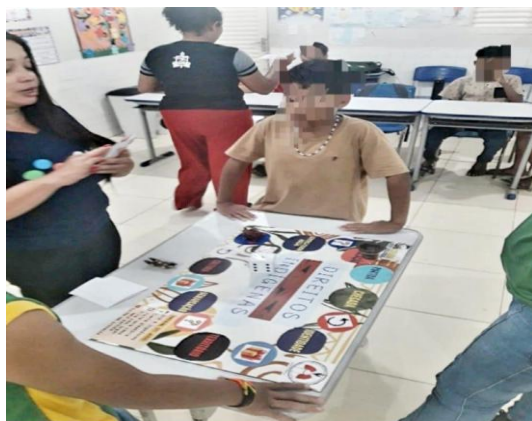
Figura 5 - Alunos jogando

Cada equipe designa um participante para realizar o lançamento do dado. O valor obtido determina o número de casas a serem percorridas no tabuleiro. Ao atingir uma casa correspondente ao tema da aula, o mediador do jogo propõe uma das questões contidas nos cartões de apoio. A equipe dispõe de um minuto para consultar o cartão informativo, que oferece subsídios para a formulação da resposta correta. Durante essa etapa, os alunos demonstraram elevado engajamento na dinâmica do jogo.