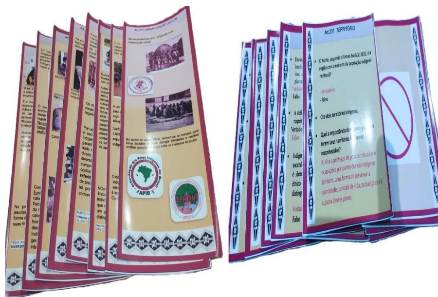
Figura 4 - Cards: perguntas e dicas