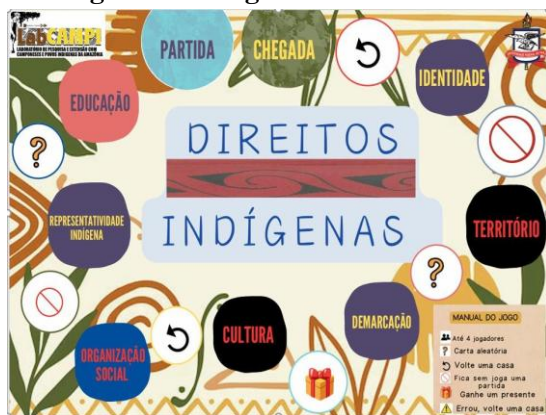
Figura 2 - Imagem do tabuleiro

Na segunda etapa, o tabuleiro e as regras do jogo foram introduzidos aos estudantes.