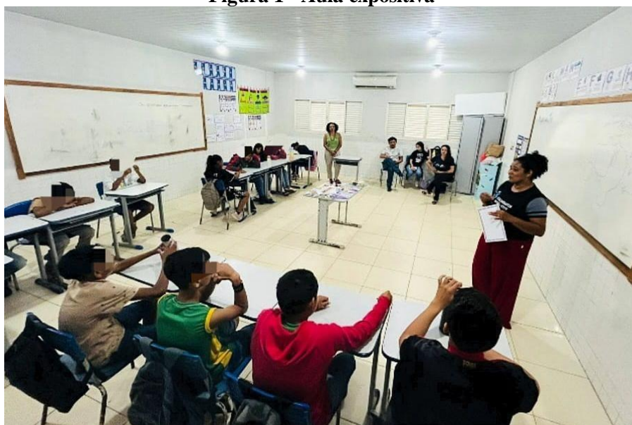
Figura 1 - Aula expositiva

Inicialmente, os alunos participaram de uma aula teórica com abordagem expositiva e interativa sobre os direitos indígenas estabelecidos na Constituição Federal de 1988. Essa base teórica foi essencial para contextualizar o jogo e ampliar o repertório conceitual dos discentes.