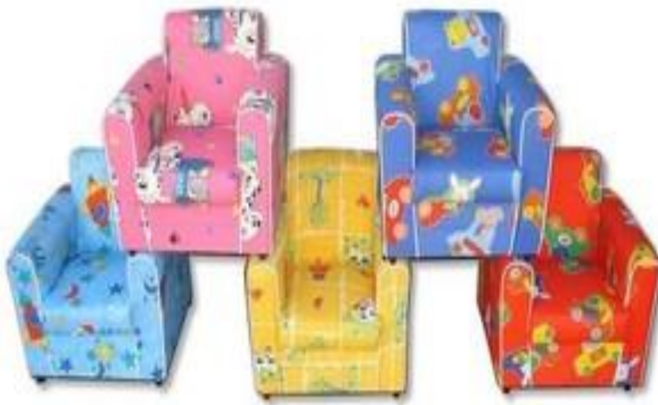
Figura 2: mini sofá infantil

A opção do pufe é interessante, mas somente quando a criança vai ler, pois se ela precisar escrever isto não será ergonomicamente recomendado, por causa de problemas posturais, assim, outra opção poderia ser o mini sofá infantil. Conforme figura 2.