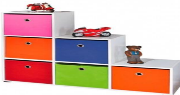
Figura 7: armário colorido

Pequenos armários: bastante coloridos, crianças gostam de cores fortes e chamativas, podem inclusive fazer as devidas identificações exatamente pelas cores. Conforme figura 7: