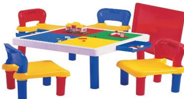
Figura 3: mesa com cadeiras infantil.

As mesas e cadeiras infantis para realização de leituras e trabalhos pedagógicos manuais, E também onde as crianças possam desenvolver atividades em grupo assim interagindo umas com as outras. conforme figura 3: