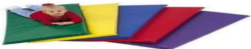
Figura 4: colchonetes coloridos

Além de mesas e cadeiras para sentar, crianças gostam de ficar no chão e principalmente de se deitar em colchonetes para fazer suas pequenas leituras, descanso e suas meditações. conforme figura 4 .