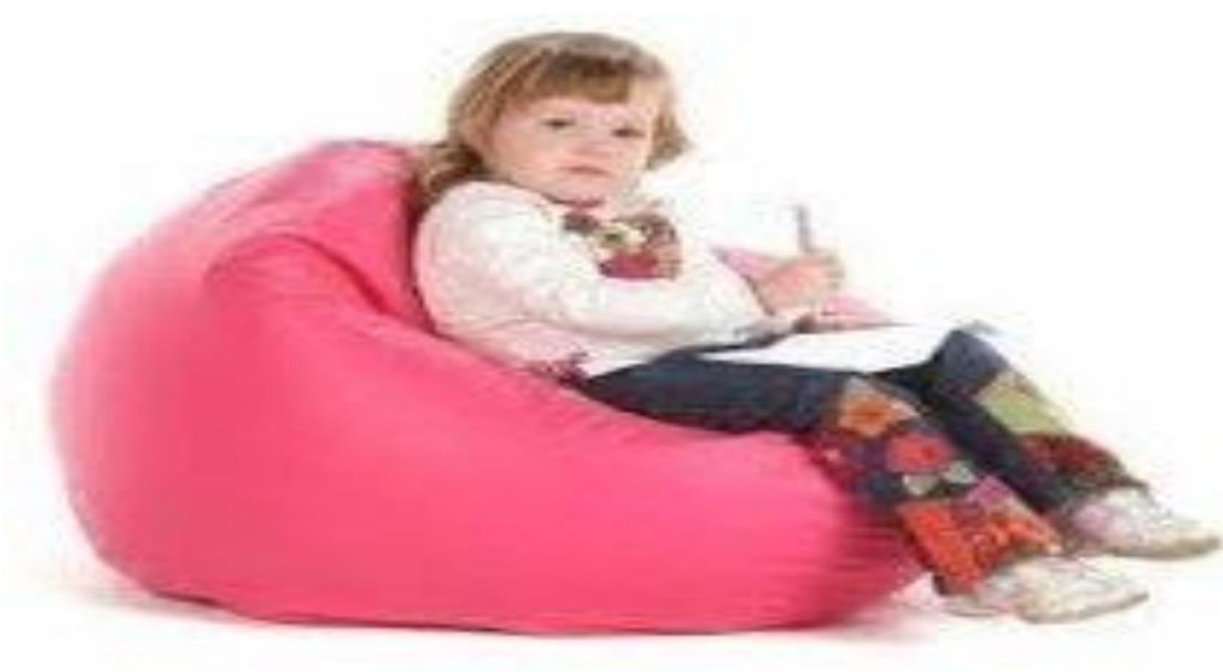
Figura 1: criança sentada em um pufe

A criança tem que se sentir bem à vontade e tem que se sentir muito bem em relação aos móveis. Na verdade, elas têm que se sentir confortáveis para que a leitura seja algo prazeroso. Um ambiente aconchegante é primordial para todos os tipos de atividades. Conforme figura 1: