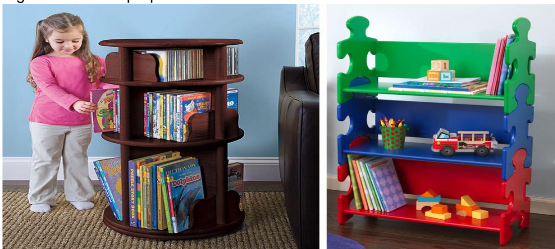
Figura 6: estante pequena

As estantes devem ser coloridas e com uma altura menor que as estantes habituais de bibliotecas, as estantes devem estar na altura desses minis leitores, podem se usar também caixas ou pequenos armários. Conforme figura 6.