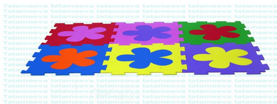
Figura 5: tatame de E.V.A

Tatames de EVA para que as crianças não fiquem diretamente no chão, um E.V.A limpo e conservado é bastante acolhedor e confortável. Algumas atividades que necessitam ser feitas no chão são melhores com tatame E.V.A, pois é até mais higiênico. Conforme figura 5.