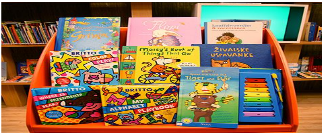
figura 8: livros infantis

entrevista com crianças seria algo bastante significativo para aquisição e montagem desse tipo de acervo. Conforme figura 8.