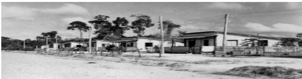
Figura: 2- Residências em Brasil Novo, construídas pelo INCRA em 1971.