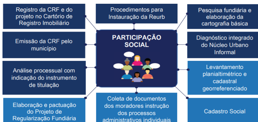
Figura 02 - Participação Social em todas as etapas da REURB