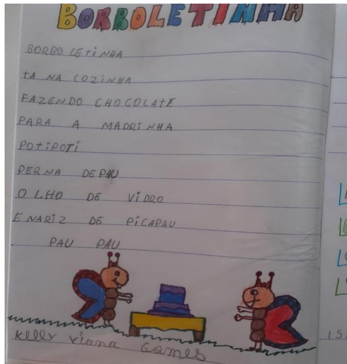
Imagem 03: Borboletinha