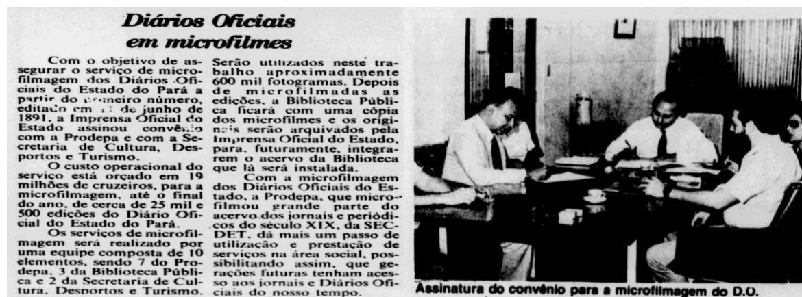
Figura 1 – Diário do Pará