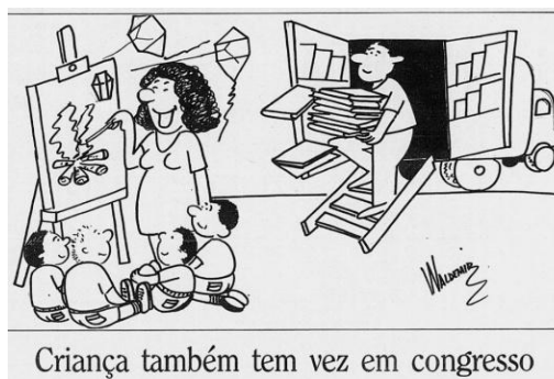
Figura 7 - O liberal