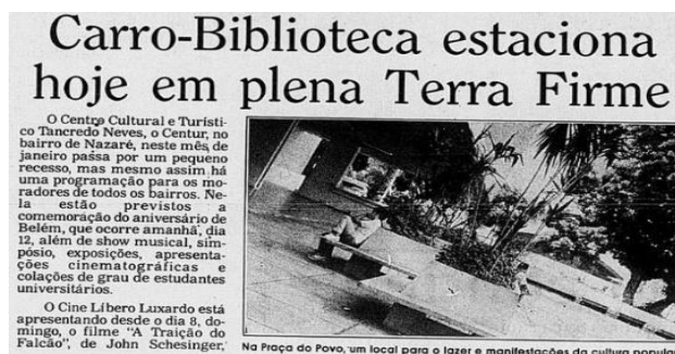
Figura 3 - O liberal