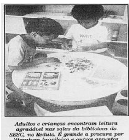
Figura 9 - O liberal