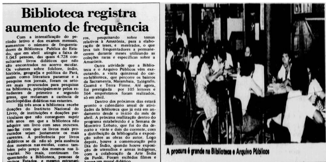
Figura 8 - Diário do Pará