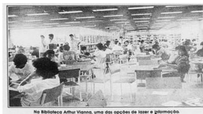
Figura 6 - O liberal