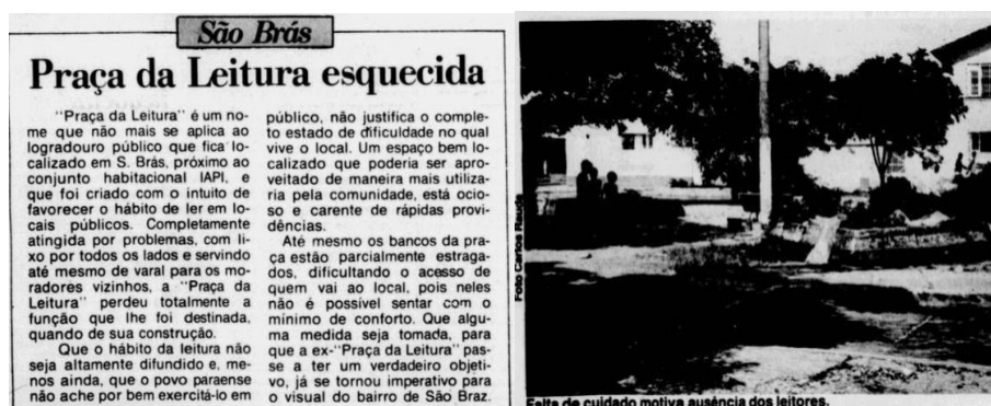
Figura 4 - Diário do Pará