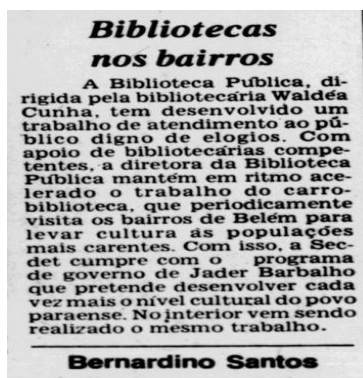
Figura 2 - O liberal