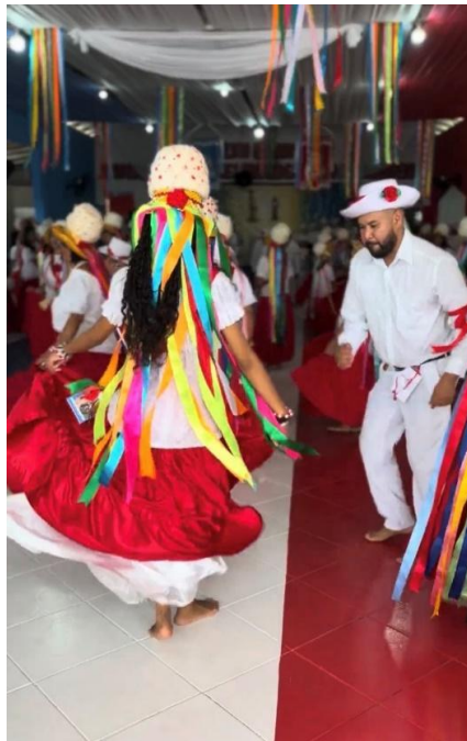
Figura 2 – Dia de São Benedito