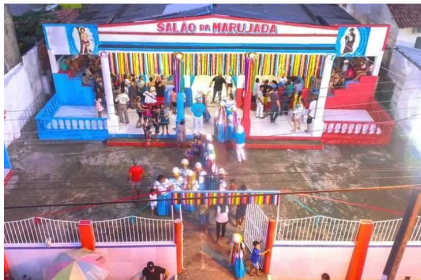
Figura 2 - Localização do Salão da Marujada em Tracuateua -PA

O município tracuateuense concentra diversas manifestações religiosas e culturais, como Festival Folclórico o qual deixou o referido lugar conhecido regionalmente com o título de Cidade Junina. Há também o Círio de Nossa Senhora de Nazaré, o qual reuni os cidadãos católicos para expressarem a sua fé. Destaca-se também a Festividade de São Sebastião e São Benedito que acontece todos os anos no mês de janeiro no Salão da Marujada, localizado no centro da cidade, em frente à Praça Matriz, conforme a figura a seguir: