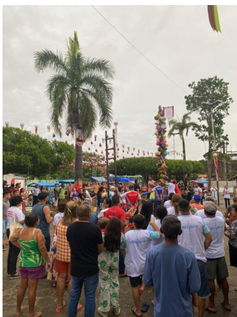
Figura 1 - Levantação dos mastros

Nesse sentido, essa manifestação católica tem início “[...] na tarde do dia 18 de janeiro, com a saída dos mastros da casa de seus respectivos juízes e juízas formando uma procissão que segue pelas ruas até o barracão. [...]” (REIS, 2015, p.75), acompanhada pelos músicos ao som da roda, um dos ritmos tocados na festa, os dois mastros, sendo um de São Benedito e outro de São Sebastião, enfeitados por frutas, bebidas, vasilhas e brinquedos, os quais são erguidos na Praça Matriz. A Figura 1, a seguir, traz a imagem do momento da levantação dos mastros de São Benedito e São Sebastião: