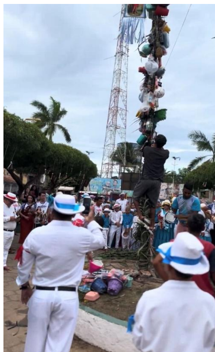
Figura 4 – Derrubação dos mastros

Por conseguinte, “no dia 21, os marujos e as marujas, de vermelho e azul homenageiam os dois santos da cidade.” [...]” (REIS, 2015, p.76), reunidos na Praça Matriz para a derrubação dos mastros anunciam que a festa está chegando ao fim. Ao som da roda, bandeiras, ornamentos e objetos são retirados dos mastros para serem distribuídos à comunidade. Posteriormente, na Igreja Matriz, é celebrada a missa de encerramento da festividade, em seguida, os novos juízes assumem o compromisso da realização da festa do ano seguinte.