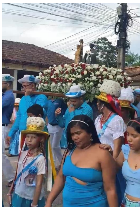
Figura 3 – Dia de São Sebastião e Procissão dos Santos Padroeiros

No dia 20, seguindo a mesma sequência do dia anterior, os participantes da marujada, vestidos dessa vez com a roupa nas cores azul e branca, homenageiam São Sebastião, à tarde os marujos e devotos se reúnem para a procissão dos Santos Padroeiros São Benedito e São Sebastião, percorrendo pelas ruas da cidade, conforme a imagem: