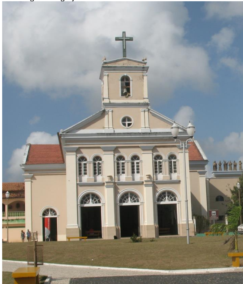
Figura 4: Igreja Catedral de Nossa senhora do Rosário

Outra igreja que faz parte do patrimônio arquitetônico de Bragança, é a Igreja Catedral de Nossa senhora do Rosário construída por escravos a partir de 1854 para ser a igreja de São Benedito, porém, em 1872, houve uma troca entre as irmandades as quais pertenciam as igrejas, troca essa que permanece até a atualidade.