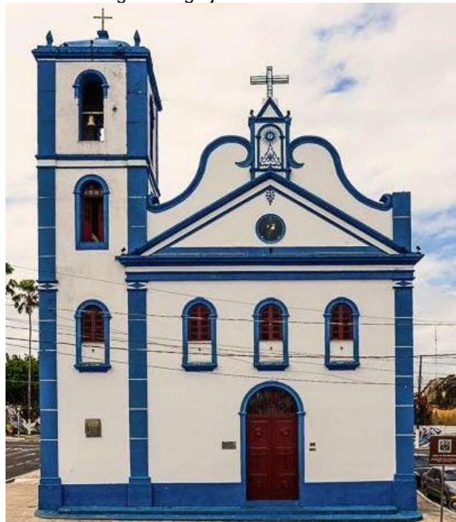
Figura 3: Igreja de São Benedito

As origens de Bragança remontam à primeira metade do século XVII, pois em 1634 foi fundado um povoado as margens do Rio Caeté chamado Souza do Caeté que em 1854 se tornou o município de Bragança por um decreto imperial. Com mais de 400 anos o município possui um rico patrimônio histórico e cultural composto pelos costumes, festas religiosas, comidas típicas e construções antigas que se encontram por várias partes do município 1 .