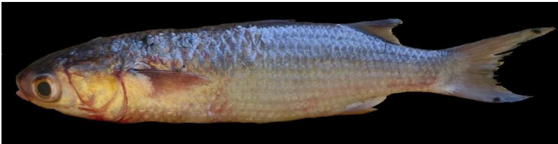
Figura 29: Registro de espécime de Mugil curema , etnoidentificado como Pratiqueira, Vista Alegre do Pará, PA, Brasil.