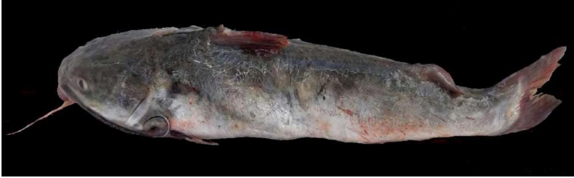
Figura 15: Registro de espécime de Sciades herzbergii , etnoidentificado como Bagre, Araticum-Mirim, PA, Brasil.