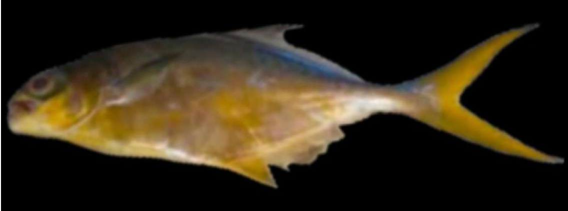
Figura 36: Registro de espécime de Oligoplites palometa , etnoidentificado como Pratiuiro, Vista Alegre do Pará, PA, Brasil.