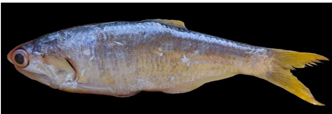
Figura 33: Registro de espécime de Anchovia clupeioides , etnoidentificado como Sardinha-de-gato, Vista Alegre do Pará, PA, Brasil.