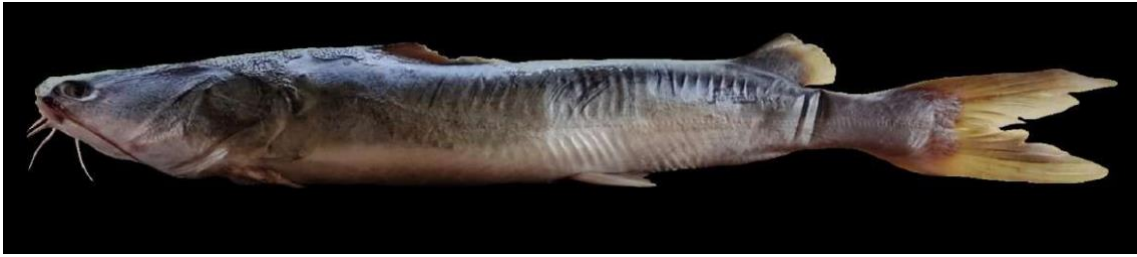
Figura 31: Registro de espécime de Sciades passany , etnoidentificado como Oritinga, Vista Alegre do Pará, PA, Brasil.