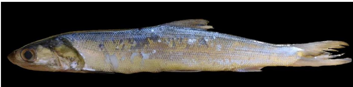
Figura 19: Registro de espécime de Elops smithi , etnoidentificado como Uéua, Vista Alegre do Pará, PA, Brasil.