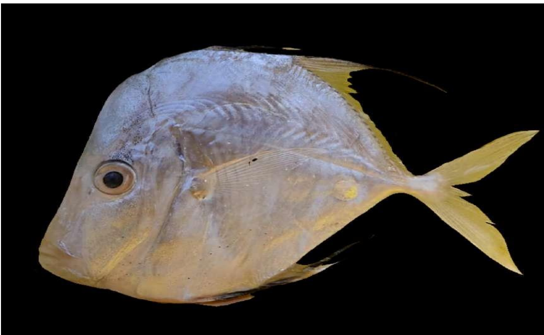
Figura 35: Registro de espécime de Selene vomer , etnoidentificado como Peixe-galo, Vista Alegre do Pará, PA, Brasil.