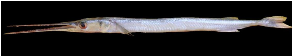
Figura 24: Registro de espécime de Strongylura marina , etnoidentificado como Timucu, Vista Alegre do Pará, PA, Brasil.