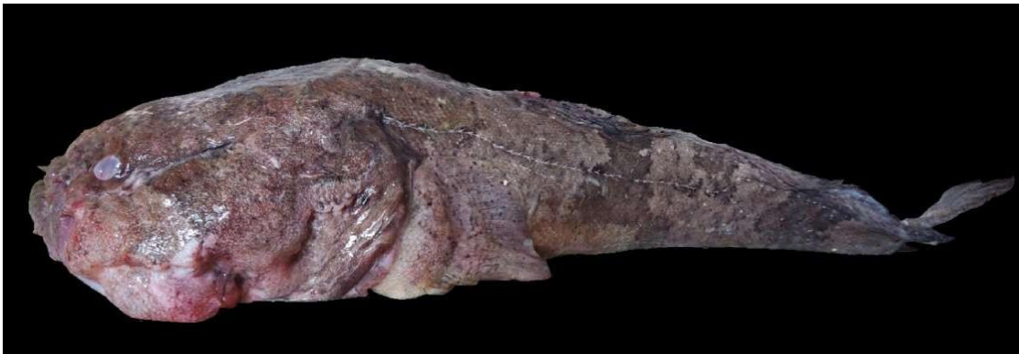
Figura 13: Registro de espécime de Batrachoides surinamensis , etnoidentificado como Pacamum, Araticum-Mirim, PA, Brasil.