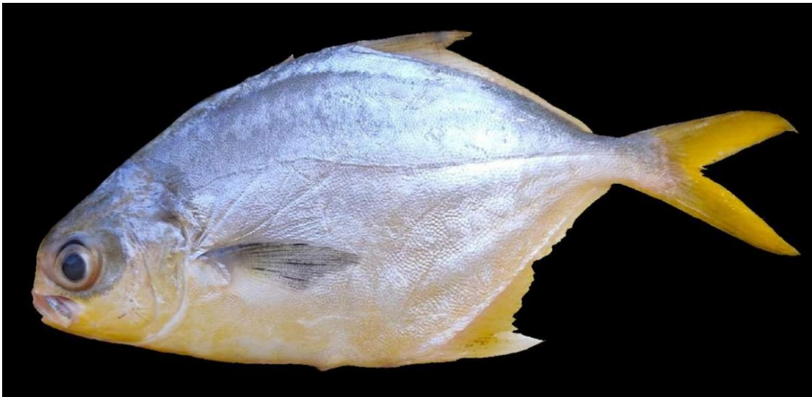
Figura 2: Registro de espécime de Trachinotus carolinus , etnoidentificado como Candira, Araticum-Mirim, PA, Brasil.