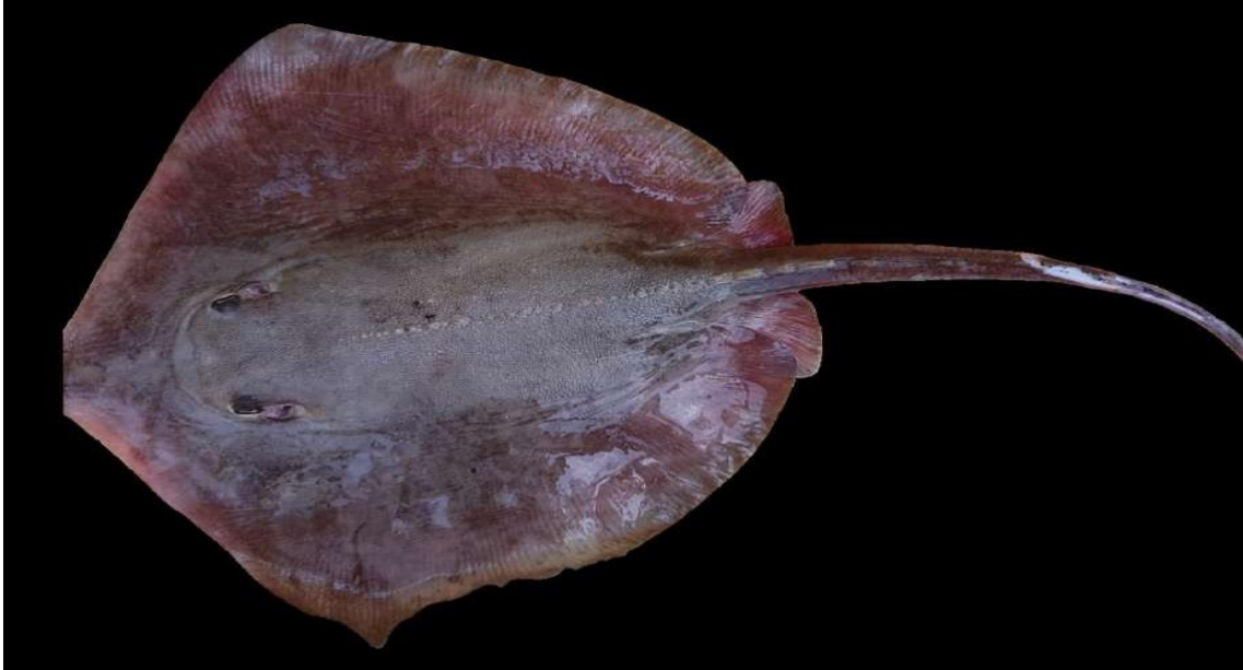
Figura 26: Registro de espécime de, etnoidentificado como Arraia, Vista Alegre do Pará, PA, Brasil.