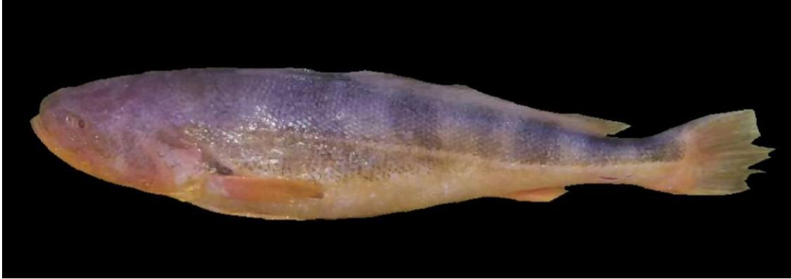
Figura 10: Registro de espécime de Nebris microps , etnoidentificado como Sete-grude, Araticum-Mirim, PA, Brasil.