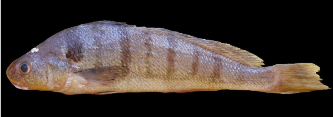
Figura 34: Registro de espécime de Paralonchurus brasiliensis , etnoidentificado como Cachôrra, Vista Alegre do Pará, PA, Brasil.