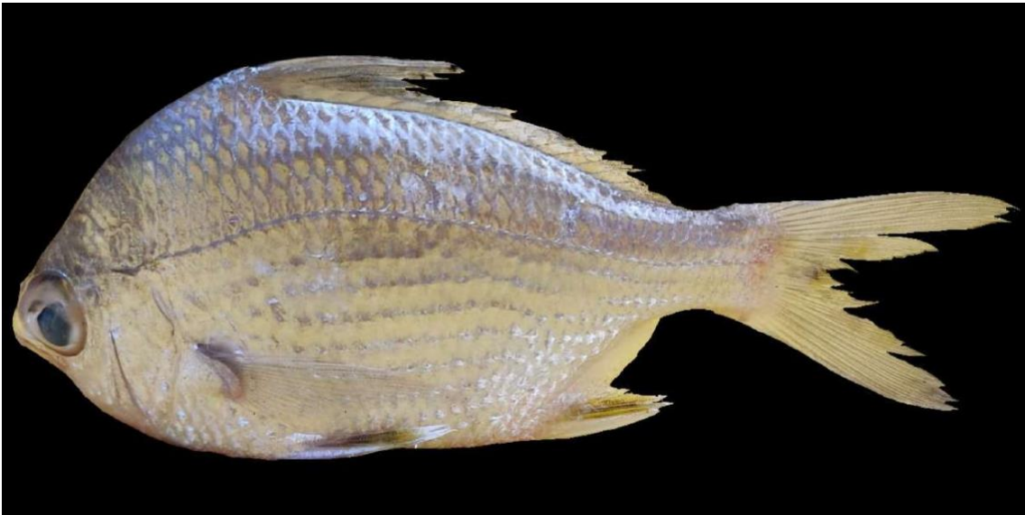
Figura 22: Registro de espécime de Diapterus rhombeus , etnoidentificado como Bico-doce, Vista Alegre do Pará, PA, Brasil.