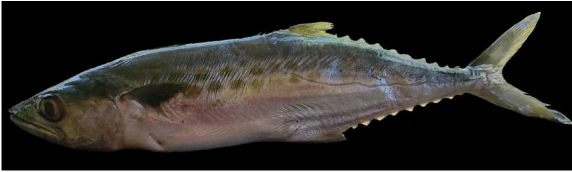
Figura 28: Registro de espécime de Scomberomorus brasiliensis , etnoidentificado como Peixe serra, Vista Alegre do Pará, PA, Brasil.