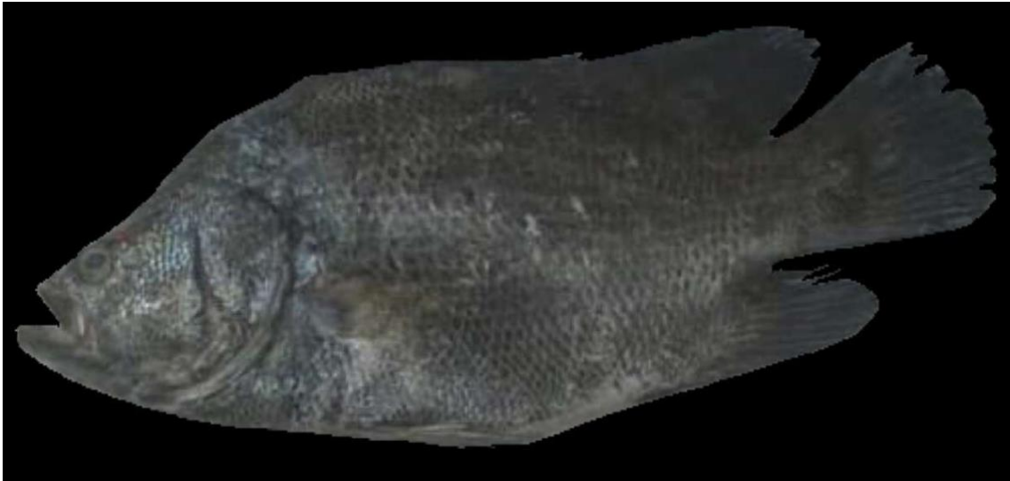
Figura 18: Registro de espécime de Lobotes surinamensis , etnoidentificado como Carauaçu, Vista Alegre do Pará, PA, Brasil.