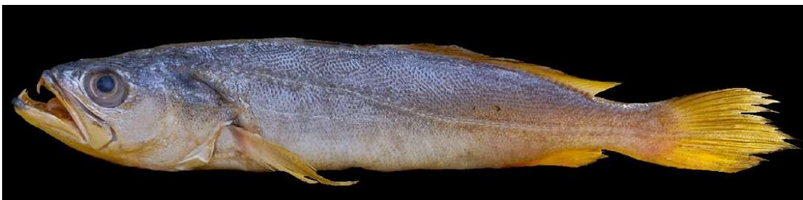
Figura 30: Registro de espécime de Macrodon ancylodon , etnoidentificado como Gó, Vista Alegre do Pará, PA, Brasil.