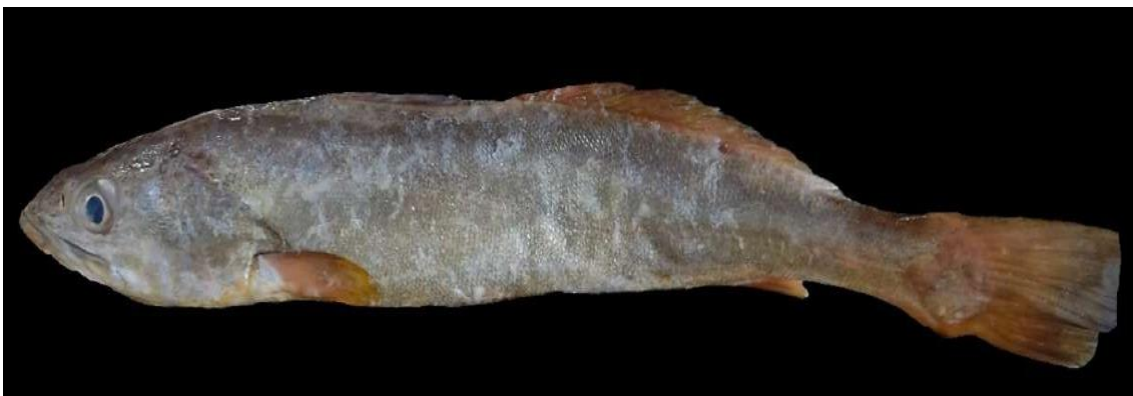
Figura 6: Registro de espécime de Cynoscion virescens , etnoidentificado como Corvina-corneta, Araticum-Mirim, PA, Brasil.