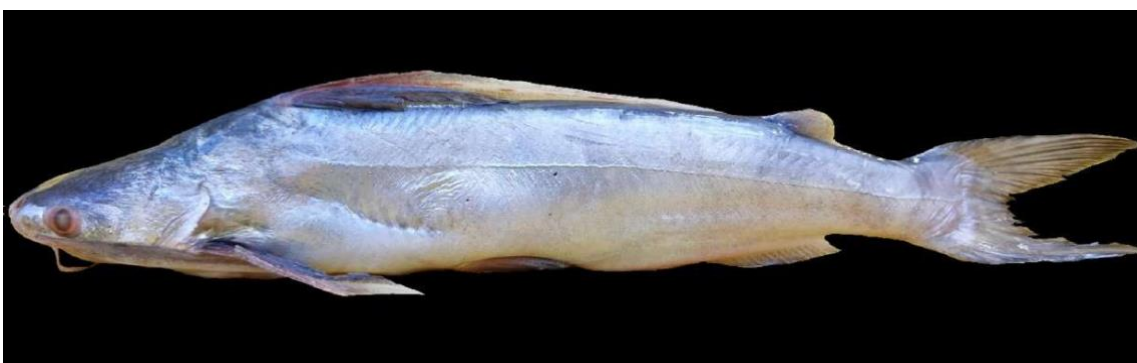
Figura 20: Registro de espécime de Bagre bagre , etnoidentificado como Bandeirado, Vista Alegre do Pará, PA, Brasil.