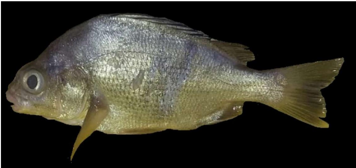
Figura 11: Registro de espécime de Genyatremus luteus , etnoidentificado como Peixe pedra, Araticum-Mirim, PA, Brasil.