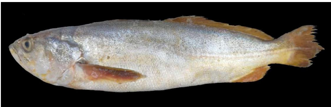
Figura 14: Registro de espécime de Macrodon ancylodon , etnoidentificado como Gó, Araticum-Mirim, PA, Brasil.