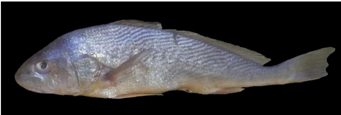
Figura 16: Registro de espécime de Menticirrhus cuiaranensis , etnoidentificado como Mãe-de-vô, Araticum-Mirim, PA, Brasil.