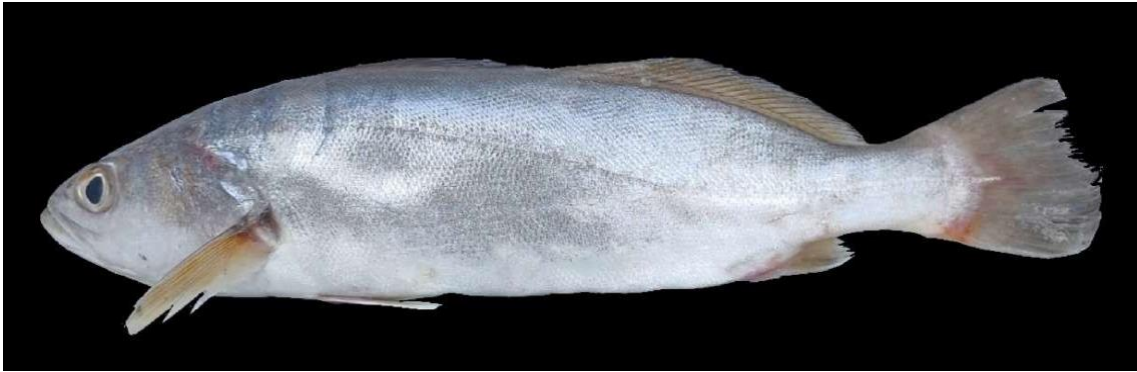
Figura 7: Registro de espécime de Cynoscion leiarchus , etnoidentificado como Corvina-dura, Araticum-Mirim, PA, Brasil.