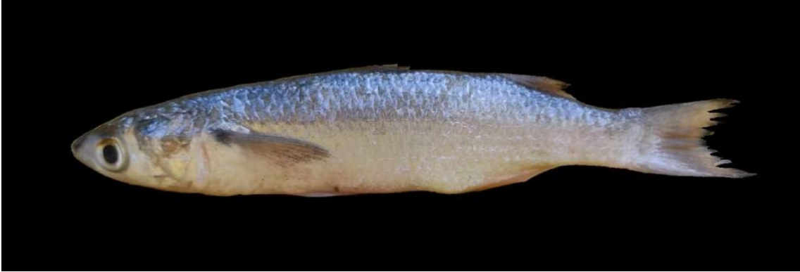
Figura 21: Registro de espécime de Mugil incilis , etnoidentificado como Caíca e Tainha, Vista Alegre do Pará, PA, Brasil.