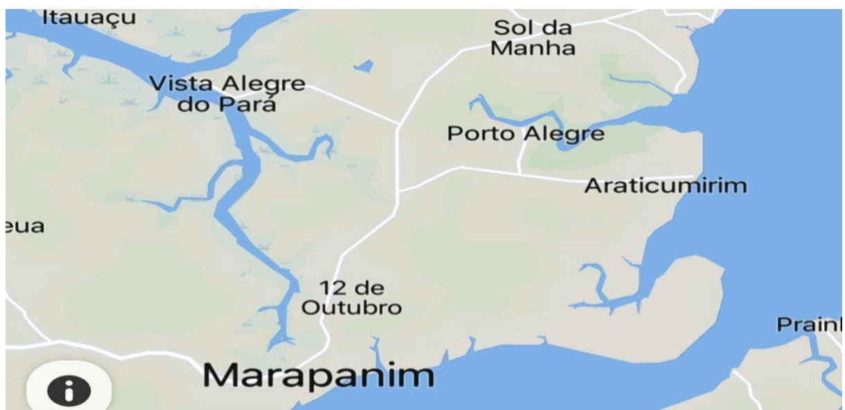
Figura 1- Vila de Vista Alegre do Pará e Araticum-mirim, Município de Marapanim-PA, Nordeste Paraense.

O estudo foi realizado no município litorâneo Marapanim-Pa, mais precisamente nas vilas Vista Alegre do Pará e Araticum-mirim ( fig.1 ).