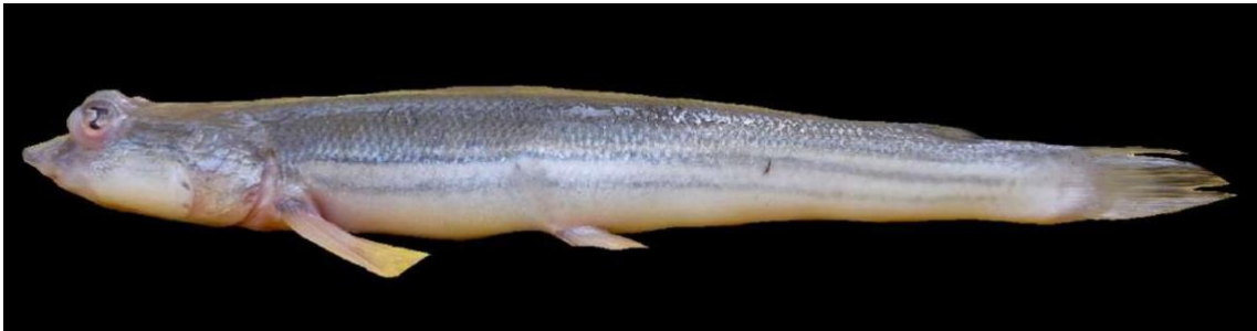
Figura 27: Registro de espécime de Anableps microlepis , etnoidentificado como Tralhoto, Vista Alegre do Pará, PA, Brasil.