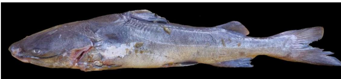
Figura 17: Registro de espécime de Sciades proops , etnoidentificado como Cangatá, Vista Alegre do Pará, PA, Brasil.