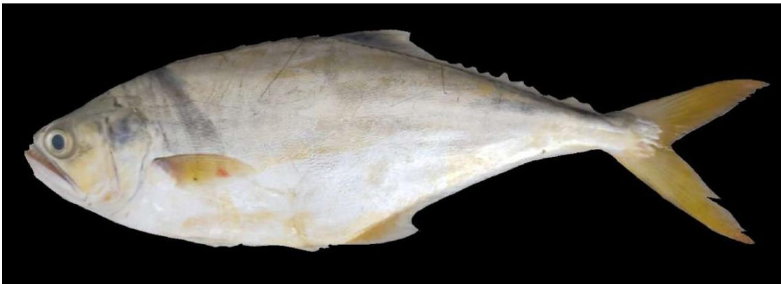
Figura 8: Registro de espécime de Trachinotus cayennensis , etnoidentificado como Pratiuiro, Araticum-Mirim, PA, Brasil.