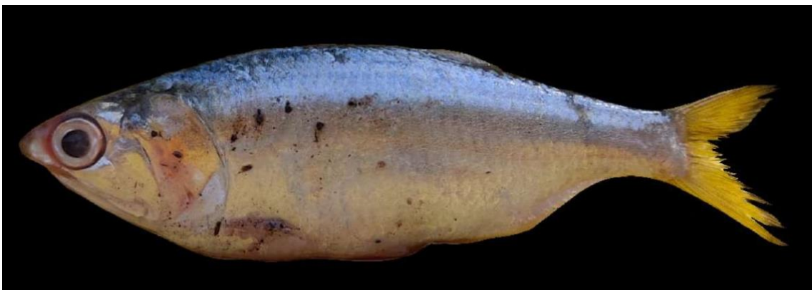
Figura 32: Registro de espécime de Cetengraulis edentulus , etnoidentificado como Sardinha, Vista Alegre do Pará, PA, Brasil.