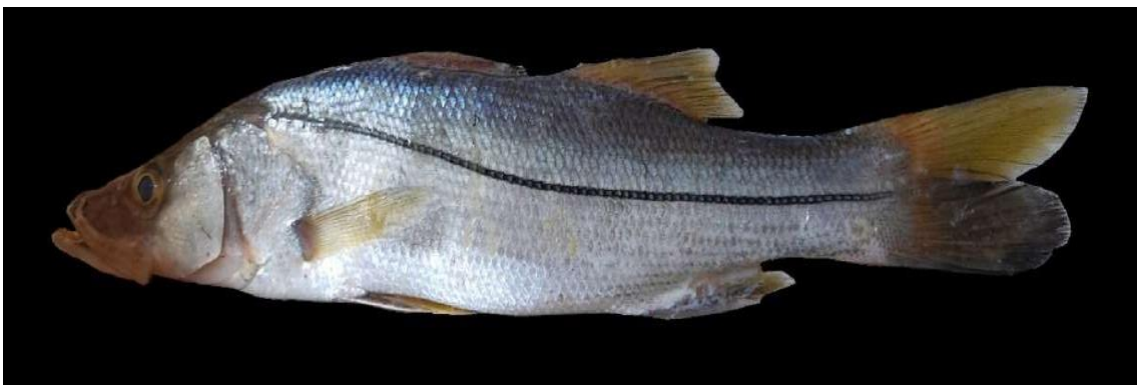
Figura 3: Registro de espécime de Centropomus irae , etnoidentificado como Camorim, Araticum-Mirim, PA, Brasil.