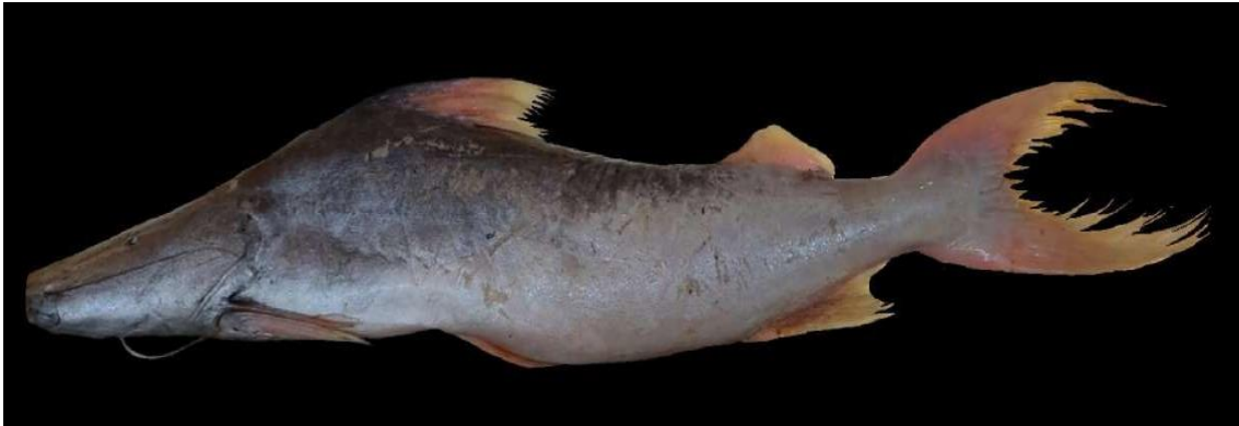
Figura 4: Registro de espécime de Brachyplatystoma vaillantii , etnoidentificado como Dourada, Araticum-Mirim, PA, Brasil.