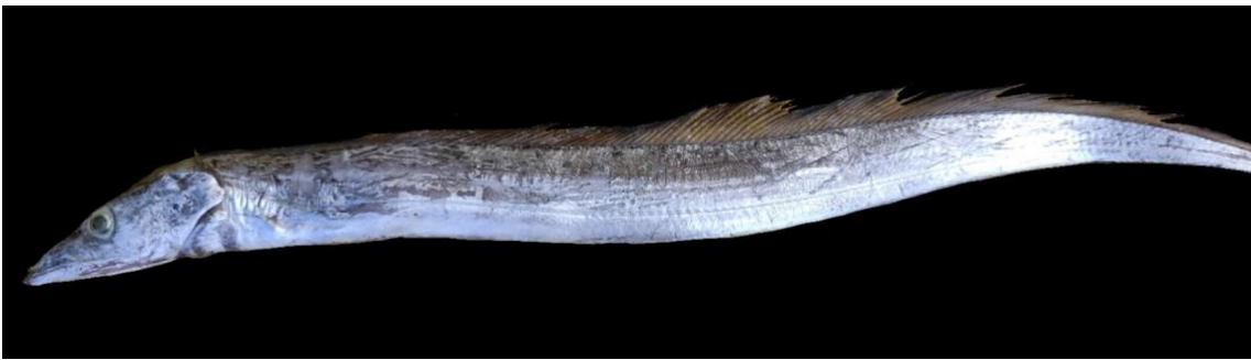
Figura 37: Registro de espécime de Trichiurus lepturus , etnoidentificado como cinturão e Peixe-espada, Vista Alegre do Pará, PA, Brasil.