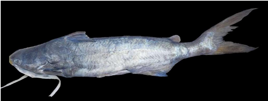
Figura 5: Registro de espécime de Bagre bagre , etnoidentificado como Bandeirado, Araticum-Mirim, PA, Brasil.