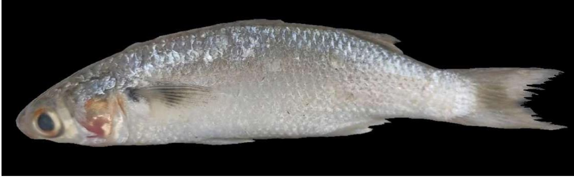
Figura 12: Registro de espécime de Mugil incilis , etnoidentificado como Caíca, Araticum-Mirim, PA, Brasil.