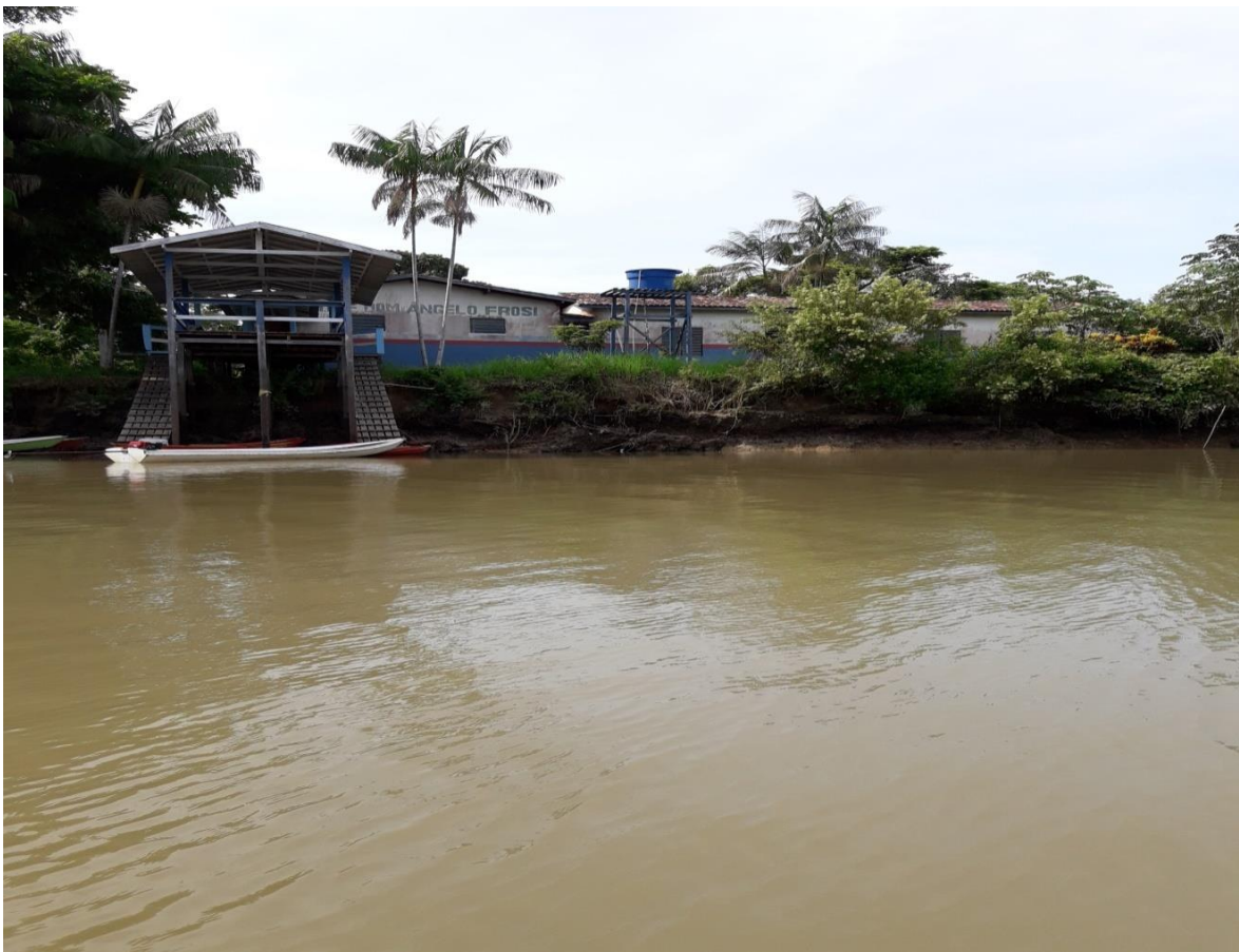
Foto 1- localização da escola Dom Ângelo Froisi.

A escola Municipal de Educação Infantil e Ensino Fundamental Dom Ângelo Froisi teve sua inauguração, no dia 12 de abril de 1998, sendo que sua primeira construção foi de madeira, e após alguns anos de funcionamento a mesma foi reformada, passando da madeira para a alvenaria e sua reinauguração foi realizada no dia 16 de março de 2012, pela prefeitura Municipal de Abaetetuba, pelo secretário de educação municipal (SEMEC), pais, professores e a comunidade.