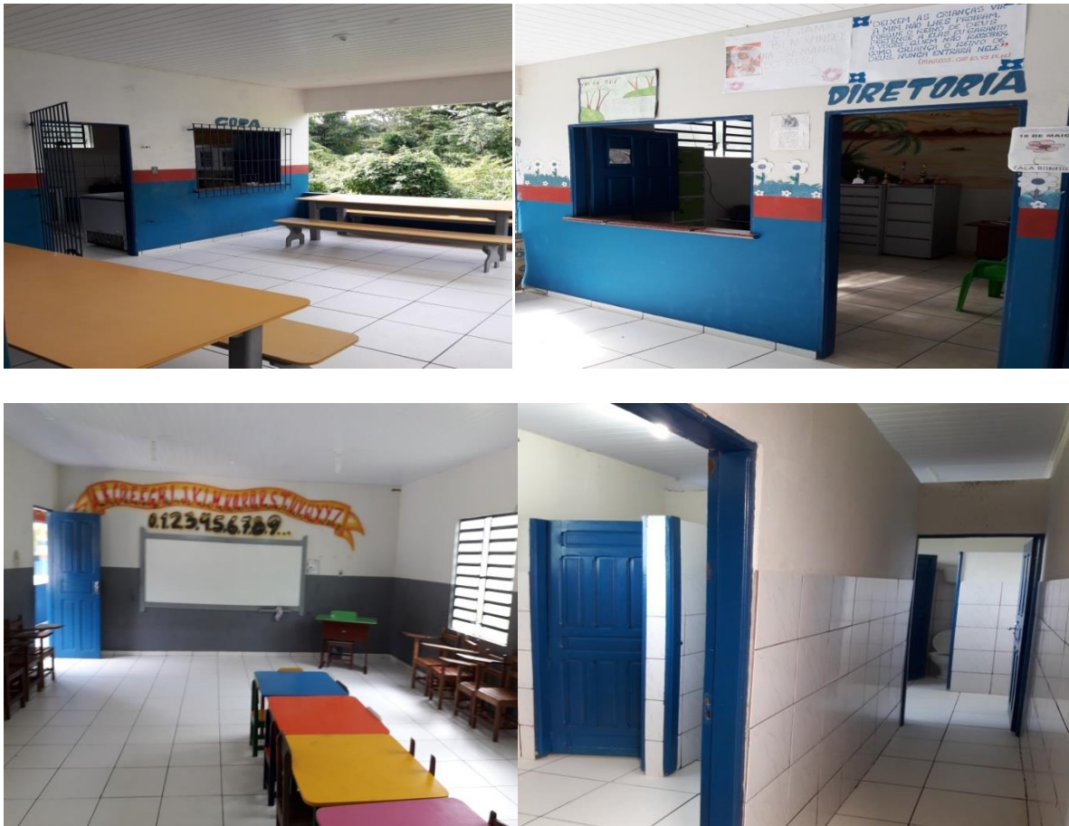
Foto 2- Espaços físicos da escola Dom Ângelo Frosi.

A escola foi construída em terreno de várzea, e seu prédio de alvenaria possui apenas um bloco, onde funcionam 04 (quatro) salas de aula, e possui atualmente 01 (uma) diretoria, 01 (uma) secretaria, 01(uma) brinquedoteca, 01 (uma) copa, 03 (três) banheiros, um dos meninos, um das meninas e um dos funcionários.