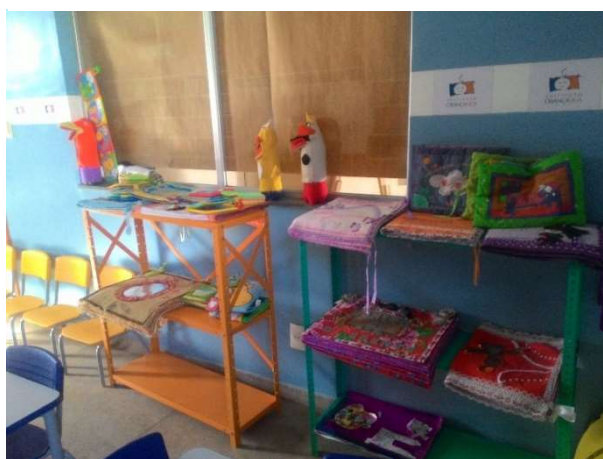
FIGURA 7 – JANELA DA BRINQUEDOTECA

Mas a janela possui um papel colado ao vidro que impede a visão como pode ser visto na imagem (figura 7). Como a atividade mais recorrente na biblioteca é a exibição de filmes, a intenção é impedir que a luz passe pela janela e atrapalhe a visão da televisão. Isso poderia ser resolvido substituindo o papel por cortinas, como tem nas outras janelas, que poderiam ser utilizadas apenas quando necessário não atrapalhando a visão da sala pelo lado de fora.