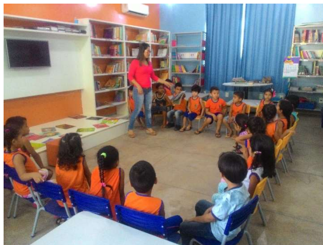
FIGURA 4 - ATIVIDADE EM GRUPO

Houve uma atividade em que diversos livros foram expostos no palquinho que fica no centro da biblioteca e as crianças foram orientadas a ir à frente, escolher um livro e contar a história para seus colegas (figura 4)