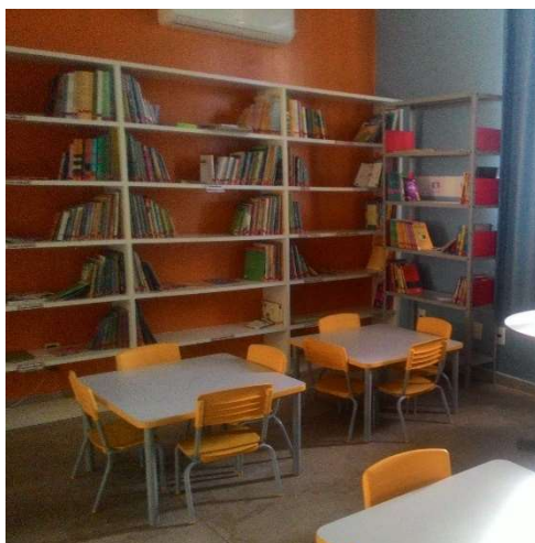
FIGURA 2 - ACERVO DA BIBLIOTECA

O acervo da biblioteca deve ser de acordo com seu público, sendo a Rita Nery uma escola de ensino infantil com alunos de 4 e 5 anos, o acervo de sua biblioteca é em sua maioria de obras para o público infantil. A figura 2 mostra as estantes com o acervo de livros da biblioteca