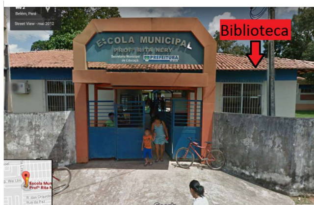
FIGURA 1 – FACHADA DA ESCOLA

Na imagem (figura 1) temos a entrada da escola com destaque ao prédio que abriga a biblioteca.