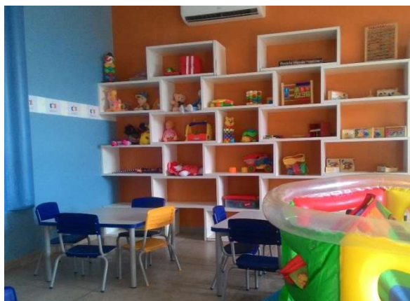
FIGURA 8 – ACERVO DA BRINQUEDOTECA