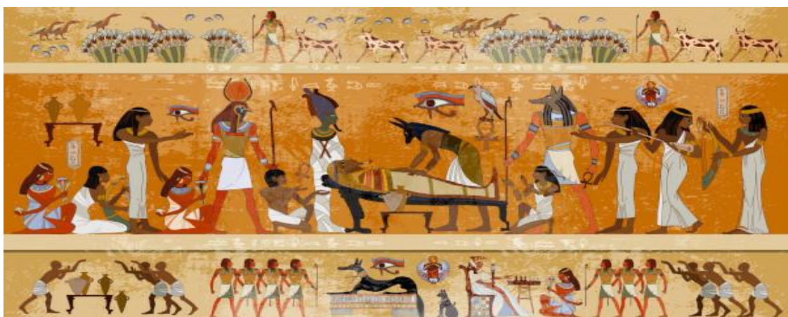
Figura 3 - Arte Sequencial no antigo Egito

Dizer quem foi o criador das primeiras histórias em quadrinhos é uma tarefa difícil, pois ao longo da história existem muitos nomes concorrendo ou lutando por este lugar. No entanto, as origens desse estilo de narrativa gráfica se perdem no tempo. Culturas antigas, como a egípcia e a grega contavam histórias a partir de sequências de imagens pintadas ou desenhadas em pedras ou papiros. Pode-se observar gravuras e imagens organizadas de forma sequencial, conforme a seguinte figura: