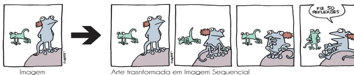
Figura 2 - Arte Sequencial

A imagem abaixo mostra a maneira como a arte sequencial é organizada, segue uma sequência definida sempre da esquerda para a direita, cada quadro segue uma ordem e, assim, a narrativa acaba sendo formada.