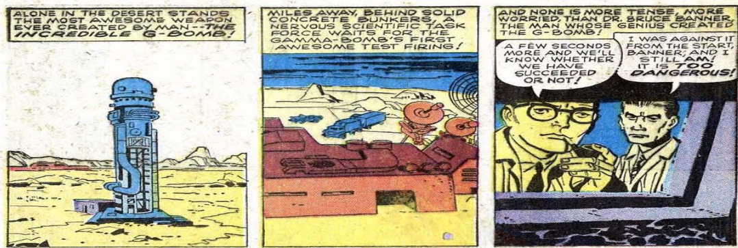
Figura 5 - Imagem retirada da revista Hulk 01, de 1962

Um outro ponto importante é o cenário onde se passam a maioria das histórias contidas na revista, que é um deserto. O próprio teste da bomba de hidrogênio foi feito em um deserto, no novo México, como ilustra Abeid: “Em 14 de julho de 1945 era testada, no deserto de Alamogordo, Novo México, a primeira bomba atômica” (Abeid, 2004). Trata-se de uma “coincidência” nada sutil entre a revista em quadrinho (HQs) e o contexto histórico geral da época, como apresentado na imagem que segue: