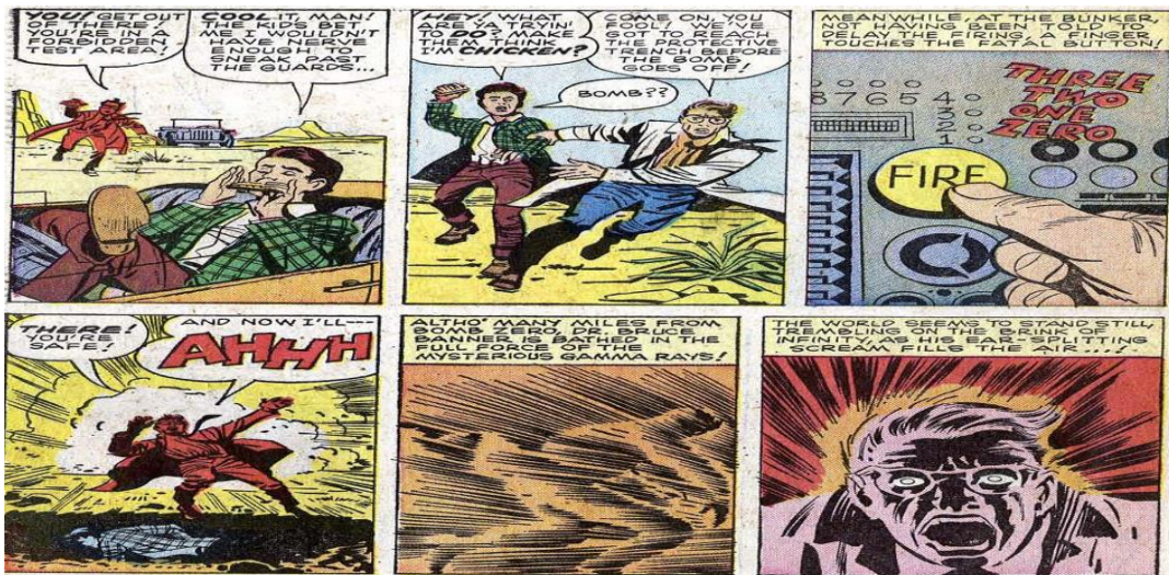
Figura 6 - Imagem retirada da revista Hulk 01 de 1962

A espionagem era uma prática recorrente na Guerra Fria, tanto no imaginário popular quanto em livros e outras obras cinematográficas da época. Voltando os olhos para a revista que este artigo analisa, o próprio acidente que transforma o personagem protagonista em um monstro verde e raivoso é causado por um espião soviético, que acaba se infiltrando no laboratório americano onde estavam sendo realizados os testes para a bomba de raios gama. Neste caso, há uma alusão direta à bomba de hidrogênio que seria testada em 1954 (Abeid, 2004). É o que está evidenciado na imagem: