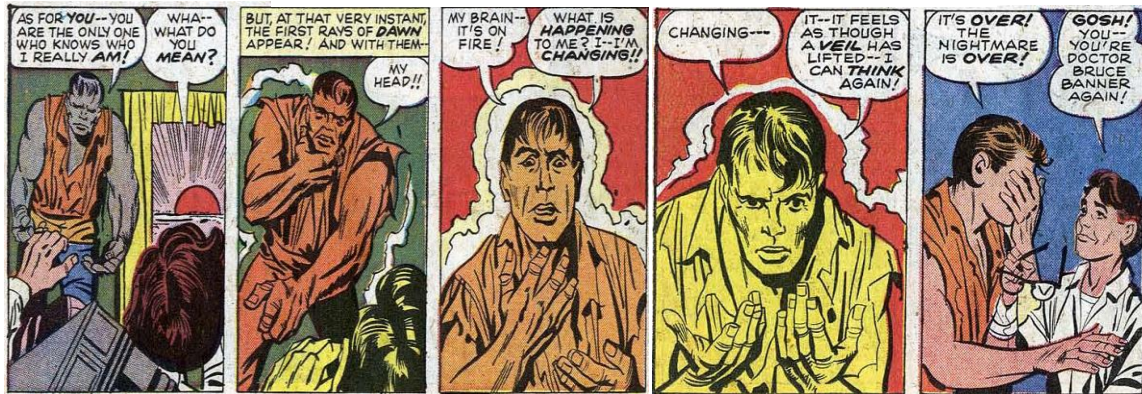
Figura 1 Imagem retirada da revista Hulk 01 de 1962

Atualmente, o principal exemplo de arte sequencial são as revistas em quadrinhos (HQs). Segue uma imagem 1 que ilustra esta forma de arte, com trechos da revista do incrível Hulk, onde as figuras se apresentam em uma sequência como uma forma de contar uma história real ou ficcional: