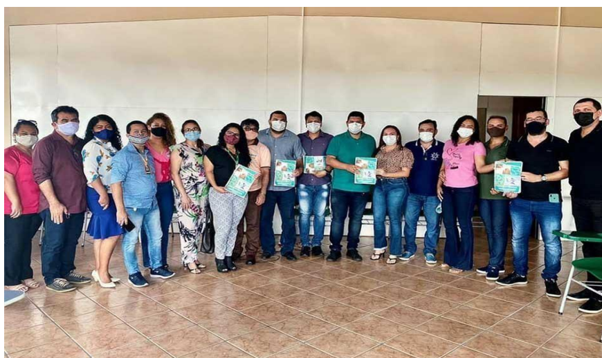
Ilustração 1: Parceiros EDUCAPESCA