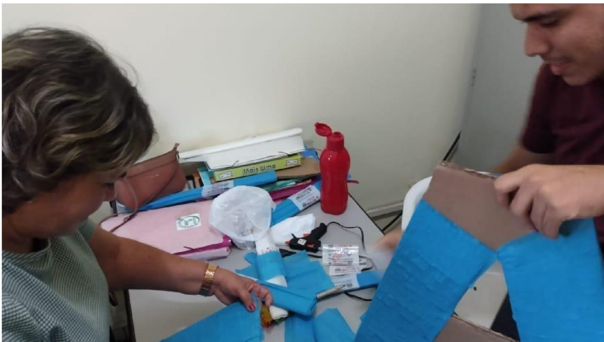
Ilustração 2- Estagiário auxiliando a coordenação