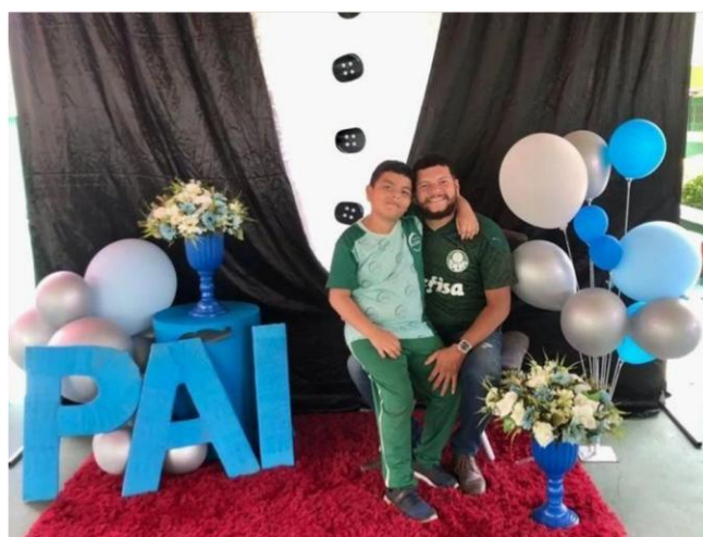
Ilustração 3 - Evento dia dos pais

alternando entre atendimento presencial e virtual. Soubemos neste momento que o uso das tecnologias digitais se tornaram mais presentes nestes novos tempos e promoveram maior proximidade e a possibilidade de rápido contato com as famílias.