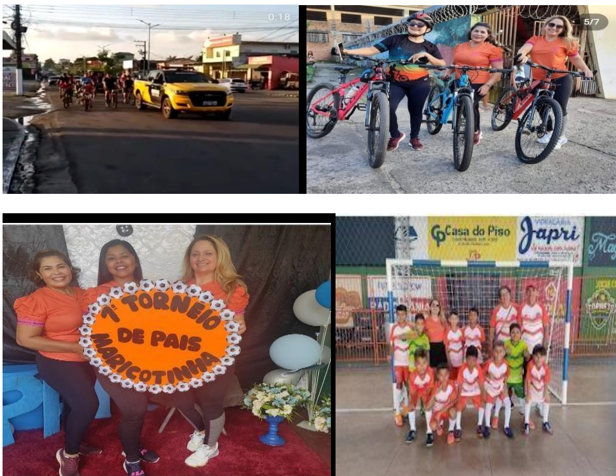
Ilustração 4 - Evento do dia dos pais