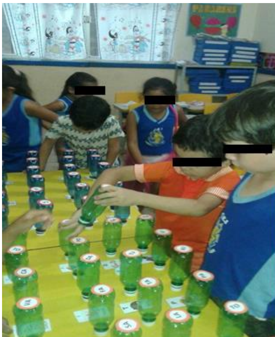
Imagem 4: Atividade lúdica descobrindo as palavras