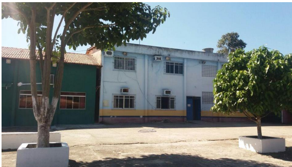
Imagem 1 - Centro Educacional “Castelo do Saber” (fachada da escola).

O Centro de Educação Infantil “Castelo do Saber” é composto de 24 (vinte e quatro) funcionários distribuídos nas seguintes categorias 4 (quatro) serventes, 2 (dois) auxiliares administrativos, 1 (uma) secretária, 02 (dois) zeladores, 02 (dois) braçais, 02 (duas) merendeiras e 11(onze) professores. Nas imagens 1 e 2 abaixo, temos: A visão da fachada da escola e da área externa da mesma respectivamente.