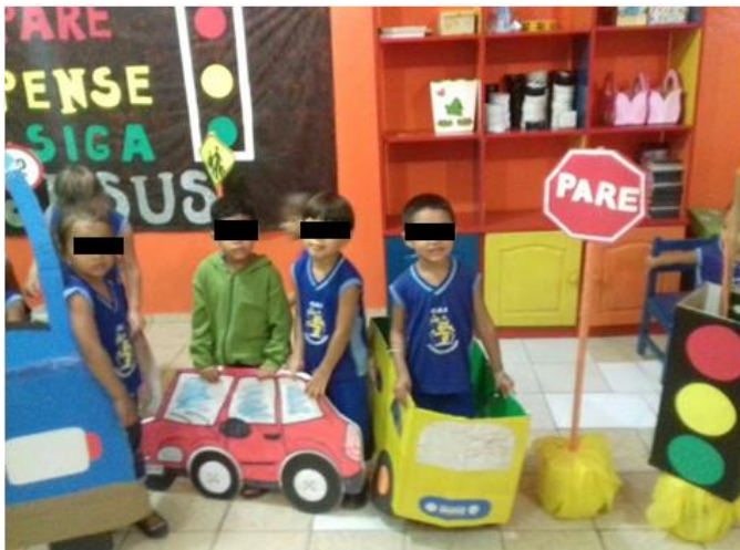
Imagem 5: Atividade lúdica sobre o Trânsito.