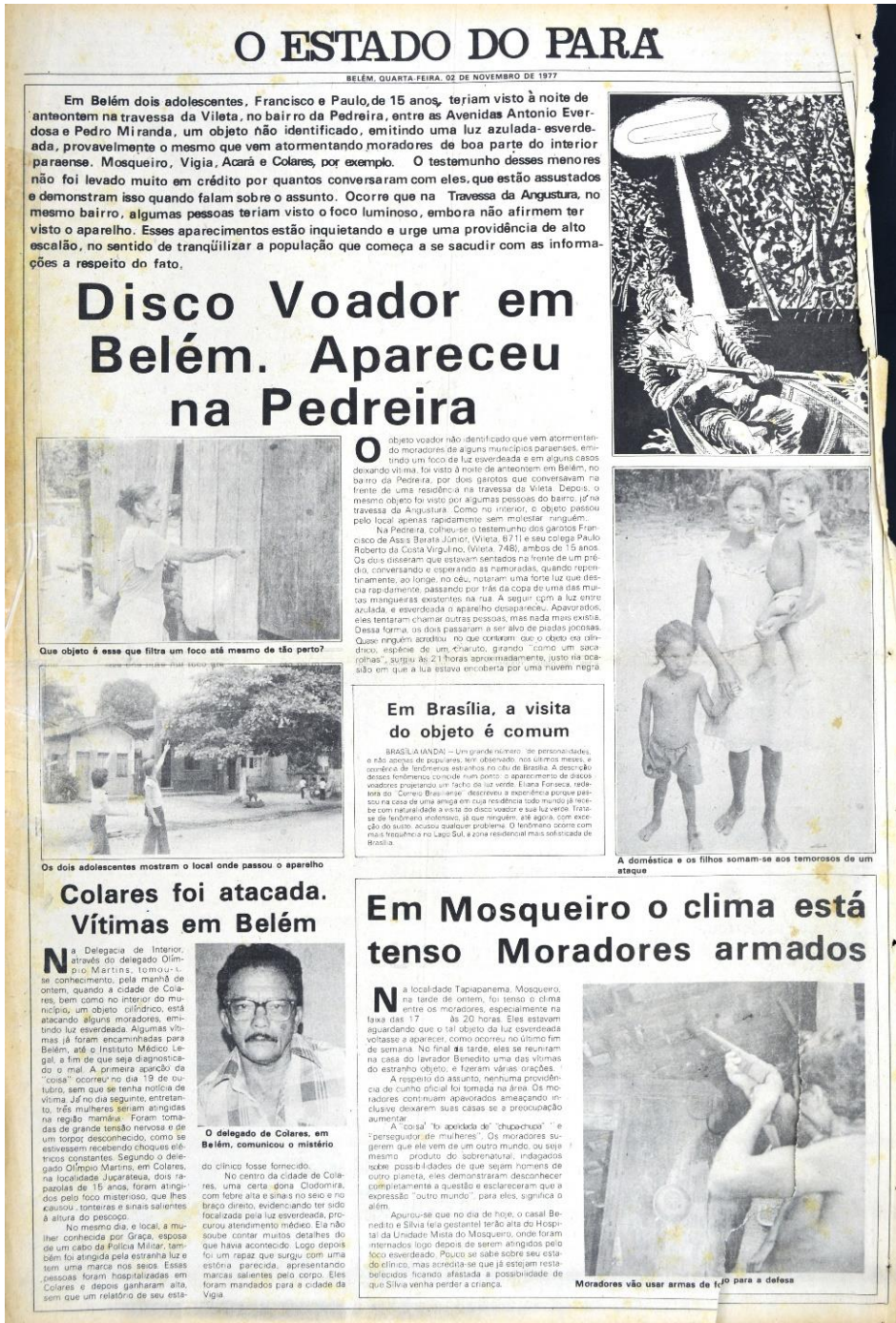
Figura 11 - Múltiplas aparições do Óvnis