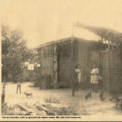
Vila de Imbituba, onde as aparições do objeto voador têm sido mais frequentes.

A variedade de acontecimentos estranhos e inesperados que vêm ocorrendo na Vigia, além dos episódios de violência que provocaram a morte de três pessoas, naquele município, durante os últimos dias, criou um clima de intensa preocupação na vida dos moradores, que têm procurado, de uma forma ou de outra, estabelecer relações entre as aparições do insólito objeto luminoso, os ataques do "bicho sugador" e os crimes bárbaros que movimentaram o lugar. A simultaneidade dos fatos está levando os habitantes da Vigia a uma tentativa de esclarecer o que lhes escapa ao entendimento, por uma visão quase que apocalíptica do conjunto das ocorrências, na intenção de justificar o que lhes parece absurdo através dos acontecimentos cotidianos, embora extraordinários de violência comum.