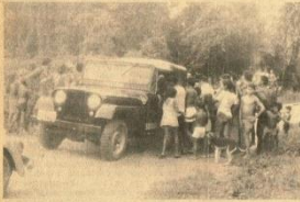
Os moradores do lugar, apavorados, procuram a polícia para se informar e para evitar os acontecimentos.