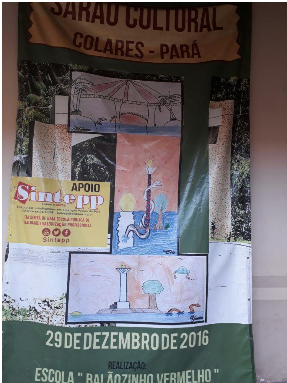
Figura 16 - Banner produzido com imagens desenhadas pelas crianças