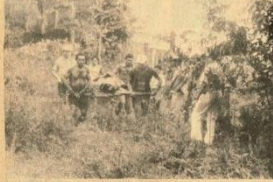
Três pessoas mostram nas últimas horas na Vigia e que habitantes atíbem à irregularidade geral.