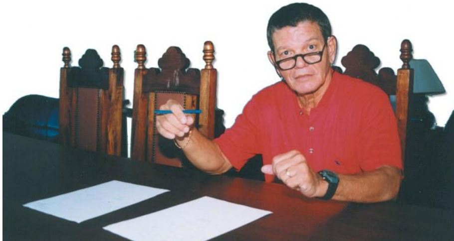
Figura 15 - Coronel Uyrangê Holanda