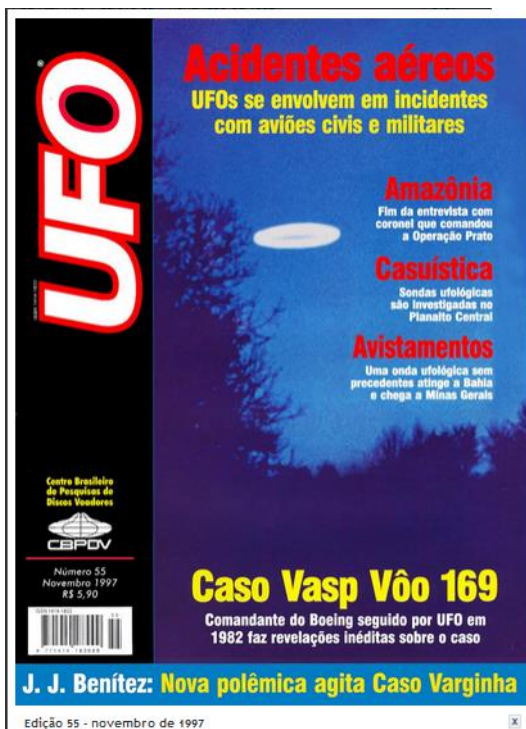
Figura 13 - Continuação da entrevista do Coronel