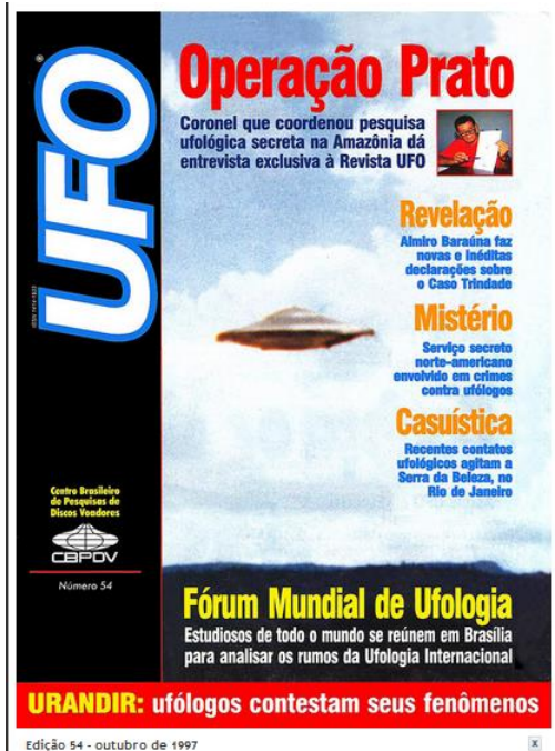
Figura 12 - Coronel rompe o silêncio