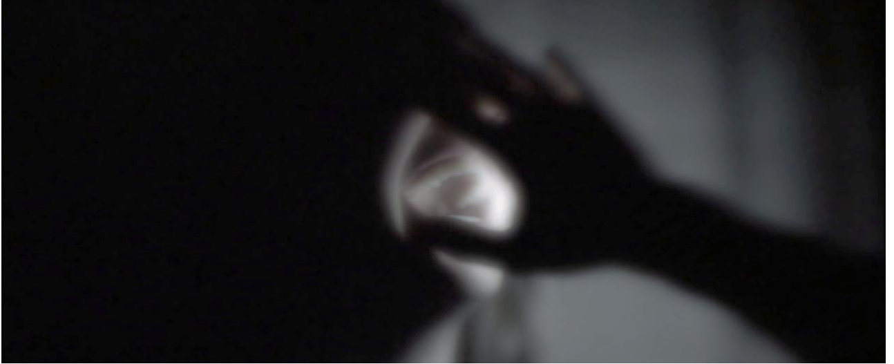
Figura 16 Pesadelo de Léo

Aliás, a trilha nunca é usada como artifício fácil para causar emoção no espectador, apesar de se manter na linha indie-alternativo-melancólico, as músicas principais acabam por comentar os acontecimentos do filme. There's Too Much Love de Belle and Sebastian, Vagalumes Cegos de Cicero e Modern Love de David Bowie não são apenas músicas de fundo, elas definem o clima do filme. Start A War do The National toca logo após Léo se sentir rejeitado pelo amado e diz “ did you really think that you could put me in the safe behind the painting locked it up and leave? Walk away now and you're gonna start a war ” 27 Interessante também quando Ribeiro escolhe por não usar música, como na referida cena do beijo ou quando Gabriel foge da festa.