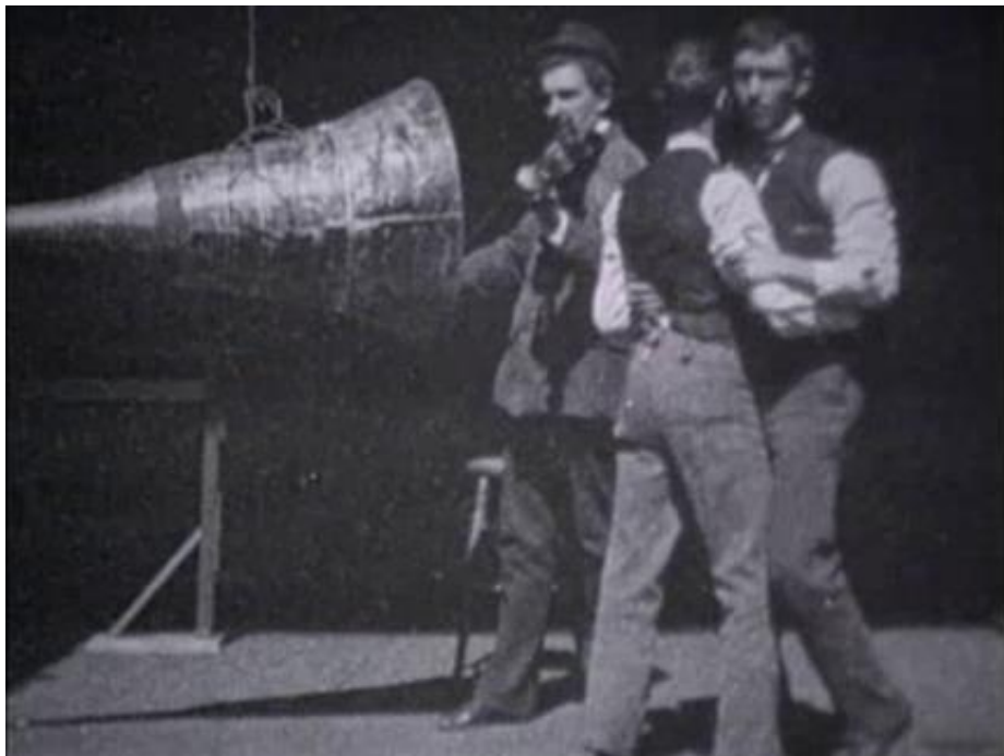
Figura 1 "The Gay Brothers" - experimento com o Kinetophone

O primeiro registro de uma imagem que evocasse algo que pudesse ser entendido como homossexualidade vem do Kinetophone , um experimento pré-cinema que realizava filmes com som sincronizado feito por Thomas Edson em 1895, mesmo ano em que os irmãos Lumiere exibiam pela primeira vez o cinematografo. William Dickson dirigiu o filme que mostra dois homens dançando abraçados enquanto um terceiro, ao fundo, toca violino.