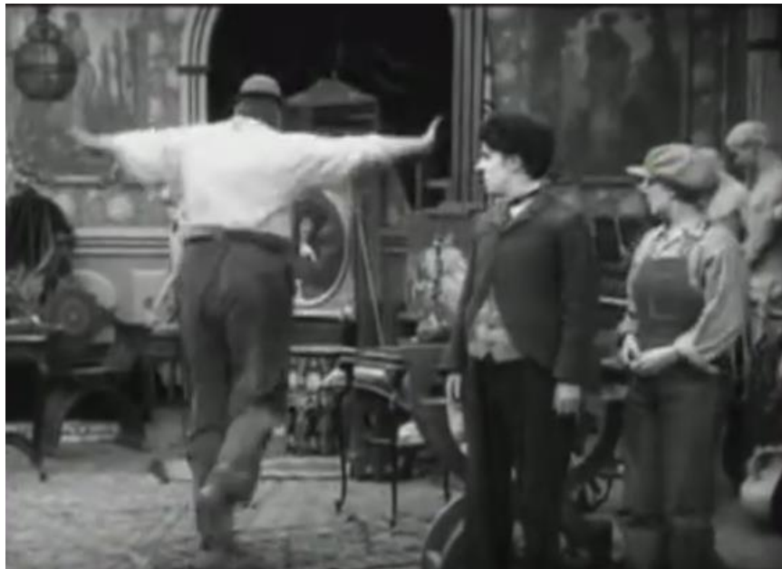
Figura 3 Behind the Screen

A bichinha é um estereótipo ofensivo nesses filmes não por demonstrarem um homem encarnando características femininas, mas por trazerem a mensagem de conversão, por definirem qual masculinidade é certa e, ao definir o homem, excluir o homem homossexual, o abjeto, como posto por Russo na citação acima.