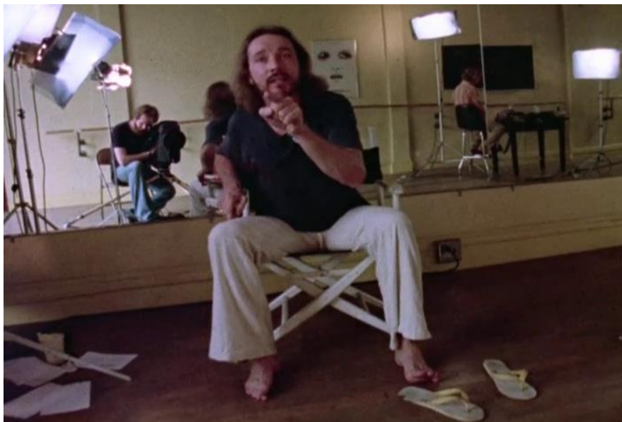
Figura 15 Harkenrider em Word is Out