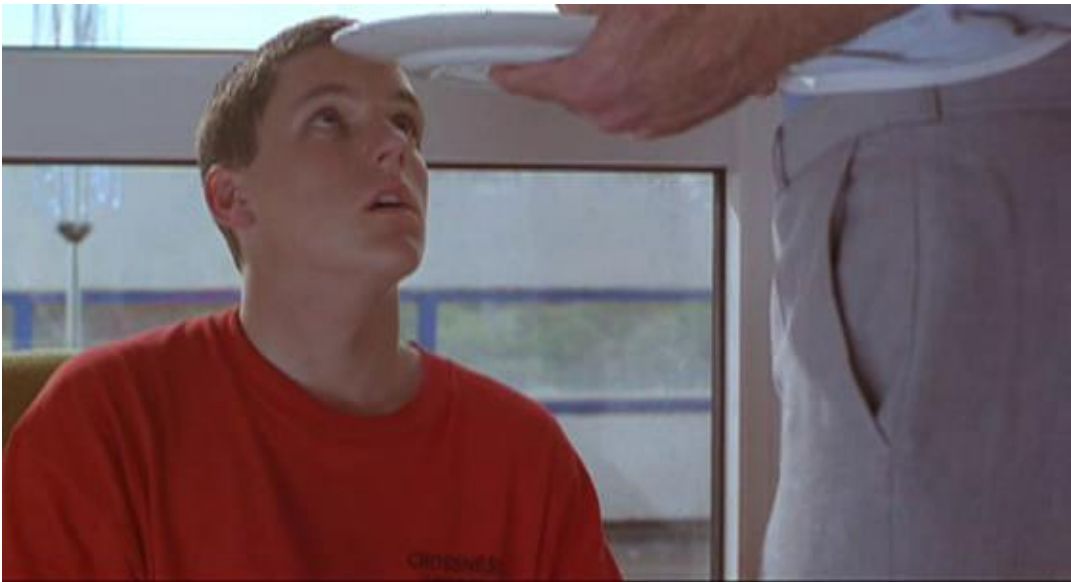
Figura 21 A Opressão do pai

Em contraste com o pai de Ste, Tony é o mais próximo de uma figura de paternidade para Jamie, mas no lugar de simbolizar controle, ele é liberdade. Fuma