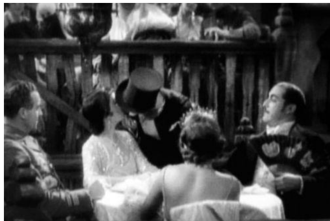
Figura 4 Marrocos, 1930

A bichinha, apesar de ser a forma mais comum de se representar homossexuais nesses primeiros anos do cinema, não era a única. No lado contrário da bichinha, as personagens femininas masculinizadas são tratadas como símbolos de poder e sensualidade. Um dos maiores exemplos disso é Marlene Dietrich em Marrocos ( Morocco , 1930) onde a atriz, vestida com um smoking e cartola, beija outra mulher na boca. Beijo esse que sucede o que acontece em Asas ( Wings , 1927) onde os dois protagonistas, companheiros de aeronáutica, trocam o primeiro beijo gay do cinema americano.