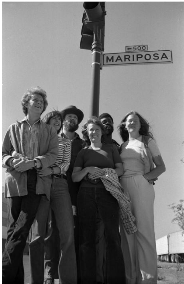
Figura 14 O Mariposa Group

ver a equipe e a câmera refletidas em um grande espelho atrás do entrevistado. Ao entrevistar ele, ao montar a imagem dele, estamos montando a nossa.