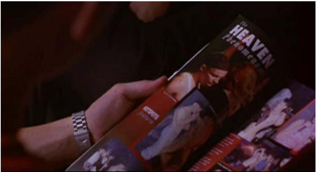
Figura 31 Heaven

A liberdade começa a aparecer em Delicada Atração quando os dois acham na revista o clube gay onde decidem ir. Quando Ste abre a Gay Times , logo chega na página de propaganda do clube com “paraíso” ( heaven ) escrito em letras garrafais.