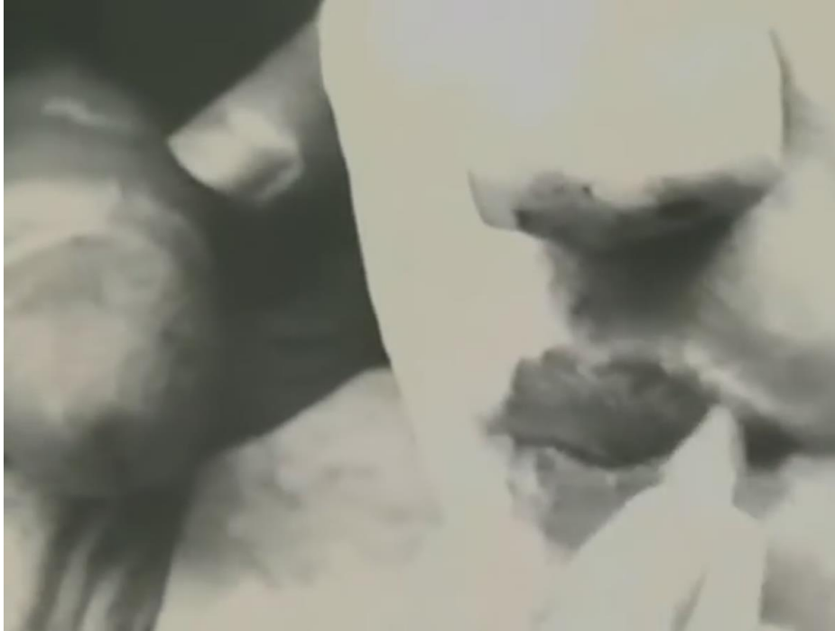
Figura 11 Flaming Creatures , 1963

Enquanto esses filmes experimentais independentes cada vez mais exploravam questões das sexualidades abjetas, o cinema americano mainstream ainda estava restrito pelo Motion Picture Production Code . Durante esse período, na Inglaterra surgem dois filmes que, de formas opostas, levantam o debate sobre a maneira em que a homossexualidade era retratada no cinema.