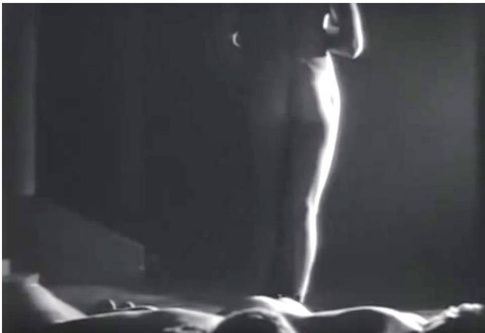
Figura 6 Ló de Sodoma, 1933

Nessas primeiras décadas do cinema existiram algumas tentativas mais ousadas em tratar do tema de sexualidades abjetas, alguns deles catalogados por Russo (1987) são: A Caixa de Pandora (Die Büchse der Pandora, 1929) onde a protagonista do título é provavelmente a primeira personagem explicitamente lésbica do cinema, Salomé (Salome, 1923) que alegava ter um elenco completamente queer e teve cenas de relacionamento homossexual censuradas, Ló em Sodoma (Lot in Sodom, 1933) que mostrava nudez e insinuava o sexo entre homens. Como forma de controlar essa tendência, começa uma busca por formas de se controlar os temas mostrados nas telas.