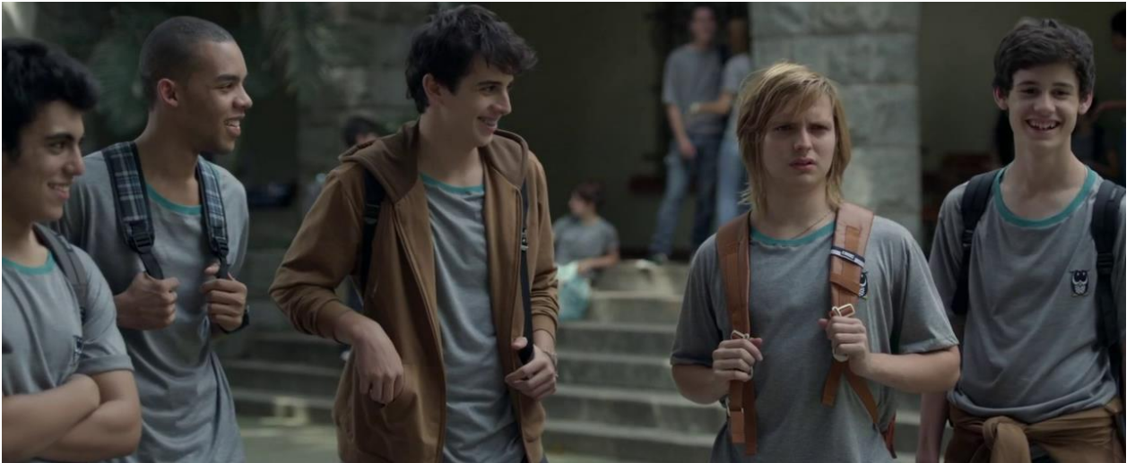
Figura 38 A piada muda de vitima