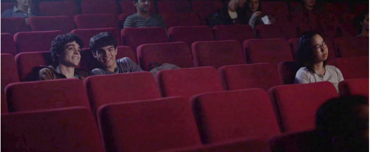
Figura 33 Os dois no cinema