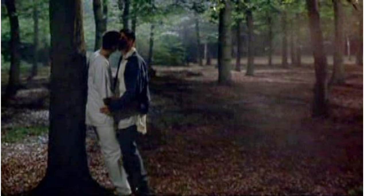
Figura 32 Felicidade e Liberdade