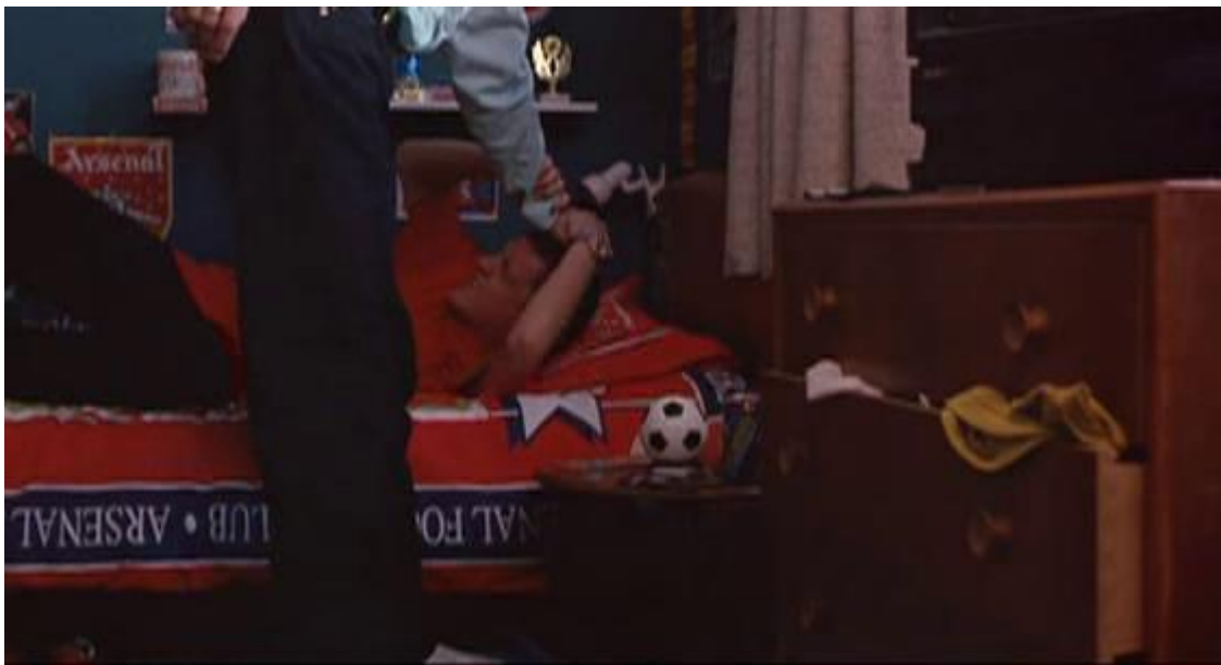
Figura 22 Violência física

Na casa de Ste, tudo é opressor, menos sua cama que é cheia de objetos que fazem referência a esporte e ao time inglês Arsenal. Ele aparece sempre retraído quando em casa. Quase estático em cantos do quadro. Com um medo constante da violência que seu pai e seu irmão sempre depositam nele.