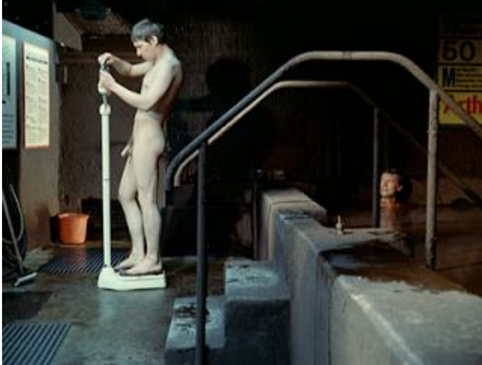
Figura 12 Faustrecht der Freiheit, 1975