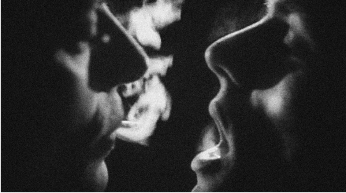
Figura 9 Un Chant d'Amour, 1950

Esses filmes pavimentam o caminho para a verdadeira revolução que aconteceria a partir dos anos 60, culminando na revolta de Stonewall e as obras que seguiram esse momento histórico.