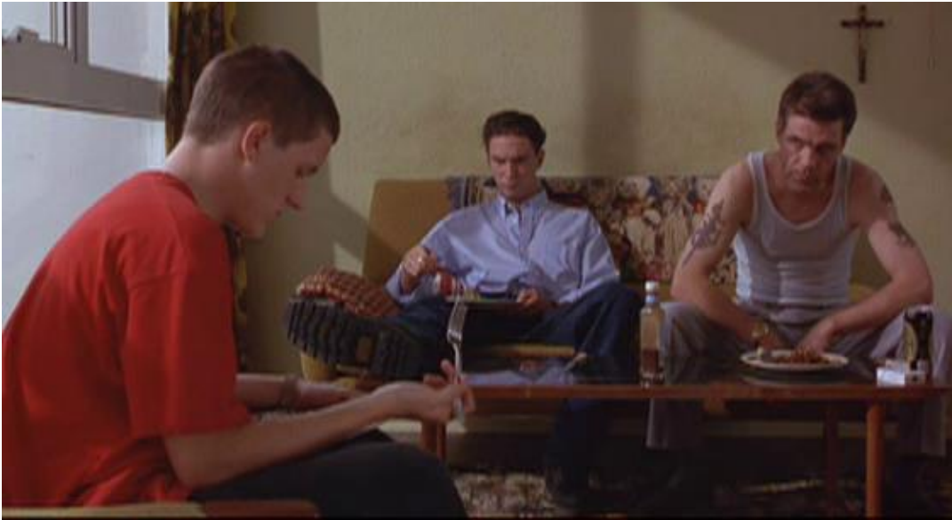
Figura 20 A Família de Ste

uma figura sisuda, carrancuda. Fotografado em um contra-plongée 30 que o transforma em um gigante opressor, contrastando com a figura do menino, diminuído, acuado em um canto da tela.