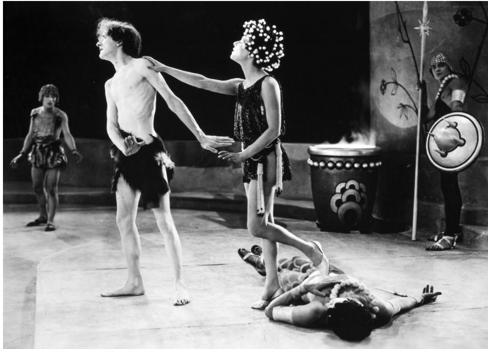
Figura 7 Salomé, 1923

Em 1915 a suprema corte dos estados unidos julgou que "a exibição de filmes é um negócio, puro e simples, originado e conduzido para o lucro, como outros espetáculos, não podendo ser protegido ou ter a intenção de ser protegido... como uma parte da imprensa da nação ou órgãos de opinião pública." Isso significava que filmes não eram abraçados pela garantia de liberdade de expressão garantida pela Primeira Emenda à Constituição. Depois de alguns anos dessa decisão, leis de censura haviam sido aprovadas em Nova Iorque, Florida, Massachusetts, Maryland e Virgínia. A lei de Nova Iorque, promulgada em 1921, era representativa; ela dizia que "um filme deve ser licenciado pelo estado a menos que esse filme ou parte dele seja de tal forma que sua exibição poderá incorrer na corrupção moral ou incitar o crime." Indecência, imoralidade e obscenidade não eram descritas ou definidas no estatuto, dessa forma havia muito espaço para interpretação 9 (RUSSO, 1987, p. 50, tradução nossa).