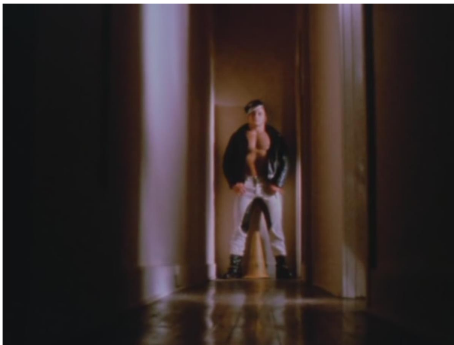
Figura 10 Scorpio Rising , 1964

Já em Flaming Creatures (1963), o diretor Jack Smith monta um mosaico psicodélico de uma orgia, com imagens de órgãos genitais em justaposição com rostos. Ao invés de explorar o sexual do ideal de masculino, Jack se concentra em desenhar imagens que vagam pelo travestismo, entortando gêneros, questionando esses ideais masculinizados de desejo (Escoffier, 2009).