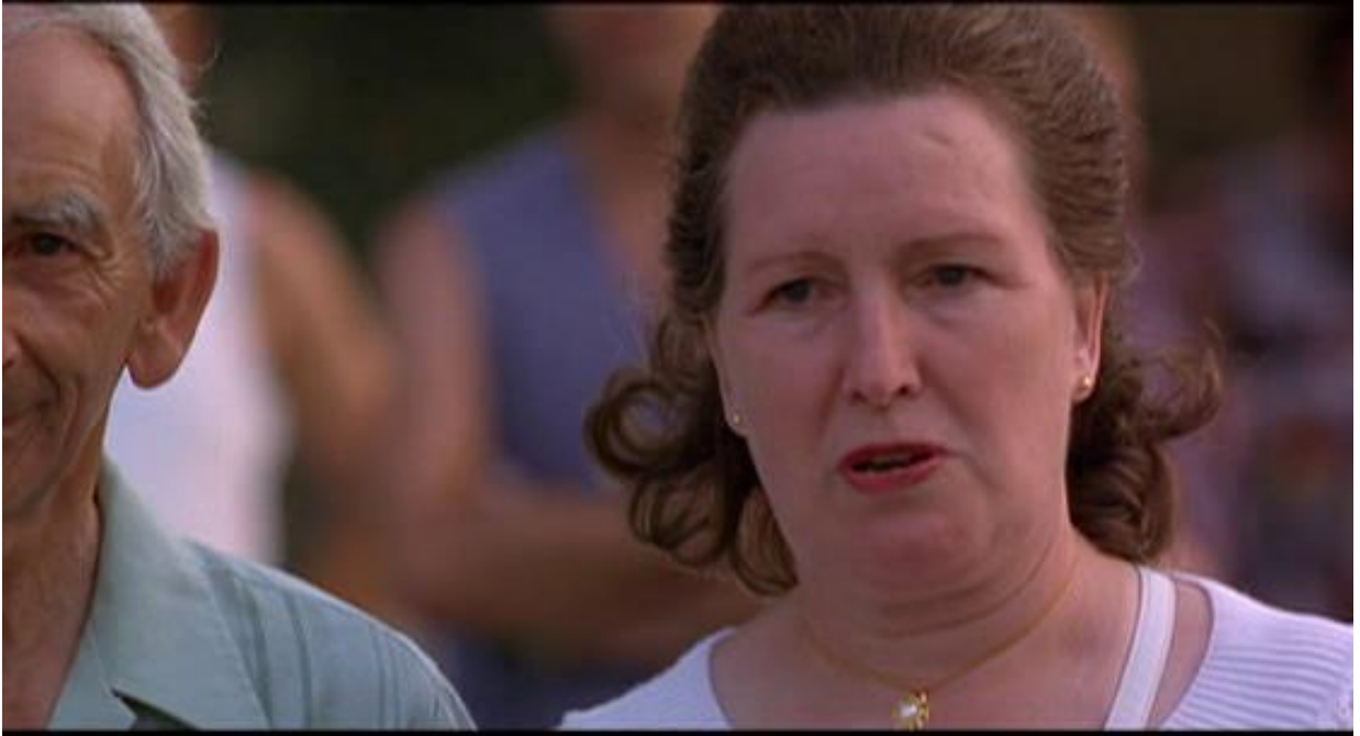
Figura 36 Os olhares de resposta

Já em Voltar Sozinho , o último ato de revolução é começado como uma resposta a uma ofensa. O personagem que sempre ofende Léo, quando vê ele saindo do colégio segurando o braço do namorado, dispara “olha só, o namoro está firme mesmo, Leonardo”. A resposta é imediata. Léo, que está com a mão onde normalmente pessoas com deficiência visual seguram quando estão sendo guiadas, desde seu braço até que dá as mãos ao namorado. O gesto deixa de ser um reconhecido socialmente como de guia e passa a ser de afeto. Com essa ação simples, a vítima da piada torna o próprio personagem que a contou, até seus amigos riem dele. Chamar de gay quem já é e se aceita como tal não é ofensa, é ignorância. Em Voltar Sozinho até os adolescentes imaturos reconhecem isso.