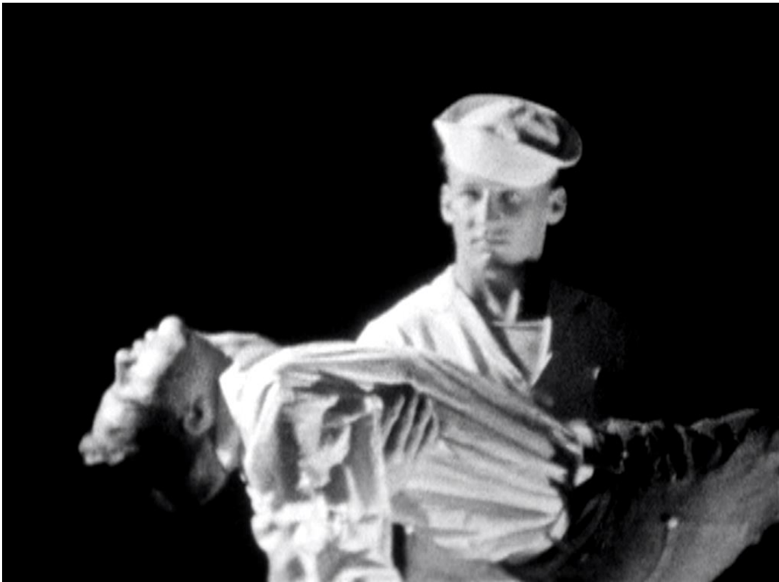
Figura 8 Fireworks , 1947

Outro filme que marca esse início de um Cinema Queer é Uma Canção de Amor ( Un chant d'amour , 1950), único filme dirigido por Jean Genet, cheio de imagens eróticas que evocam a necessidade de contato humano e sexual dentro de uma prisão.