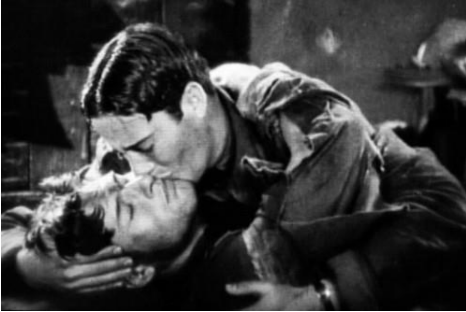
Figura 5 Wings , 1927

Apesar da temática homossexual nesses primeiros filmes estarem escondidas por camadas e camadas de subtexto, ela sempre esteve lá, desafiando convicções e (quase) visível para quem estivesse disposto a enxergar. Essas referências se tornariam ainda mais sutis após 1934, com a criação do Motion Picture Production Code .