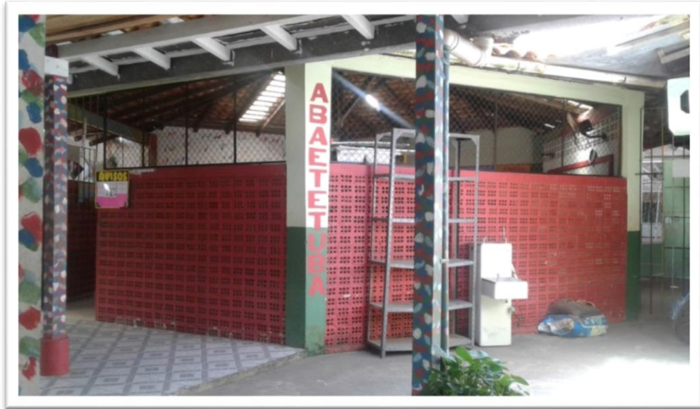
Fotografia 4: Maloca Abaetetuba