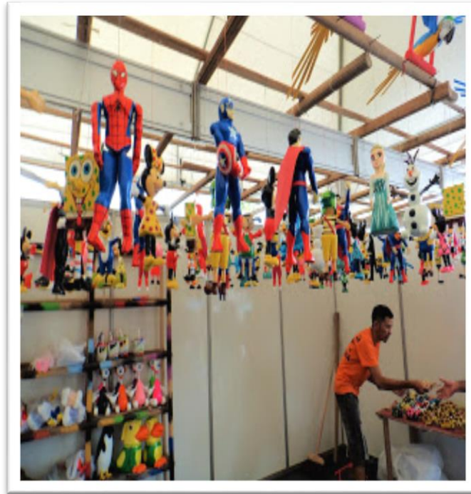
Fotografia 9: Brinquedos de Miriti delineados pela cultura global.