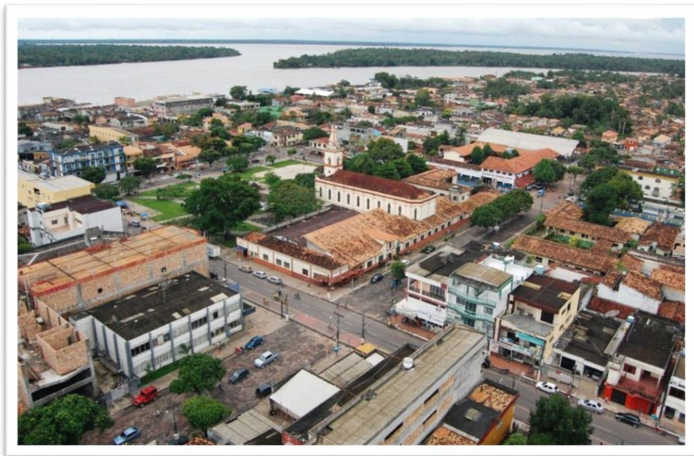
Fotografia 6: Centro da cidade de Abatetuba

Abatetuba é uma cidade com inúmeras manifestações culturais, reconhecida por sua diversidade de artesanatos, com uma rica culinária, com festivais de quadrilha, enfim, a cidade coleciona títulos como Terra da Cachaça 3 , Cidade das bicicletas 4 , Medellín Nacional 5 , esta cidade que se cria e recria através das muitas representações que a compõe foi considerada por Gomes (2012) como “Cidade da Arte”, dentre as muitas formas como a cidade já foi conhecida ela é considerada hoje como “A Capital Mundial do Brinquedo de Miriti”.