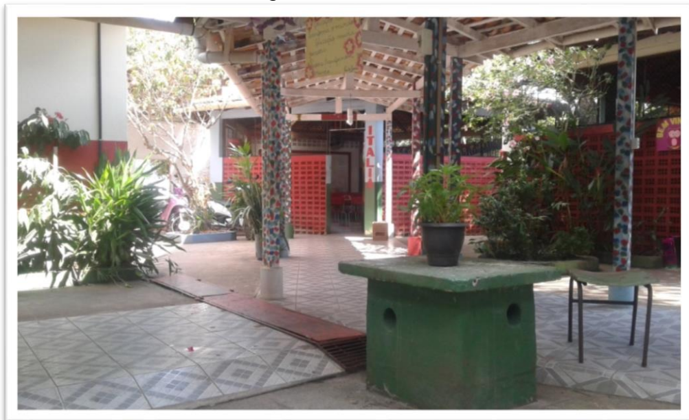
Fotografia 2: Maloca Itália

A estrutura das salas de aula chama bastante a atenção, pois elas tem formato de maloca (oca indígena), em homenagem a Educação Indígena, o que diferencia da arquitetura de outra escolas; cada uma tem um nome específico que são: Itália, Pará, Brasil, Amazônia, Abaetetuba, Ferranti, sendo que a sala Amazônia é a única que não tem o formato de maloca, pois foi construída posteriormente para atender a demanda de alunos na escola; nela há pinturas na parede com belas paisagens da flora e fauna amazônicas, com o objetivo de levar aos alunos que nela estudam, a refletir sobre a preservação do meio ambiente e dos animais. Há uma sala adaptada no bloco administrativo que não possui um nome específico como as outras, pois também foi criada com o intuito de aumentar o número de turmas para oferecer mais vagas, já que a escola é bastante procurada.