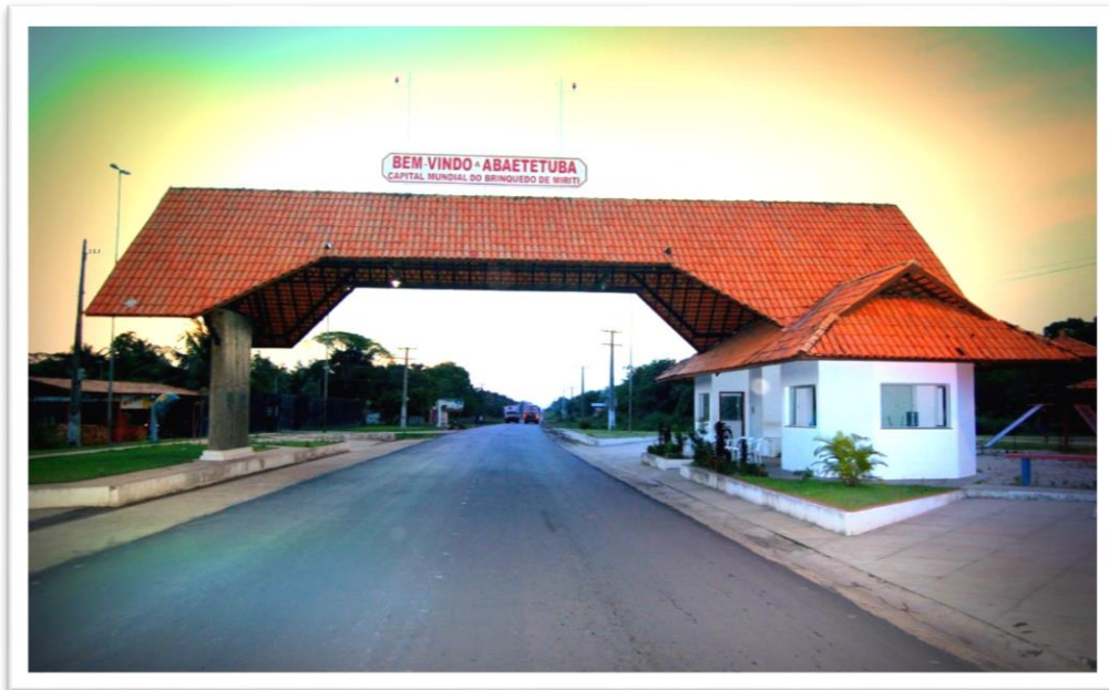
Fotografia 7: Portal de Entrada da Cidade