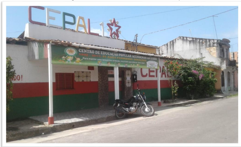
Fotografia 1: Fachada da Escola Cepal