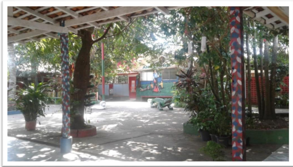
Fotografia 3: Pátio da escola CEPAL